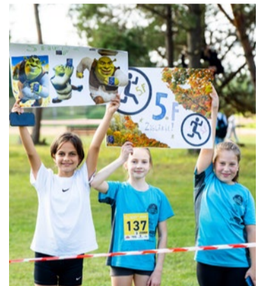
Ķekavas vidusskolas līdzjutējas atbalsta savus klasesbiedrus.

Visi sacensību rezultāti atrodami timekļa vietnē fotofiniss.lv . Foto atskats pilnā apjomā publicēts Ķekavas novada Sporta centra faiiem.lv publiskajā profilā "KNSC".