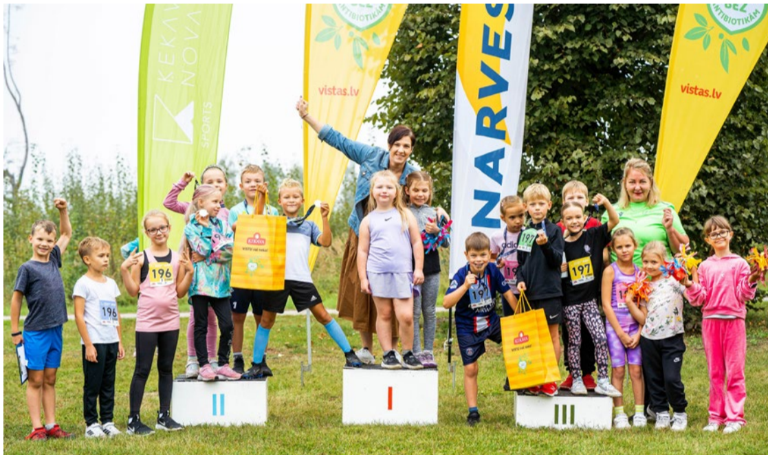
Privātās pamatskolas "Gaismas tilts '97" 1. klase lepojas ar iegūtajām sudraba un bronzas medaļām.