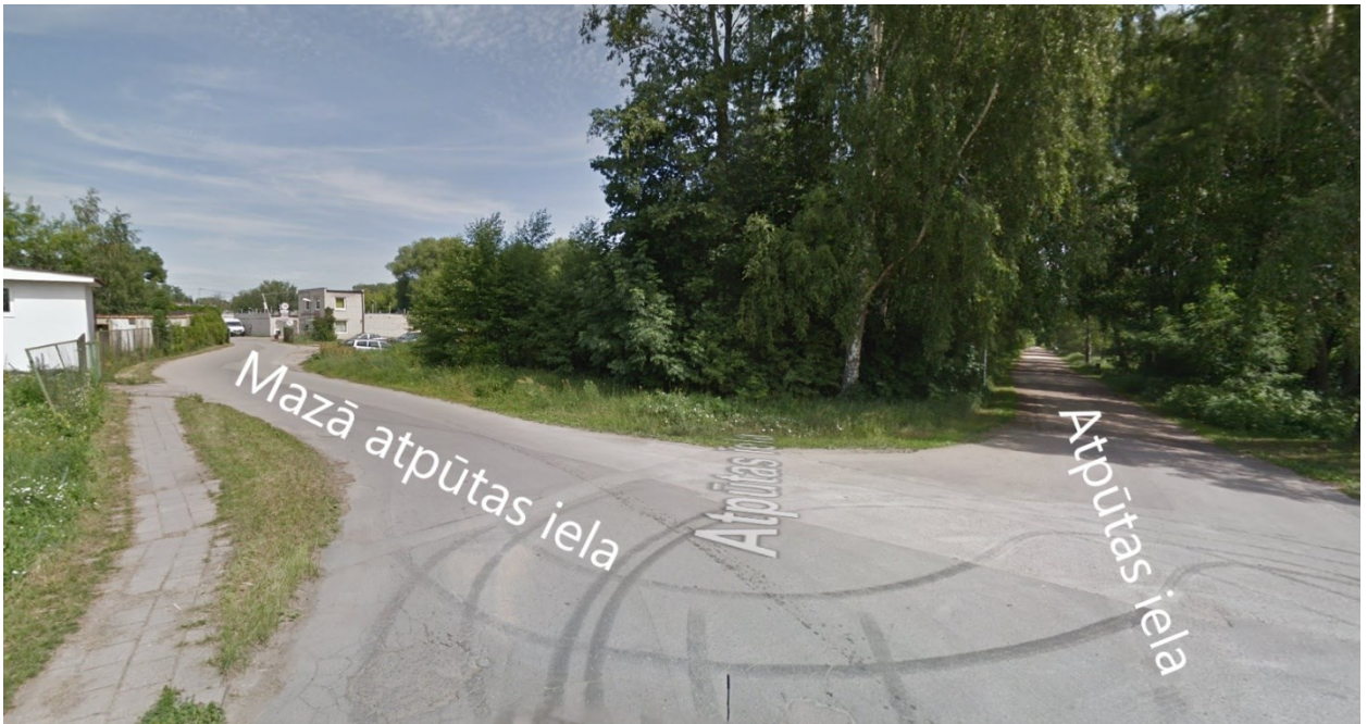
1.att. Piekļūšana detālplānojuma teritorijai

Piekļūšana detālplānojuma teritorijā nodrošināta no R puses – plānotās Mazās atpūtas ielas(servitūta ceļš), tālāk no Atpūtas ielas (kad.apz. 80700010120), kas dienvidu daļā robežojas ar detālplānojuma teritoriju.