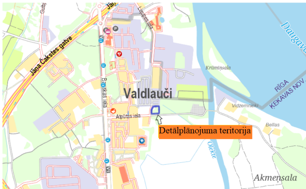
1.att. Detālplānojuma teritorijas novietojums

Detālplānojuma teritorija atrodas Ķekavas novada, Ķekavas pagasta Valdlauču ziemeļu daļā pie Atpūtas ielas (skat.1.att.). Detālplānojuma teritoriju veido viena zemes vienība – nekustamā īpašuma “Olektīte” zemes vienība ar kadastra apzīmējumu 8070 001 0048. Zemes vienības platība – 0.3293 ha. Detālplānojuma izstrādes robežas atbilst īpašuma robežām.