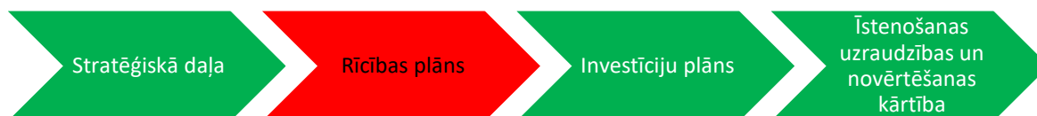
1.att. Attīstības programmas galvenās sastāvdaļas

Ķekavas novada Attīstības programma 2021.- 2027.gadam ir vidēja termiņa plānošanas dokuments, kurā noteikts attīstības redzējums līdz 2027. gadam.