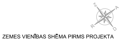
ZEMES VIENĪBAS SHĒMA PIRMS PROJEKTA