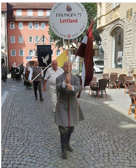
Eiropas Latviešu apvienība pasniedza pateicības rakstus visiem kolektīviem, kas

piedalījās šajos nozīmīgajos svētkos. Svētkus rīkoja un atbalstīja Latvijas Republikas Kultūras ministrija, kuru personīgi pārstāvēja un uzrunas teica kultūras ministrs Nauris Puntulis, Latvijas Nacionālais kultūras centrs, Latviešu kultūras biedrība „Saime” Štutgartē, Eiropas Latviešu apvienība, Latviešu Fonds.