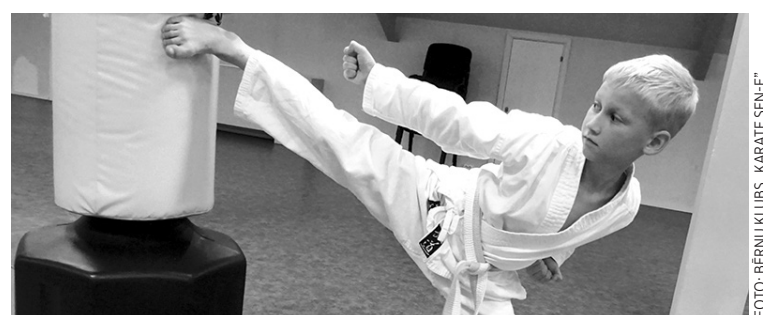
Haralds gatavojas sacensībām.

Čempionātā piedalījās Latvijas Karatē federācijas (LKF) biedri, apmēram 30 Latvijas karatē klubu, 285 sportisti kategorijās „Kata” (tehnikas komplekss) un „Kumite” (cīņa ar pretinieku). Tiesāt tika aicināti LKF un ārvalstu tiesneši, kuri atestēti ar augstāko nacionālo kategoriju vai ar EKF/WKF licenci ( European/