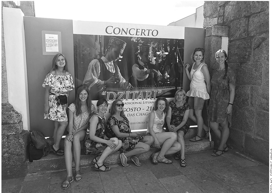
Pie „Dzītari” koncerta plakāta...

li. Ne vienmēr nosaukums ir tas, pēc kā vajadzētu vadīties, jeb „neskati vīru pēc cepures”. Komisks atgadījums bija, kad meitenes pasūtīja desertu ar nosaukumu „Romeo un Džuljeta”. Cerēdamas uz siera kūku... sagaidījām siera