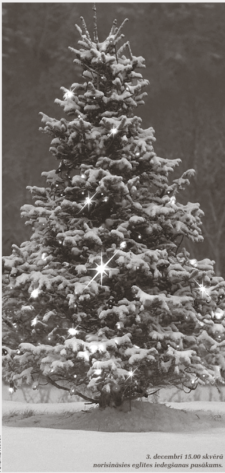
3. decembrī 15.00 skvērā norisināsies eglītes iedegšanas pasākums.

26. decembrī plkst. 17.00 Ziemassvētku egle pašiem mazākajiem. Leļļu izrāde „Ziemassvētki nostāstu ielā”. Tikšanās ar rūķi un Ziemassvētku vecīti. Tālrunis 29151386.