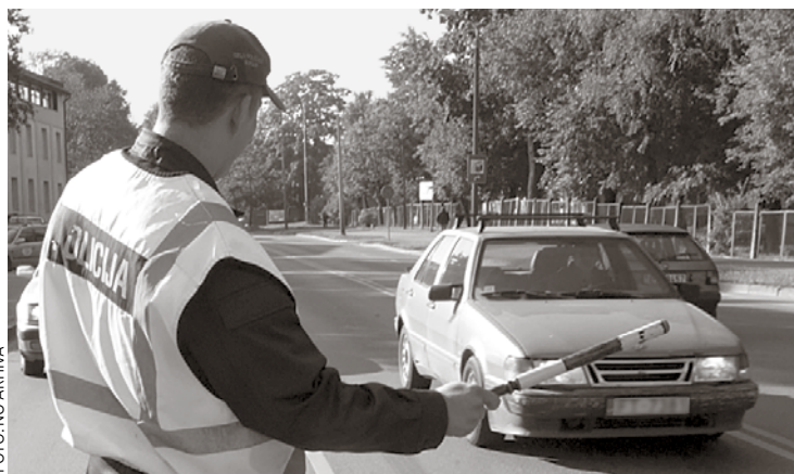
Ceļu policijas darbinieki atgādina, ka sēdies pie stūres bez autovadītāja apliecības ir rupjš ceļu satiksmes noteikumu pārkāpums.

Baldones novada pašvaldības policijas (turpmāk – BNPP) darbinieki