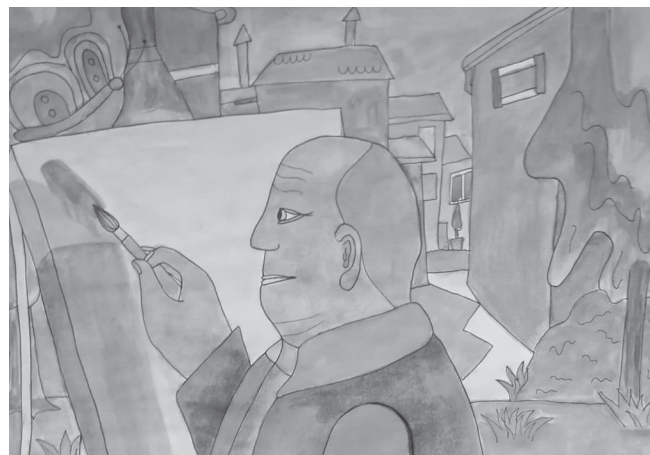
K. Kriškovskas zīmējums