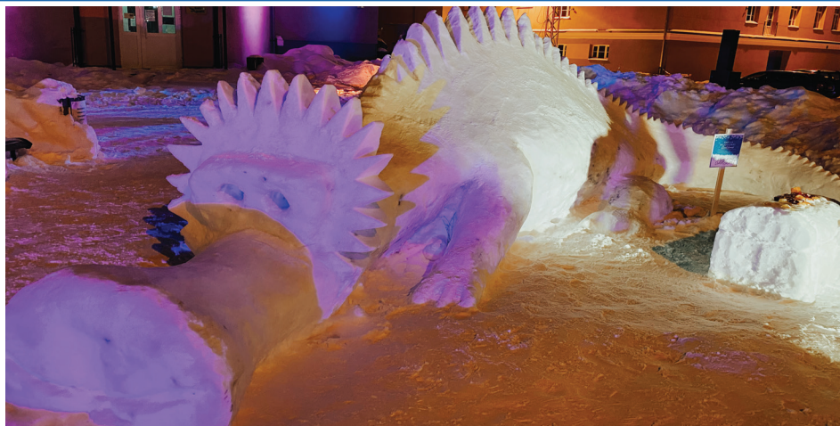
Sniega skulptūru konkursa uzvarētājs - "Pūķenes dārgumi", ko veidoja Kupču ģimene. Foto: E. Dišlere. Foto galerija www.baldone.lv