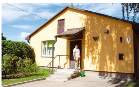
Dienests uzturas koši dzeltenā mājā Iecavas ielā 8, Baldonē