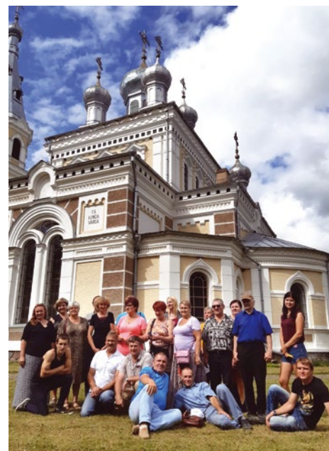
Darbinieku ekskursija šī gada augustā