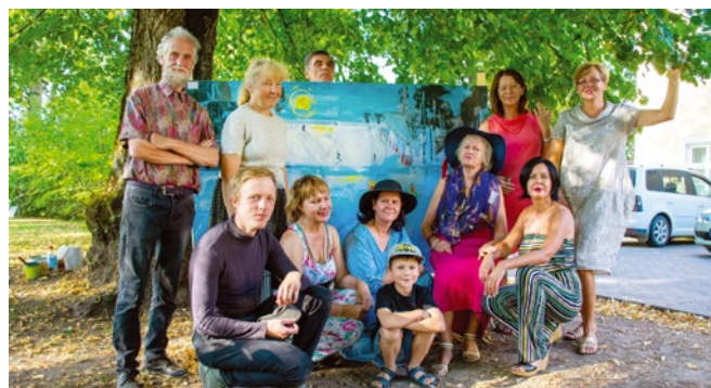
Kopdarbs Riekstukalna ziema