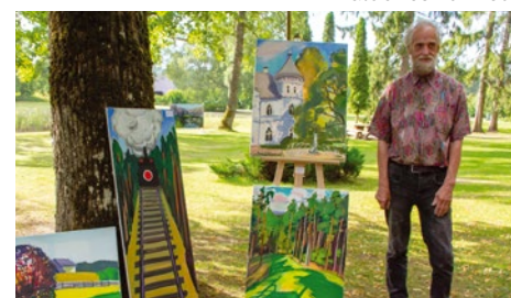
Juris Ģermanis Pagātnes dzelzsceļi