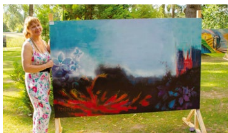
Ausma Gašpēre Dūņu purvs

Irina Sietiņa Tūrisma organizatore