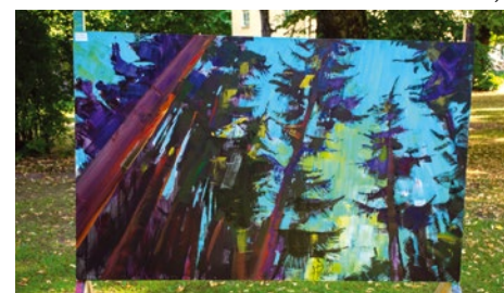
Aivis Pīzelis Baldones meži