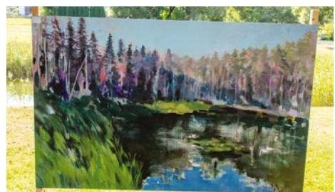
Dārta Hapanioneka Liliju ezers