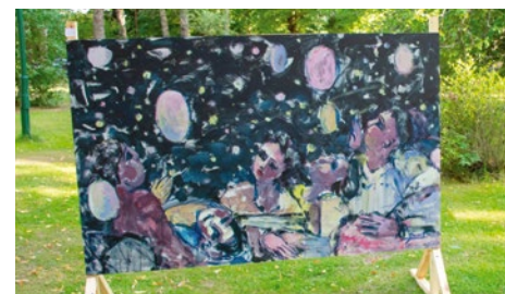
Līga Jukša Baldones observatorija