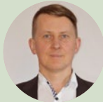
Raimonds Audzers Baldones novada Domes priekšsēdētājs