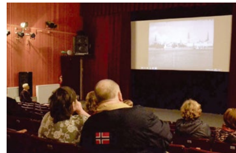
Pasākuma apmeklētāji bauda arhīvā esošo filmu “Brauciens pa ziedošo Zemgali”.