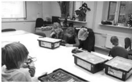
Foto no Baldones vidusskolas arhīva programmas, t.sk. STEM jomā (no anaļu val. Science, Technology, Engineering and Mathematics ). Skolēniem bija iespēja apmeklēt zinātkāres centru “Zinoo”, “Mazo brīnumzemi”, animācijas darbnīcas, vērot dronu demonstrācijas, tehniski radošās darbnīcas u.c.

Projekta īstenošanas rezultātā ir izstrādātas un ieviestas jaunas mācību pieejas formas mācību satura apguvei (individualizētās nodarbības matemātikā, dabaszinībās, nodarbību cikli, mācību vizītes u.c.), kā arī nodrošināti alternatīvi izglītības pasākumi (tehniskās dienas, tematiskās nometnes, konkursi, inovatīvas interešu izglītības