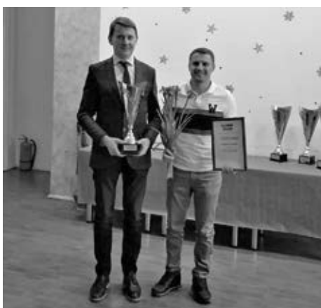
rāk noorganizētajām sacensībām, kopumā 5 sporta veidos. Paldies visiem, kas startēja, un tiekamies 2020. gadā Pierīgas sporta spēļu maratonā!

Baldones novads tika godināts par visvai-