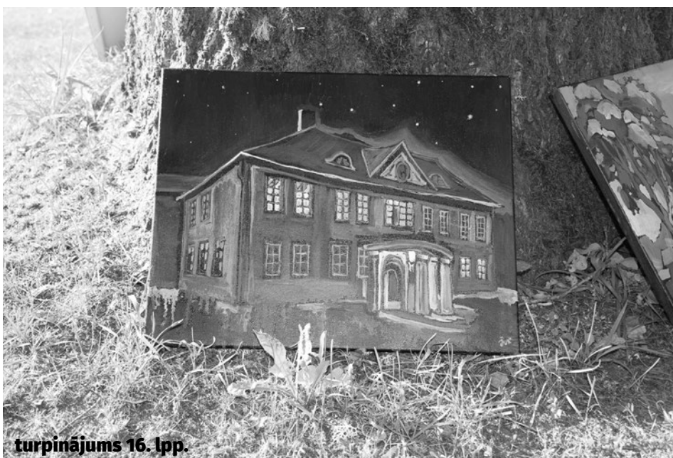
turpinājums 16. lpp.

Tūrisma un sabiedrisko attiecību speciāliste