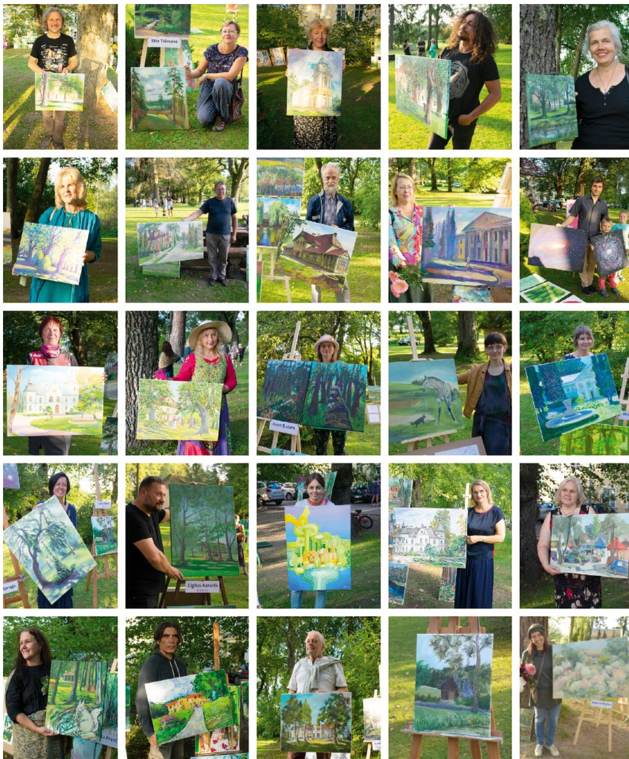
“Mākslinieku plenērā uzgleznotās un Baldones novada domei dāvinātās gleznas”