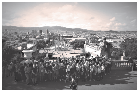
Barcelona- draugi atpūtas brīdī Barselonā.