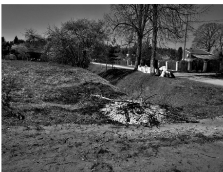
Paralēli citā sektorā savākti pa ziemu sakritušie zari.