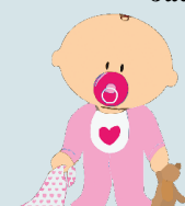
Meitenītes – 1