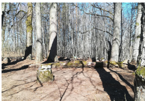
Sakopta Štēku dzimtas kapavieta.