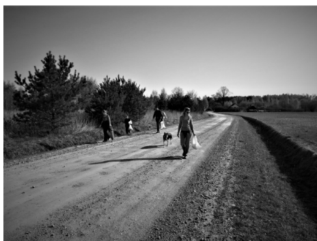
Pulkarnieši Sakopj savu apkaimi.