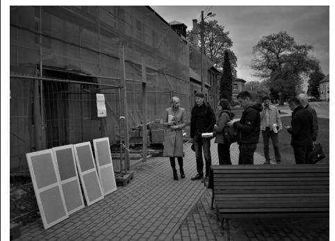
Būvdarbi projektā "Energoefektivitātes paaugstināšana sociālajā aprūpes centrā "Baldone"