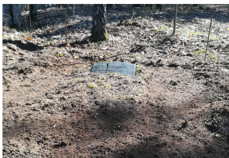
Sakopta kapavieta "Trīs nezināmiem padomju aktīvistiem".