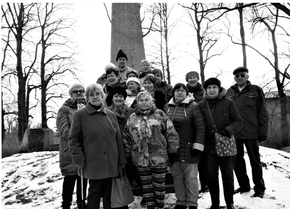
Biedrība "Sābri" Iecavā

Tālāk mūsu ceļš veda uz Iecavas upes kreiso krastu - uz seno svētvieta Dievdārziņu, no kura paveras skaists skats uz Iecavas upi un baznīcu. Teika stāsta, ka sākumā šeit bijusi paredzēta baznīcas celtniecība, bet visi dienā savestie akmeņi naktī sagrausti upē, tādēļ baznīcas celtniecībai izraudzīta cita vieta. Dievdārziņš tiek uzskatīts par 1812. gada karā kritušo Napoleona virsnieku apbedīšanas vietu. No kalniņa koka kāpnes