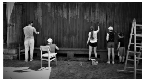
Četras krāsotājas un viens krāsotājs.