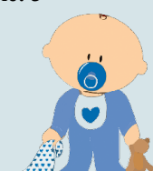
Puisīši – 2