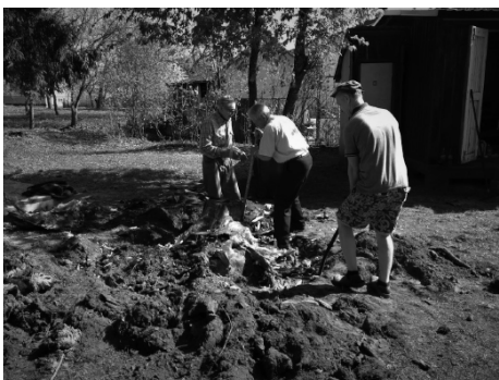
Trīs vīri un trīs likvidēti celmi.