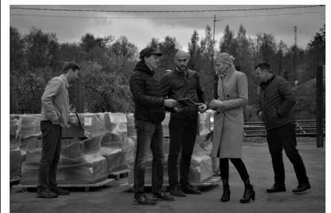
Tirgus laukuma rekonstrukcijas būvdarbi projektā "Baldones novada tirgus laukuma infrastruktūras attīstība"