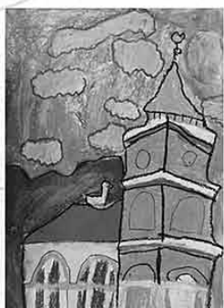
Anete Korotkeviča, 9 g.

Izbrauc, izstaigā vai iznūjo marķēto Baldones Taku, atpazīsti visas Baldones Mākslas skolas audzēkņu zīmētās vietas, nofotografējies pie tām un laimē kādu no balvām!*