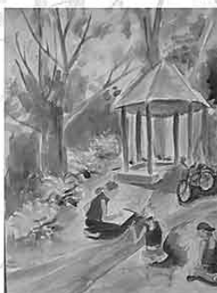
Elga Bijķina, 13 g.