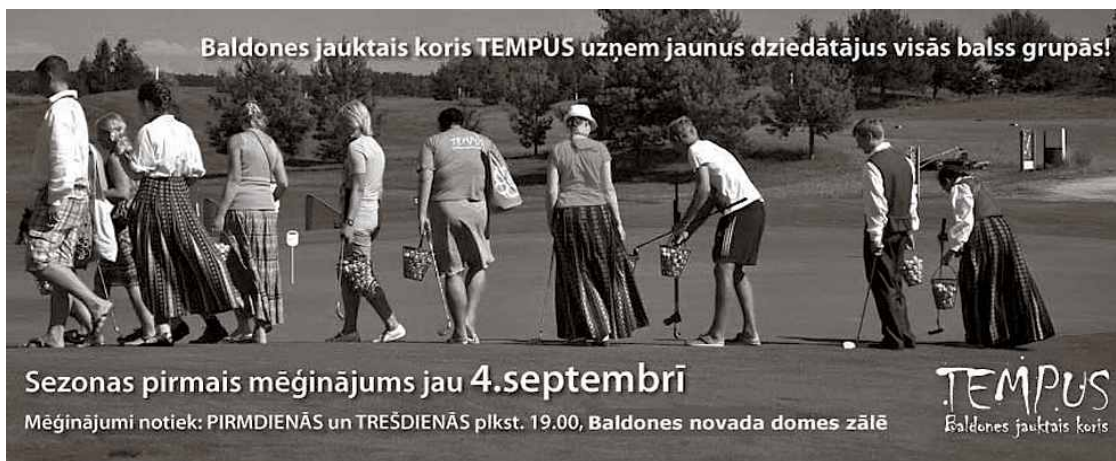
Baldones jauktais koris TEMPUS uzņem jaunus dziedātājus visās balss grupās!

Sezonas pirmais mēģinājums jau 4.septembrī