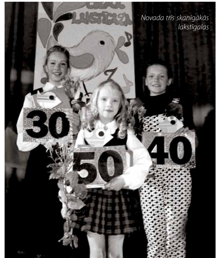
Novada trīs skanīgākās lakstīgalas

Šoreiz konkursa žūrijas sastāvā bija arī starptautiskā populārās mūzikas izpildītāju konkursa “Aprīļa pilieni” organizatori, kas sešiem jaunajiem Baldones dziedātājiem dāvāja iespēju veselu mēnesi bez maksas apmeklēt vokālās mākslas studiju “Aprīļa pilieni” un mācīties pie profesionāliem pedagogiem bez maksas. Savukārt pirmo trīs vietu ieguvēji saņēmu ielūgumus uz Dailes teātra izrādi “Vārnu ielas republika”. Finansiāli konkursu atbalstīja arī Baldones novada Dome. Pirmo trīs vietu ieguvēji saņēma naudas balvu,