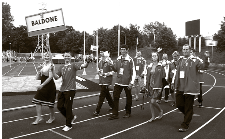
Olimpiādē Baldones novadu pārstāvēja 21 sportists.