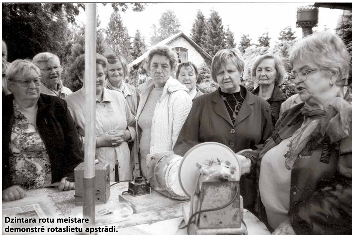
Dzintara rotu meistare demonstrē rotaslietu apstrādi.