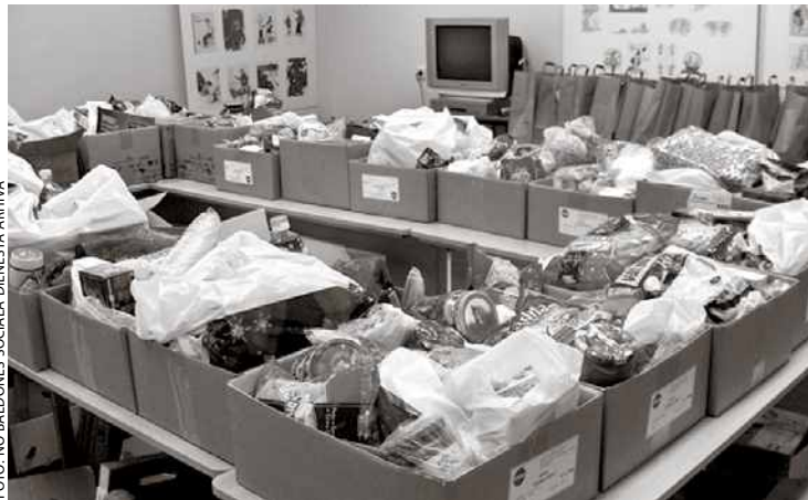
Baldoniešu sarūpētās pārtikas pakas

Svētki izskanējuši, jaunais gads rit pilnā sparā, tomēr noteikti vēlamies pateikt paldies visiem tiem bērniem, kuri atsaucās aicinājumam piedalīties labdarības akcijā "Uzzīmē ziemu" un ar saviem fantastiskajiem Ziemassvētku apsveikumiem iepriecināja Baldones iedzīvotājus, kā arī Sociālā dienesta sadarbības partnerus Talsos, Ventspilī, Rīgā, Ķekavā, Zviedrijā un Jelgavā.