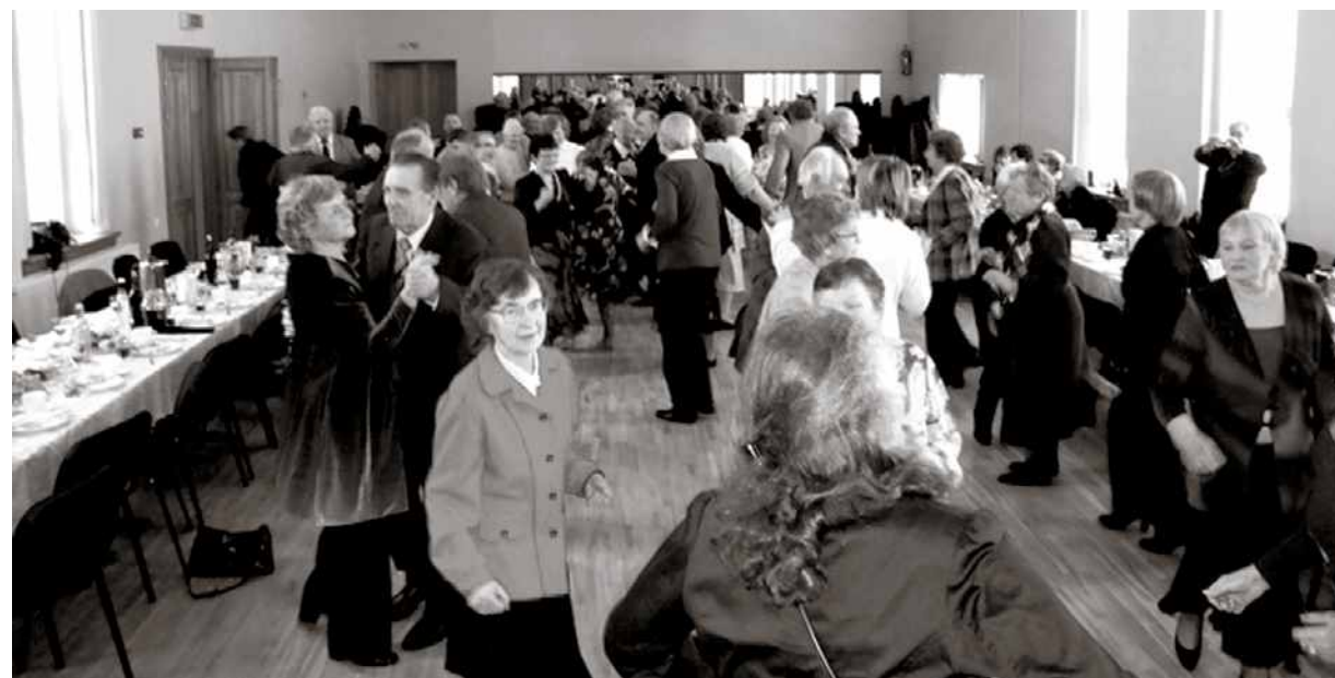
Dejas un draudzēšanās