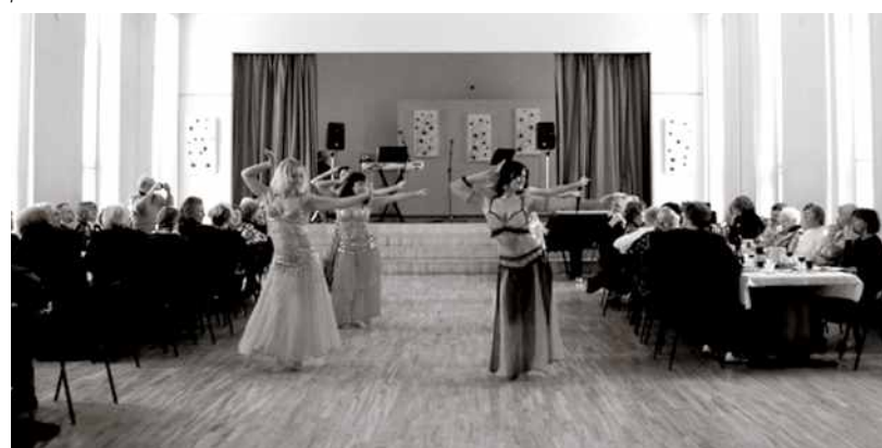
Uzstājas Baldones vēderdejojotājas.