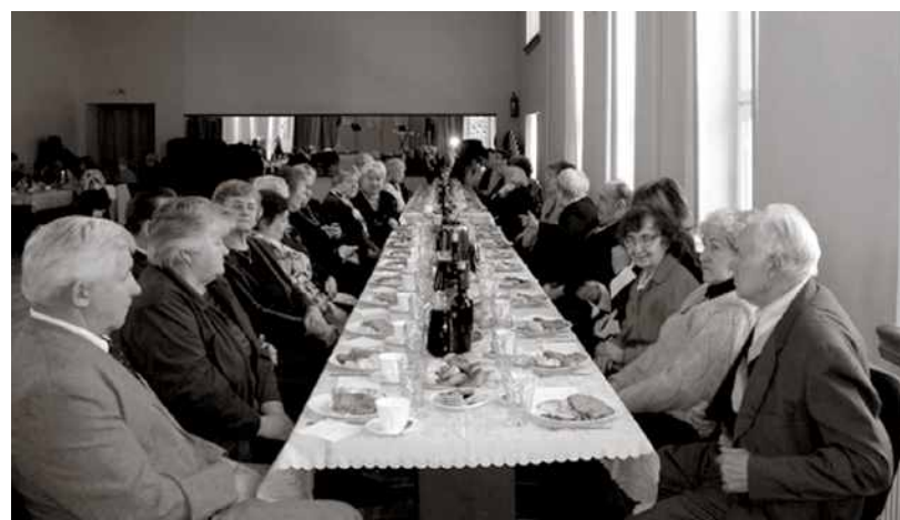
Baldones seniori pie svētku galda