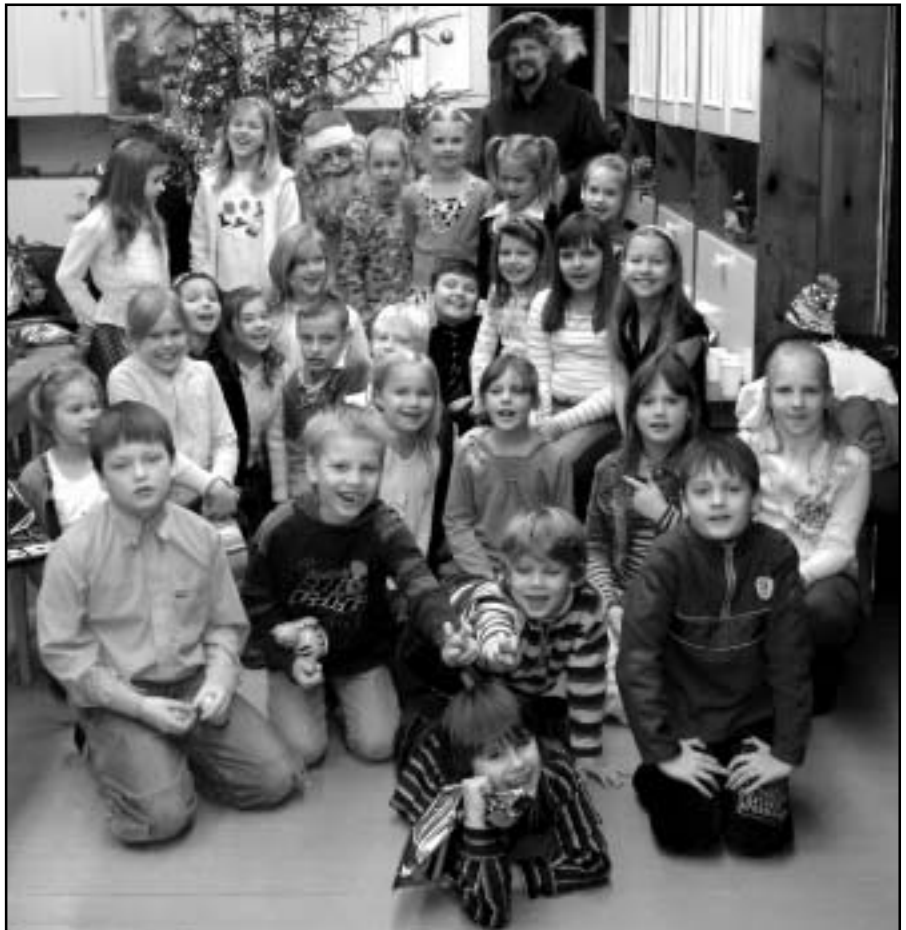
Mākslas skolas Ziemassvētku eglīte.