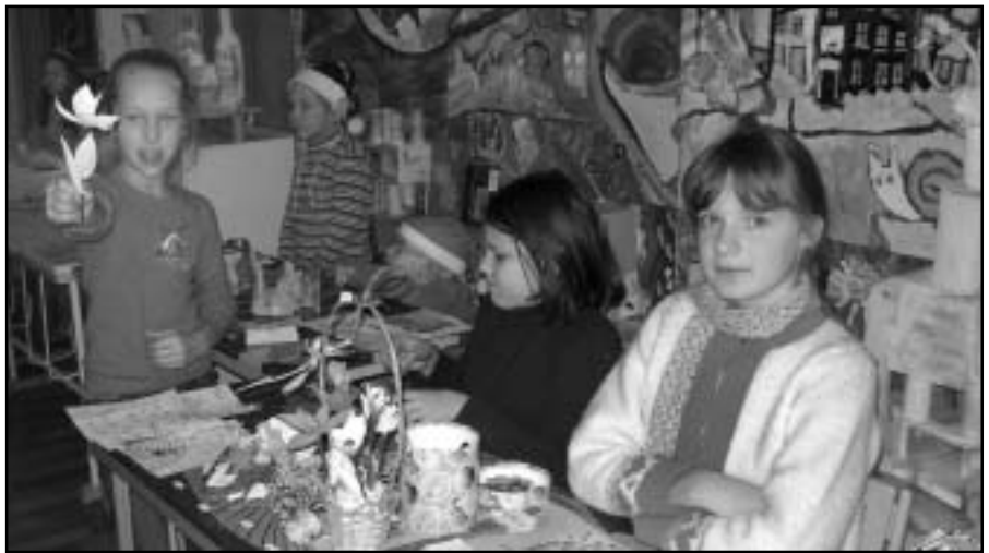
Ziemassvētku tirdziņš Baldones mākslas skolā.