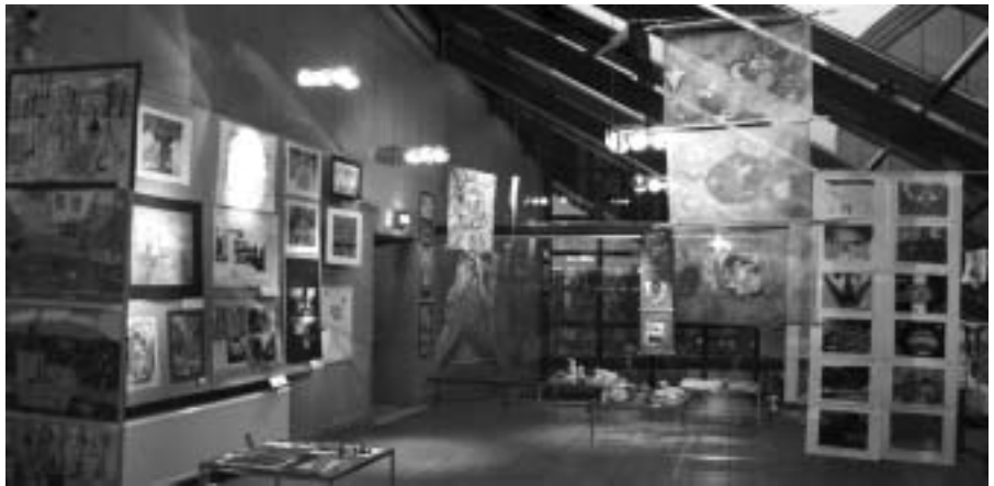
Izstāde Rīgas domē.