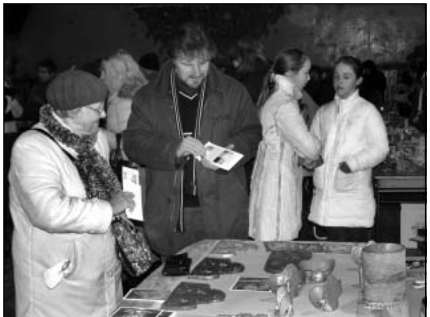
Tirdzniecība iet no rokas.