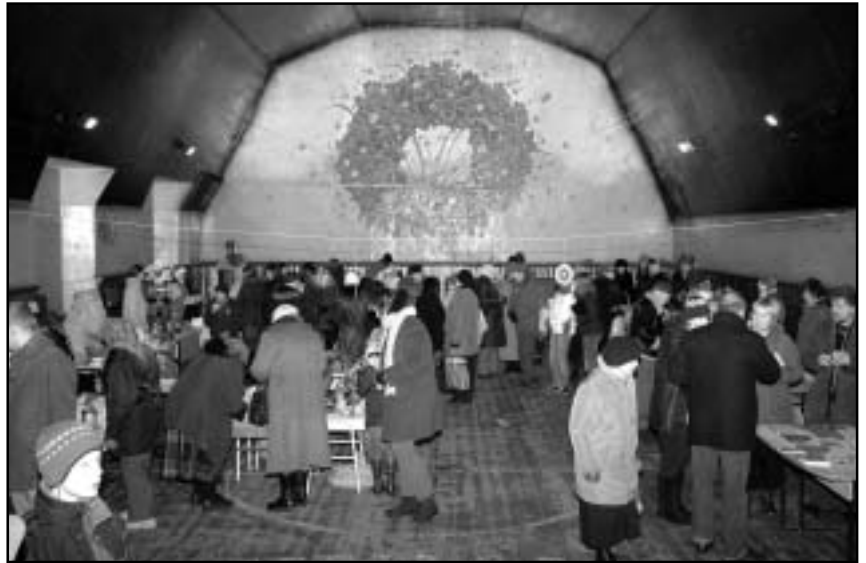
Pircēju un pārdevēju rosība Ziemassvētku gadatirgū bija varena.

Baldones kultūras biedrība Fotogrāfs Ivo Odītis