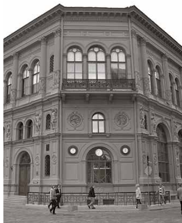
Projekta “Garā pupa” ietvaros 23 Baldones novada bērniem tika dāvāta ekskursija uz Rīgu. Attēlos: Rīgas biržas ēka un skats no izrādes “Lellīte Lolīte”.

Biedrības “Ascendum” mērķis ir veicināt Latvijas augšupēju – ekonomisko, garīgo un sociālo –, mērķtiecīgi atbalstot kultūru, zinātņi, izglītību un pilsonisko sabiedrību. Bērnu kul-