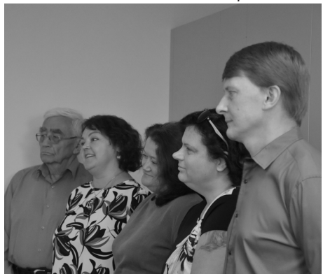
FOTO: DBIEDRĪBAS "SĀBRI" UN DOMES PĀRSTĀVJI DIENAS CENTRA ATKLĀŠANĀ

Projekta ietvaros tika izremontētas un labiekārtotas Dienas centram paredzētās