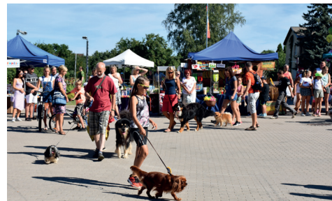
MĀJAS MĪLUĻU PARĀDE.