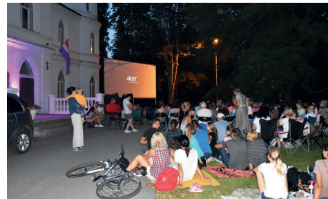
ĀRA KINO BALTĀS PILS PARKĀ.