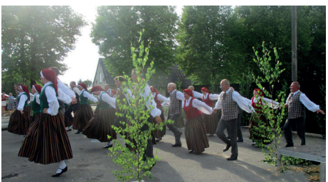
"DEGSME" UN "DEĢĻI" DEJO TIRGUS LAUKUMĀ.