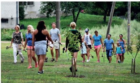
NŪJOŠANA TRENERA PAVADĪBĀ.