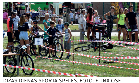
DIŽĀS DIENAS SPORTA SPĒLES.