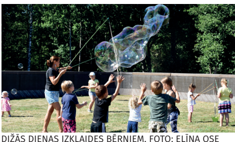
DIŽĀS DIENAS IZKLAIDES BĒRNIEM.