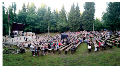
DIŽKONCERTS KOPĀ AR GRUPU "OPUS PRO".

FOTO: GUNĀRS ZEIFERTS STĀSTA PAR KINO VĒSTURI