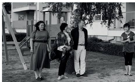
DOMES PĀRSTĀVJI ATKLĀŠANĀS PASĀKUMĀ.

Ilgi lolotais un iecerētais bērnu un skolotāju sapnis realizējies skaistos, modernos, bērniem draudzīgos rotaļu un attīstošos rīkos.