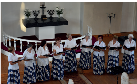
SENIORU ANSAMBLĀ "DZIEDĀTPRIEKŠ" KONCERTS BALDONES EV. LUT. BAZNĪCĀ.