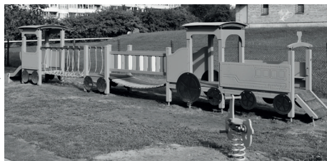
JAUNAIS ROTAĻU LAUKUMS

bērnu fiziskās spējas veicinot un nostiprinot, kā arī radot prieku par bērnības laiku pirmsskolas izglītības iestādē.