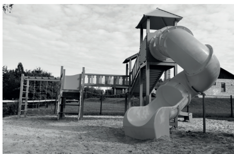
JAUNAIS ROTAĻU LAUKUMS

bērnu fiziskās spējas veicinot un nostiprinot, kā arī radot prieku par bērnības laiku pirmsskolas izglītības iestādē.