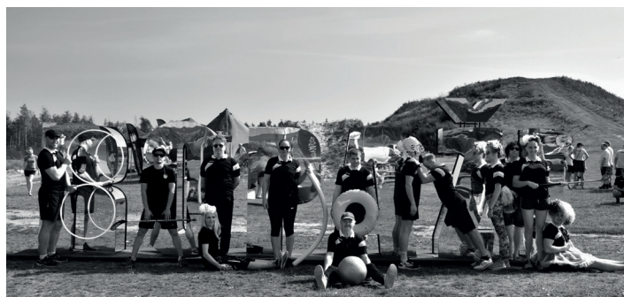
BALDONES NOVADA PAŠVALDĪBAS KOMANDA.