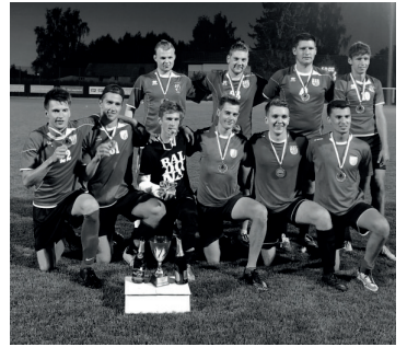
FOTOLA KOMANDA "BALDONE".