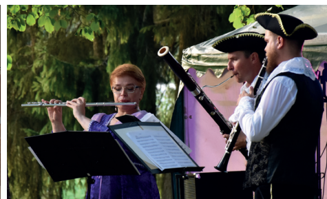
"TRIO CLASSIQUE" AKUSTISKĀS MŪZIKAS KONCERTS MERCENDARBES MUIŽAS PARKĀ.