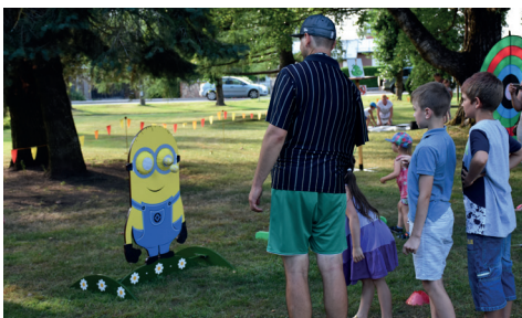
AIZRAUJOŠAS SPĒLES BĒRNIEM KOPĀ AR RADOŠO APVIENĪBU "BRĪNUMU KALĒJI".