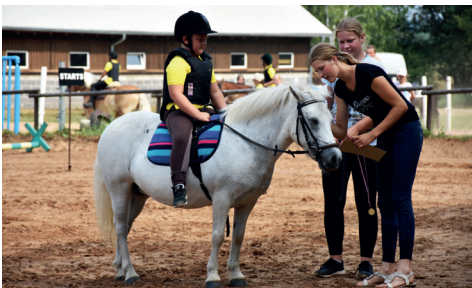
JĀŠANAS SPORTA SACENSĪBAS ZIRGU STALLĪ "TELFAS".