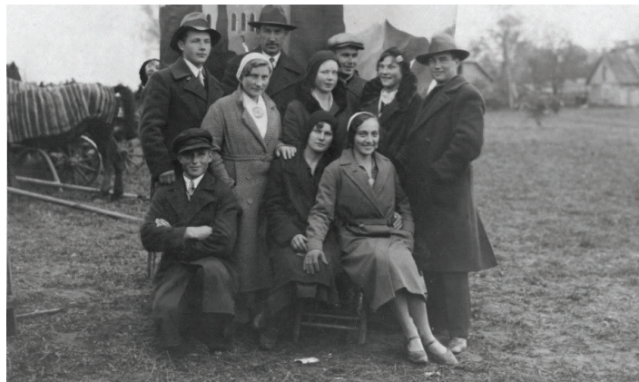
FOTO: 1932.G. 17. OKTOBRĪ BALDONES GADA TIRGUS APMEKLĒTĀJI IZKLAIDĒJAS FOTOGRAFĒJOTIES. (BDNM – 100)

1926.g. 18. oktobrī norisinājās I Baldones Gada tirgus, kurā pulcējās tirgotāji un pircēji arī no kaimiņu Doles, Tomes, Daugmales u.c. pagastiem. Baldonieši minēto fotogrāfiju pirmo reizi ieraudzīja laikrakstā "Mazsaimnieks" 1926. g. 1. novembra 21. numurā, kā titullikvidi rakstam "Tirgi un ražošana" (342. lpp.) Šajā laikā periodā tirgus atradies apmēram vietā, kur tagad slejas Baldones vidusskola, t.i. Rīgas un Iecavas ielas krustpunktā. Fotogrāfijā