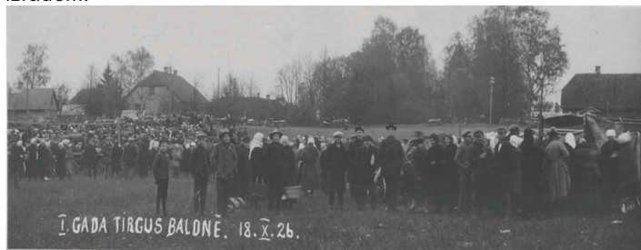
FOTO: BALDONES PIRMAIS GADA TIRGUS, 1926.G.