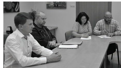
FOTO: NO LĪGUMA PARAKSTĪŠANAS