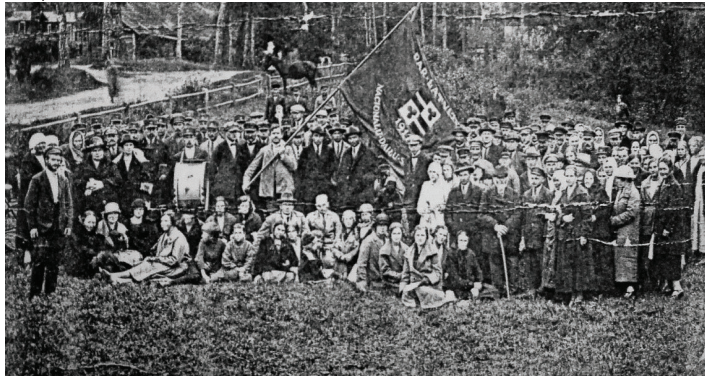
FOTO: KONKURSA "PAR DAIĻĀKO UN LATVISKĀKO SĒTU" SVINĪGAIS PASĀKUMS TIRGUS LAUKUMĀ

Izsenis tirgus ir ne tikai ekonomiski un sociāli nozīmīgs centrs, bet arī simbols, kas ienācis literatūras, teātra u.c. mākslas veidos, akcentējot cilvēku pūli, atšķirīgos sabiedrības slāņus un multikulturālo aspektu. Baldones tirgus no 20. gs. sākuma līdz 20.gs. vidum bija zīmīgs ar apstākli, ka tajā satikās gan vietējie Baldones iedzīvotāji, gan Baldones kūrorta viesi no dažādiem sabiedrības slāņiem.