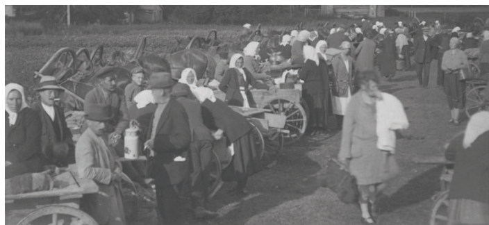
FOTO: TIRGUS VIETA ATRADUSIES AIZ TAGADĒJĀS BALDONES PASTA NODAĻAS ĒKAS (RĪGAS IEĻA, 87). (BDNM – 111)

Baldoniešu vidū izskan versija, ka tirgus laukums ir bijis arī starp Parka ielu un Ķeguma prospektu. Ja Jums ir ziņas par tirgu un tā atrašanās vietām 20. gs. pirmajā pusē, lūdzu informēt Baldones muzeju!