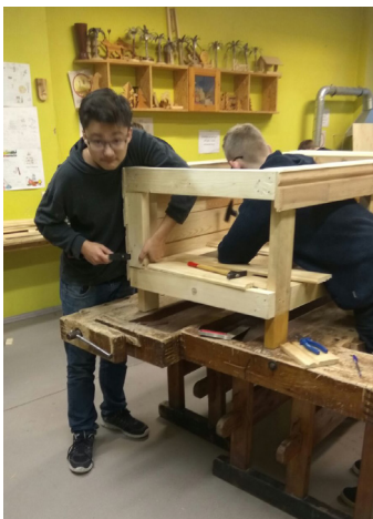
FOTO: TEHNISKĀS JAUNRADES PULCIŅA NODARBĪBA