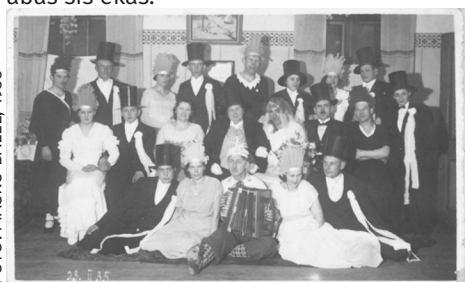
FOTO: MASKU BALLE, 1995

Pašvaldības izveidotā darba grupa ir apzinājusi esošo situāciju un izvērtējusi iespējas sakārtot pašvaldības īpašumus, kā arī novērtējusi Baldones sabiedrības vajadzības pēc kultūras iestādēm. Secinājums – Baldones sabiedrībai ir vitāli nepieciešamas telpas sabiedriskajai un kultūras dzīvei, un šodienas jautājums nav izvēlēties vienu vai otru, bet gan – kā rīkoties, lai saglabātu un modernizētu abas šīs ēkas.