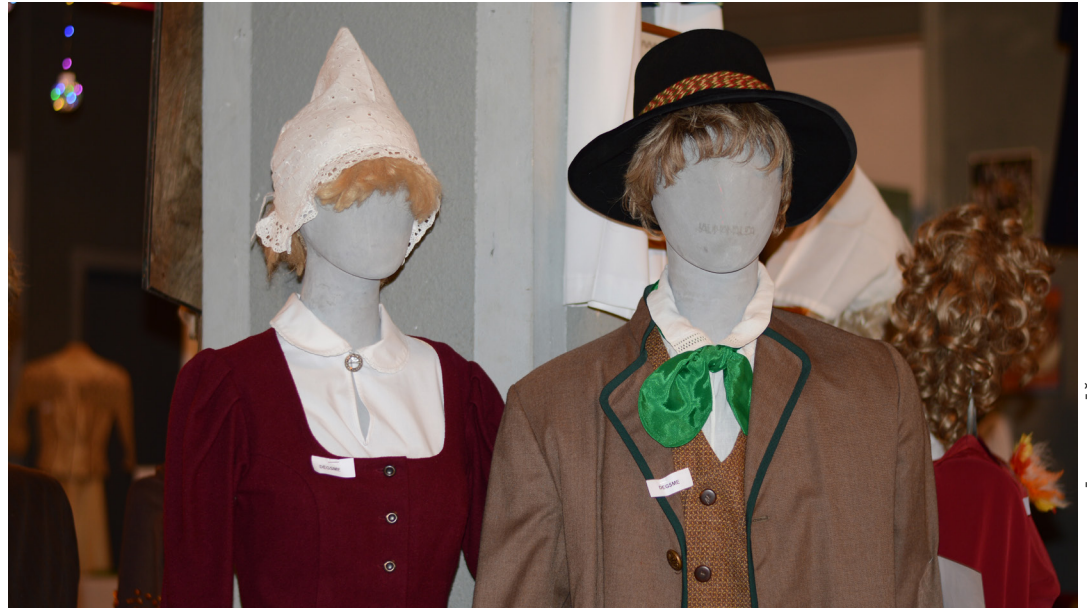
FOTO: NO IZSTĀDES ATKLĀŠANAS