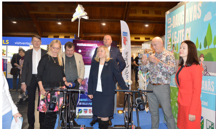
FOTO: IZSTĀDES ATKLĀŠANA

Visu trīs dienu garumā Daugavas lejteces uzņēmēji iepazīstināja ar saviem uzņēmumiem un prezentēja to produktus, savukārt uz lielās "Balttour" skatuves pašdarbnieku kolektīvi priecēja ar saviem priekšnesumiem izstādes apmeklētājus.