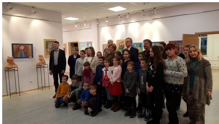
FOTO: IZSTĀDES ATKLĀŠANA