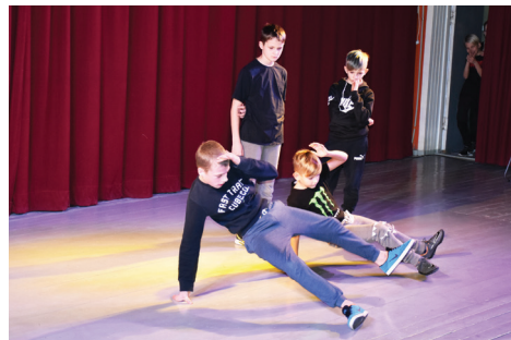
PUIŠI NO "SOUL CITY BREAKERS".