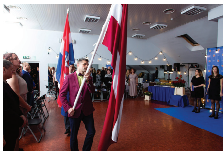
KAROGU IENES NIKS ZVAIGZNE.