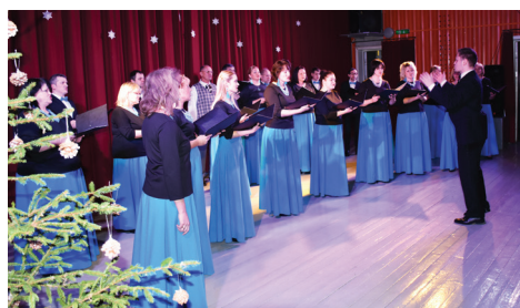
KORIS "TEMPUS". FOTO: ELĪNA OSE