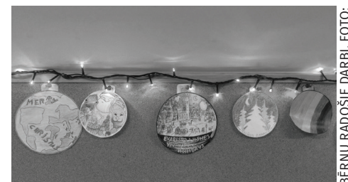
BĒRŅU RADOŠIE DARBI. FOTO: BĒRŅU CENTRA ARHĪVS

Iluta Aizupiete Bērnu centra "Baltais ērglis" vadītāja