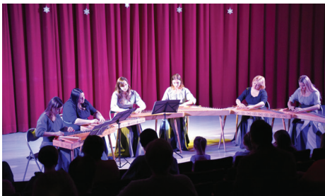
KOKĻU STUDIJA "DŽITARI". FOTO: ELĪNA OSE