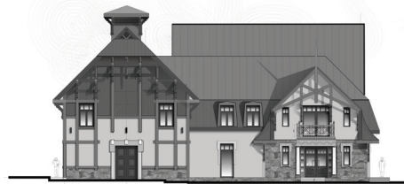
Fasāde no Iecavas ielas