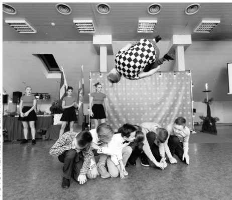
DEJU APVIENĪBA "STREET WARRIORS".