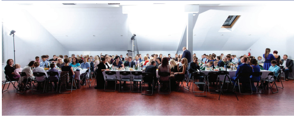
SPORTA LAUREĀTI.

18. decembrī Baldones Sporta kompleksā jau piekto gadu pēc kārtas norisinājās svīnīgais novada labāko sportistu godināšanas pasākums "Baldones novada Sporta laureāts 2018".