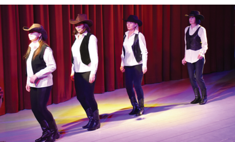
LĪNIJDEJU GRUPA "SIDE BY SIDE". FOTO: ELĪNA OSE