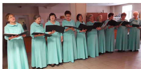
SENIORU ANSAMBLIS "DZIEDĀTPRIEKS".

Šim vakaram – spožākās zvaigznes, Šim vakaram – baltākais sniegs. Bet gaišāks par svecītēm eglē Lai sirdī nāk cerību prieks!