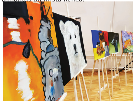
MĀKSLAS SKOLAS AUDZĒKŅU IZSTĀDE.