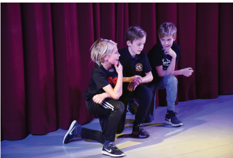
PUIŠI NO "SOUL CITY BREAKERS".