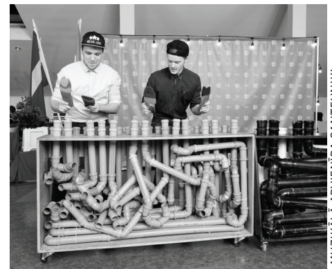
MUZIKĀLĀ APVIENĪBA SANTEHNIĶI.

atstājuši daudzus iedzīvotāju skaita ziņā lielākus novadus. Paldies visiem novada iedzīvotājiem, kuri piekrita pārstāvēt novadu šajā sacensību ciklā!