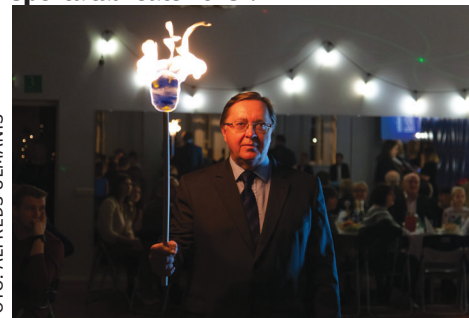
LĀPU IENES ZIGURDS LANKA. FOTO: ALFRĒDS ULMANIS

Pēc svīnīgās lāpas iedegšanas, kas šogad tika uzticēta šaha lielmeistaram Zigurdam Lankam, karoga ienešanas un Latvijas valsts himnas kopīgas dziedāšanas, pasākumu atklāja Baldones novada domes