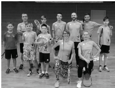
BALDONES KROSMINTONISTI AIZKRAUKLĒ

Šādi varētu raksturot SK Sporta Punkts krosmintonistu sniegumu 1. decembrī Aizkraukles Sporta centrā noritējušā Latvijas čempionātā 2018.