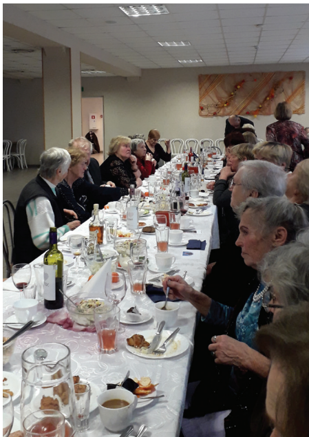
LATVIJAS SIMTGADES SENIORU BALLE.

Lai nākošā gadā no Baldones vairāk kā 1000 pensionāriem sanāk vēl kuplāks kopā nācēju skaits, lai rodas daudz labas idejas un vēlme rosīties!