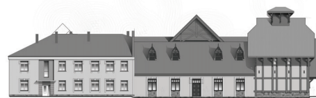
Fasāde no pagalma