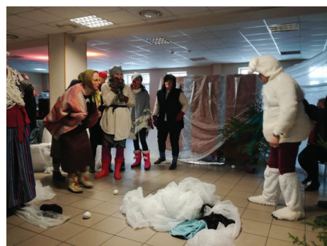
DOMES DARBINIEKI SPĒLĒ IZRĀDI "SŪNU CIEMA ZĒNI".