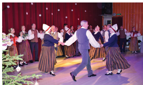
VDPK "DEGSME" UN SDK "DEGLĪ".