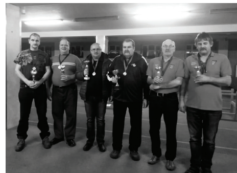
NOVUSS DUBULTSPĒLĒS BALDONES SPORTA KOMPLEKSĀ.

Šī gada 15. decembrī Baldones sporta kompleksā norisinājās novuss dubultspēlēs.