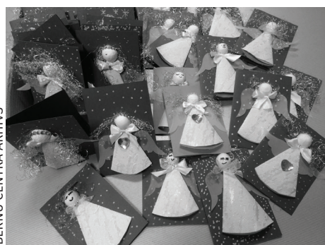
"ENĢĒĻU DARBŅĪCA" KARTIŅAS.

Godinot Latviju dzimšanas dienā, Bērnu centra apmeklētājiem, sadaloties koman-dās, bija iespēja piedalīties spēlē "Es mīlu Tevi, Latvija", kas līdzinājās TV ekrānos redzamajai spēlei un bērniem sagādāja lielu prieku.