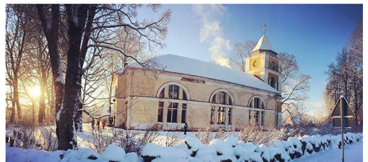
Gaišus un priecīgus Ziemassvētkus un laimīgu Jauno 2019. gadu!