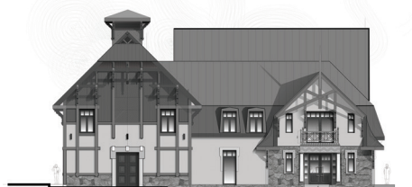
Fasāde no Iecavas ielas

Turpinās projektēšanas darbi Baldones novada pašvaldības ēkas Iecavas ielā, Baldonē (vecā Kultūras nama ēka) pārbūves Mūzikas skolas vajadzībām būvprojekta