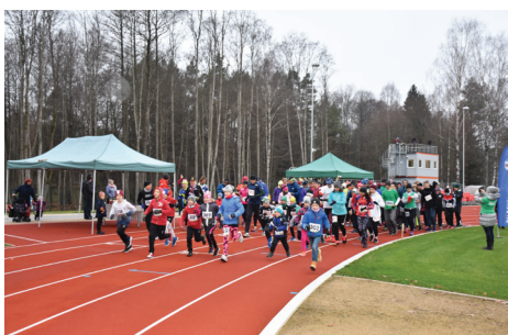
100 APĻU SKRĒJIENS. FOTO: ELĪNA OSE

17. novembrī plkst. 10.00 Baldones vidusskolas stadionā tika dots starts 100 aplu skrējienam, un jau pēc aptuveni 40 minūtēm 100 aplus bija noskrējusi pirmā komanda "5 vīri un 1 dāma".