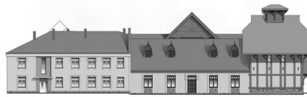
Fasāde no pagalma