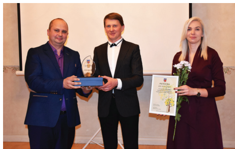
GADA UZŅĒMĒJA BALVU SAŅĒM SIA AGROZONA.

23. novembrī Mercenderbes muižā norisinājās ikgadējais Baldones novada Uzņēmēju forums 2018.