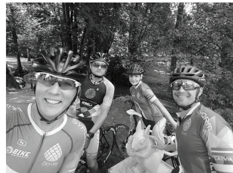
BILDES PĒC KOPTREIŅA PIE BALDONES VĀVERĪTES.