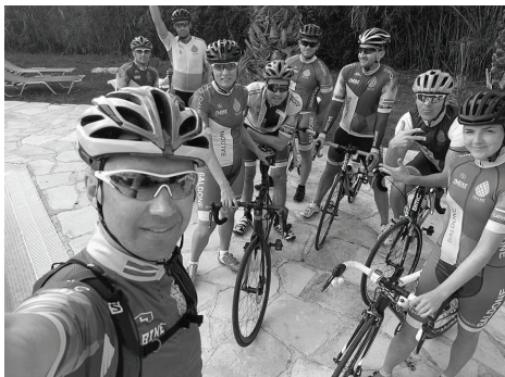
BALDONES VELOKOMANDA PAVASARA TREIŅU NOMETNĒ KIPRĀ.

Jau ceturto gadu Baldonē darbojas MTB kalnu velosipēdu velokomanda, kuras dalībnieki piedalās Latvijas populārākajos MTB seriālos un Latvijas čempionātos MTB riteņbraukšanā.