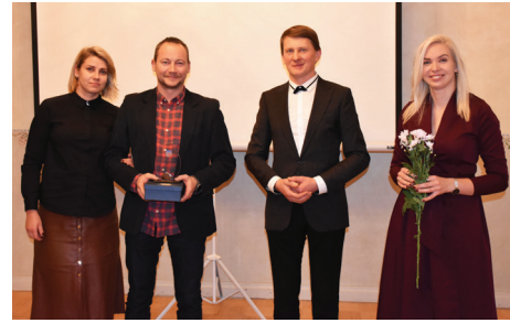
GADA UZŅĒMĒJA BALVU SAŅĒM SIA KOMPROMISS.

izbūvi, savukārt SIA Kompromiss saņēma uzņēmēja gada balvu par izaugsmi un radītām darba vietām.