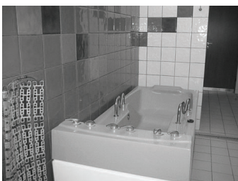
DRUSKININKU SANATORIJA.

Pilsētas attīstībā tika aktīvi iesaistīti arī uzņēmēji. Pilsēta atbalstīja un atbalsta tos, kuri vēlas uzsākt savu biznesu Druskininkos. Gadījumos, ja uzņēmējs cieta neveiksmi, pašvaldība arī atpirka šo biznesu, vai iesaistījās ar kapitāldaļām. Maļinauskas kungs stāstīja, ka krīzes gados bija izdomājis veidu, kā no vienas puses atbalstīt vietējos uzņēmējus, no otras puses turpināt pilsētas infrastruktūras attīstību – iepirka un slēdza līgumus ar tiem uzņēmējiem, kuri piedāvāja veikt pilsētas infrastruktūras izbūves darbus ar atlikto maksājumu uz 10 vai 15 gadiem. Tādējādi pilsēta izbūvēja un sakārtoja savas ielas par ievērojami lētāku cenu, nekā treknajos gados, nebija jāprasa kredīta, un vienlaikus uzņēmējs varēja "noturēties uz ūdens", jo bija darbs, pasūtījums, bija garantija ilgstošiem un regulāriem ienākumiem. Par dažām toreiz izbūvētajām ielām un trotuāriem pilsēta maksā vēl šodien, taču pati pilsēta ir sakopta un uzturēta jau visus šos gadus pēc krīzes.