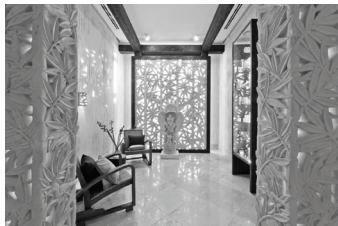
DRUSKININKU SANATORIJA.

saistīti infrastruktūras izveidei, lai noturētu pilsētas – veselīga dzīvesveida veicinātājas – imidžu, ko veido sanatorijas, SPA, ūdens atrakciju parks, slēpošanas trase zem jumta, pacelājs no SPA uz sniega parku u.c. Protams, notiek sacensība ar Palangu, kurš kūrorts ir lielāks. Skaitļi liecina, ka Druskininki šajā sacensībā ir priekšā. Pašvaldības vadītājs ļoti lepojas ar savu pilsētu, ar cilvēkiem un priecājas, ka, staigājot pa naža asmeni, sasniegts tik labs rezultāts.