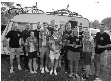
BALDONES VELOKOMANDA VIVUS MARATONA NOSLĒGUMA POSMĀ APĒ.

Baldones velokomandas augstākie sasniegumi 2018. gada sezonā ir - 1. vieta Pierīgas MTB sacensībās deviņu komandu konkurencē, 5. vieta Latvijas Riteņbraukšanas federācijas amatieru rangā komandu ieskaitē 12 komandu konkurencē, 10. vieta VIVUS MTB seriālā komandu ieskaitē 78 komandu konkurencē, kā arī 8. vieta SEB MTB seriālā komandu ieskaitē 23 komandu konkurencē.