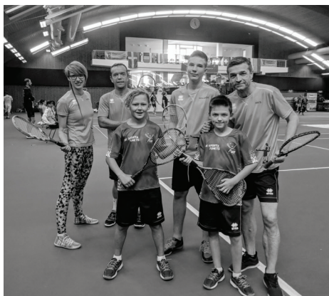
BALDONES KROSMINTONISTI ČEHIJĀ.

29. septembrī Čehijā, Brno pilsētā norisinājās Eiropas Jaunatnes čempionāts krosmintonā, kur savā starpā spēkiem mērojās dalībnieki no piecpadsmit valstīm.