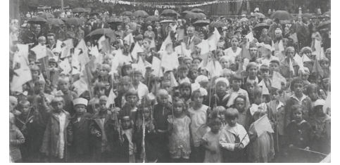
BĒRNU SVĒTKI BALDONES KŪRORTA PARKĀ 1930. GADU SĀKUMĀ.

dē, tāpēc svētkos viņam bija pienākums un cieņa piedalīties pagasta rīkotajos svētku pasākumos.