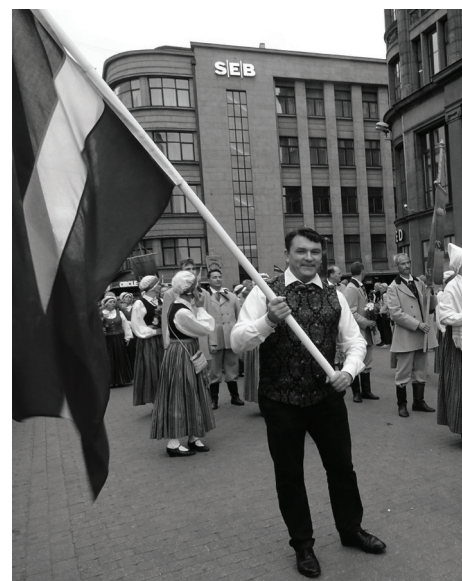
E. VALANTIS DZIESMU SVĒTKU GĀJIENA