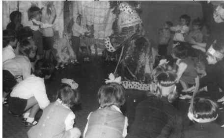
1984. G. ZIEMASSVĒTKU SVINĪBAS