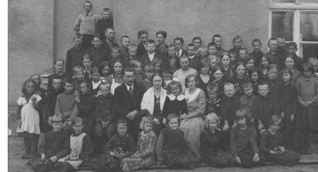
PULKARNES SKOLAS SKOLNIEKI 1931. - 1932. G.