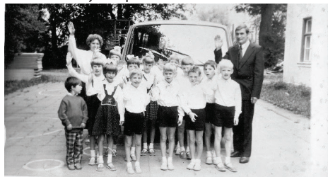
1986. / 1987.G. MĀCĪBU GADS BALDONES BĒRNU NAMĀ. FOTO PIE MERCENDARBES MUIŽAS.

Stāsts ievēro latviešu tautas vēstures pagriezienos, sākot ar astoņgadīga bērna skatījumu, kurš ar savu ģimeni 1941. gadā tiek izsūtīts uz Sibīriju "ar bērna acīm, vīra prātu", līdz pieauguša cilvēka secinājumiem par valdošās iekārtas aizkulisēm līdz 1970. gadu vidum – "pakļautība svešai varai nozīmē maksāt meslus. Tādā vai citādā veidā, bet maksāt...". Daiļliteratūras vieglums savijās ar skarbām un reālistiskām ainām. Lasāms mājaslapā eraksti.lv .