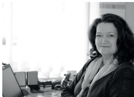
N. SNIEDZE.

Baldones novada domes administrācija informē lasītājus īsajās ziņās par aktuālajiem darbiem pašvaldībā oktobrī, lielākajiem objektiem un svarīgākajiem plāniem tuvākajā nākotnē.