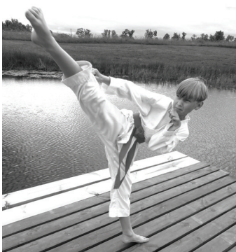
R. ARABELS GATAVOJAS LATVIJAS KARATĒ ČEMPIONĀTAM.

Šoruden bērnu klubs "KARATE SEN-E", kura pamatdarbība tiek virzīta uz olimpisko karatē attīstīšanu Baldones novadā, svin 9 gadu jubileju. Pagājušās sezonas laikā (2017./2018. gadā) bērnu kluba "KARATE SEN-E" baldonieši sasniegta ievērojamus rezultātus, izcīnot vairāk nekā 40 medaļu gan Latvijas, gan starptautiska mēroga sacensībās.