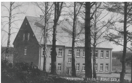
PULKARNES PAMATSKOLA 1930. GADOS

bijis lielais sapnis. Kaucmindes skola bija populārākā un prestižākā Mājturības skola, kas darbojās no 1923. gada kādreizējā grāfa Pālena īpašumā - Kaucmindes muižā. Sācies karš un sapnis tā arī izplēnējās. 1942. gadā Ausma Biruta tika iesvētīta Baldones baznīcās draudzē.