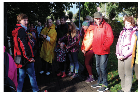
EKSPEDĪCIJA NR. 2 - PĀRGĀJIENS.

Otrā pasākuma laikā plkst. 21.00, noslēdzot aktīvo tūrisma sezonu un atklājot Eiropas jaunatnes informācijas tīkla EURODESK rīkoto kampaņu TIME TO MOVE, norisinājās naksnīgais velobrauciens pa Baldones ielām - "NightRide Baldone". Piedaloties aptuveni 25 dalībniekiem, vienas stundas laikā tika nobraukti 13 kilometri, iepazīstot pilsētu naktī. NightRide kustība eksistē visā pasaulē. Brauciena būtība ir dalībnieku brīvi izvēlēta maršrutā nakts laikā doties velobraucienā pilsētvīdē. Naksnīgais velobrauciens Baldonē norisinājās jau otro reizi un šoreiz pulcēja dažāda vecuma dalībniekus. Brauciena laikā tika apmeklēti jaunais Baldones vidusskolas stadions, Baltā pils, Ceriņu parks un Vanagkalna estrāde.