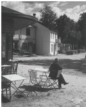
Baldone. Ainava pie autobusu pietātnes.

Izstādē aplūkojamas Rīgas ielas fotogrāfijas pirms 100 gadiem un mūsdienās. Katrs interesents varēs salīdzināt, kā izskatījās Baldones centrs Latvijas pirmās brīvvalsts laikā un kā to redzam šodien.