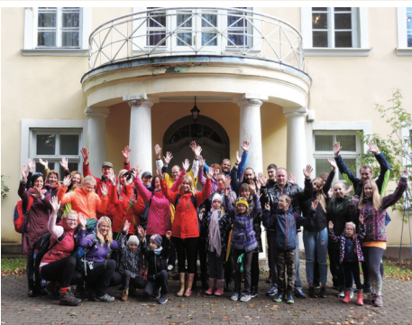
EKSPEDĪCIJA NR. 2 - PĀRGĀJIENS.