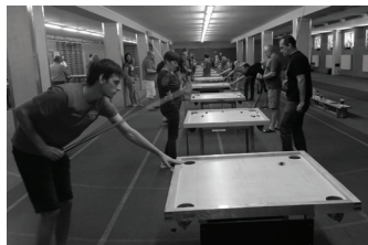
FOTO: NOVUSA KAUSA IZCĪŅA

14. oktobrī Baldones Sporta kompleksā norisinājās Baldones kausa izcīņa novusā, kurā piedalījās 30 dalībnieki no dažādām pilsētām – Bauskas, Rīgas, Daugavpils, Ķekavas, Daugmales un, protams, Baldones.