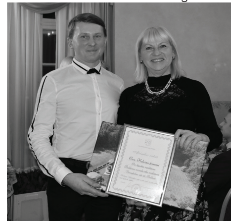
PRIEKŠSĒDĒTĀJS SVEIC APBALVOJUMA "SKATĪTĀJU SIMPĀTIJA" IEGUVĒJU - KALNIŅU ĢIMENES PĀRSTĀVI.

Konkursa noslēguma pasākumā neizpalika arī šī gada jaunuma – skatītāju simpātijas – apbalvošana, kas tika noskaidrota vairāk kā mēnesi ilgajā balsošanā novada oficiālajā Facebook lapā. Pateicoties lietotāju aktivitātei, skatītāju simpātijai ieguva Kalniņu ģimenes īpašums. Apbalvošanas laikā īpašuma saimniece ar smaidu teica, ka balsojums viņai ir bijusi liela avantūra un sportiskais azarts nezuda ne mirkli, pat balsošanas pēdējā vakarā viņai esot bijusi "sava rezerve", lai sīvā cīņā uzvarētu savu tuvāko sāncensi – Rozenštrauhu ģimeni.