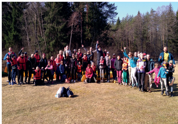
FOTO: NO LAIVU BRAUCIENA MISA I