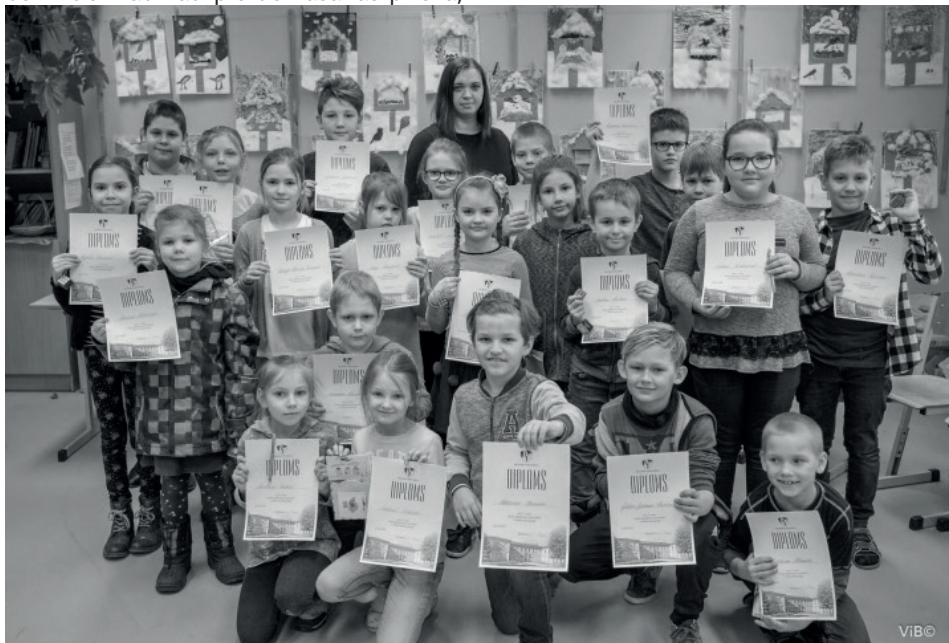
FOTO: BALDONES VIDUSSKOLAS JAUNIE DAMBRETISTI