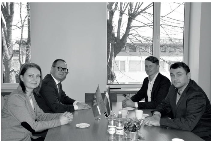
FOTO: VIZĪTĒ SALASPILS NOVADA DOMĒ