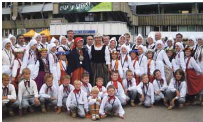
Deju kolektīvi Daina un Sidrabaine Dziesmusvētkos.