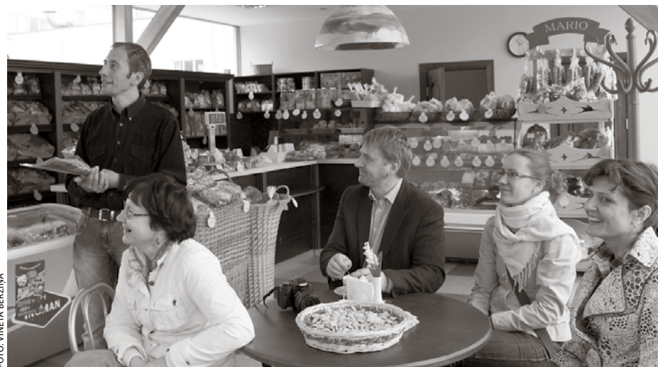
Interesenti iepazīstas ar konditorejas izstrādājumu ražošanu.

garšot medus produktus, kā arī klātienē vērot, cik veikli ap bišu stropu darbojas bitenieki.