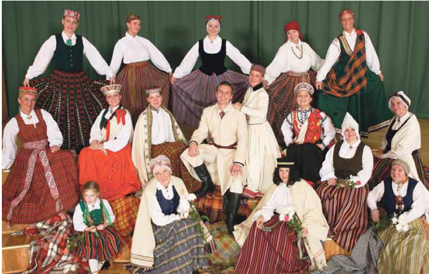
Ķekavas kultūras nama draudzīgā saime.

Turpinot Ķekavas novada pašvaldības Kultūras aģentūras ieceri novadniekus iepazīstināt ar kultūras dzīves norisēm, stāstīsim par vienu no lielākajiem Ķekavas kultūras dzīves veidotājiem - Ķekavas kultūras namu. Jūlijs ir tā jubilejas mēnesis.