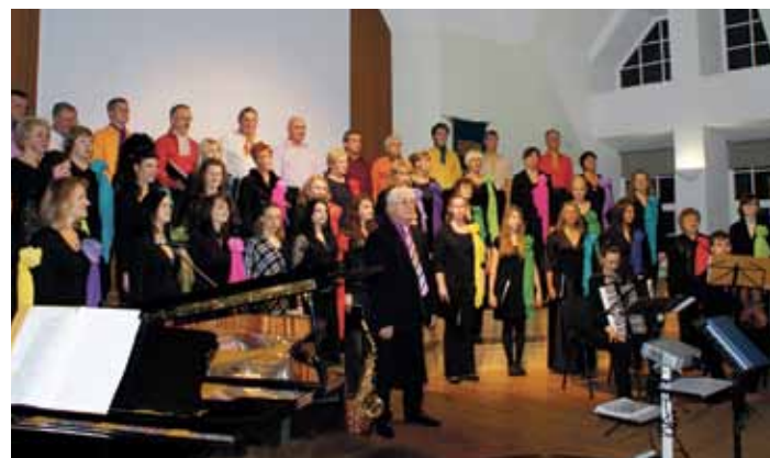
Jauktais koris Mozaika svin savu 30 gadu jubileju.