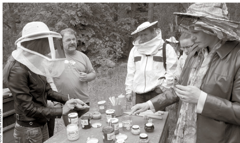
Novada viesi nogaršo dažādu medu paraugus.

Savukārt Daugmales Bišu Jāņa dravā ikviens varēja iztaujāt visu par bitēm, no-