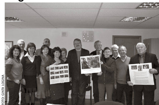
Ķekavas novada Dome dāvanā no Vācijas kolēģiem saņēma projekta Cilvēks darbībā kalendāru.