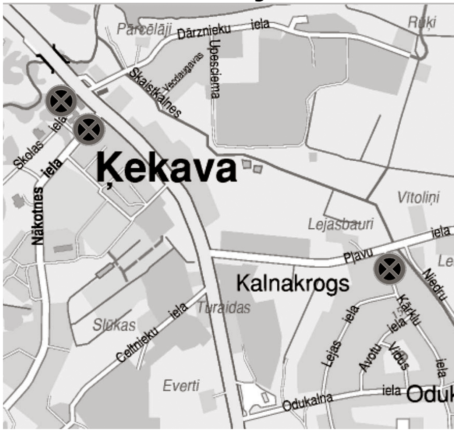
Auto apstāšanās ierobežojumi Ķekavā un Odukalnā