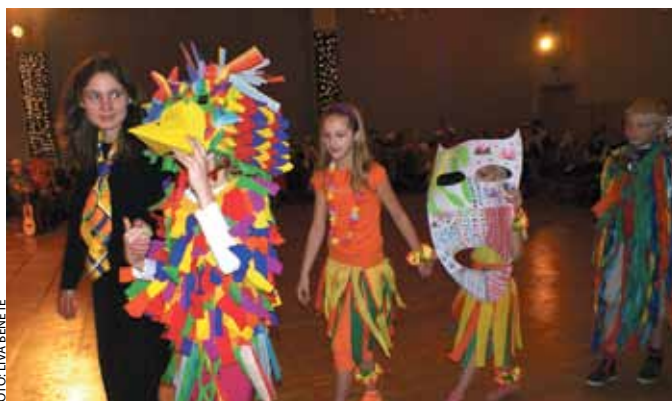
Ķekavas Mākslas skolas karnevāls jau kļuvis par jautru ikgadēju tradīciju.

Ķekavas kultūras namā 2011. gada 28. janvārī plkst. 19.00 laipni aicinām Ķekavas novada lauksaimniekus uz Ziemas Balli