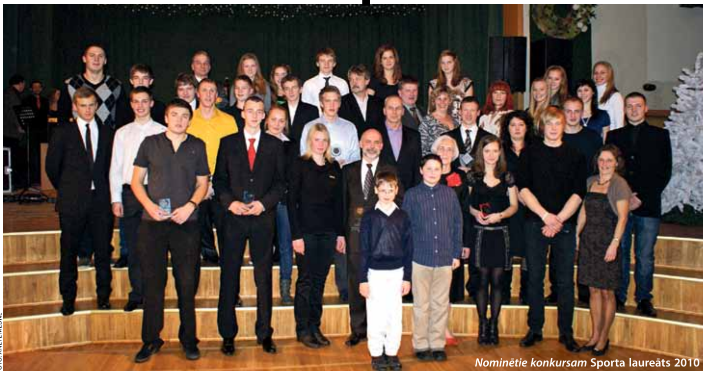
Nominētie konkursam Sporta laureāts 2010

7. janvārī Ķekavas kultūras namā notika Ķekavas novada sporta laureāts 2010 , kurā tika apbalvoti Ķekavas novada labākie sportisti, treneri un komandas.