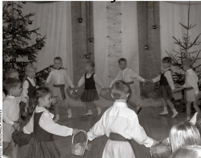
Labdarības koncerts varētu kļūt par bērnudārza tradīciju.