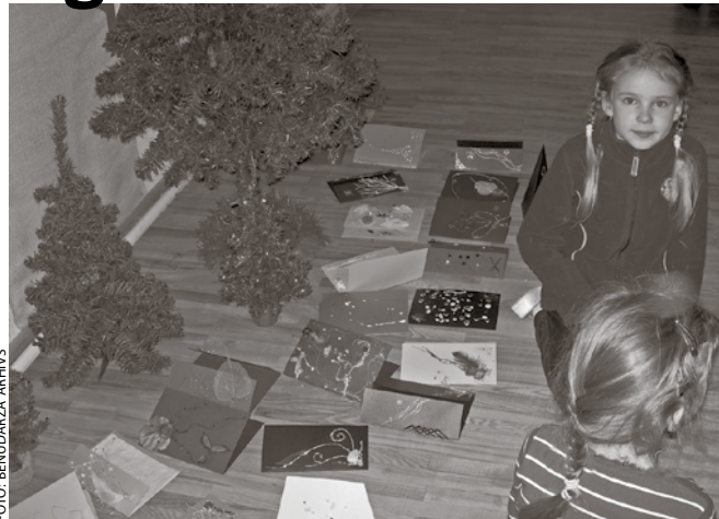
Konsultatīvā kabineta darbības ietvaros notika arī radošā Ziemassvētku apsveikumu gatavošanas darbnīca saviem mīļajiem un tuvajiem cilvēkiem.

Savukārt nākamajā pusgadā plānotam organizēt gan psihologa konsultācijas vecākiem un pedagogiem, konsultācijas jaunajām māmiņām par bērnu sagatavošanu pirmsskolai un dažādus pasākumus – logopēda un citu