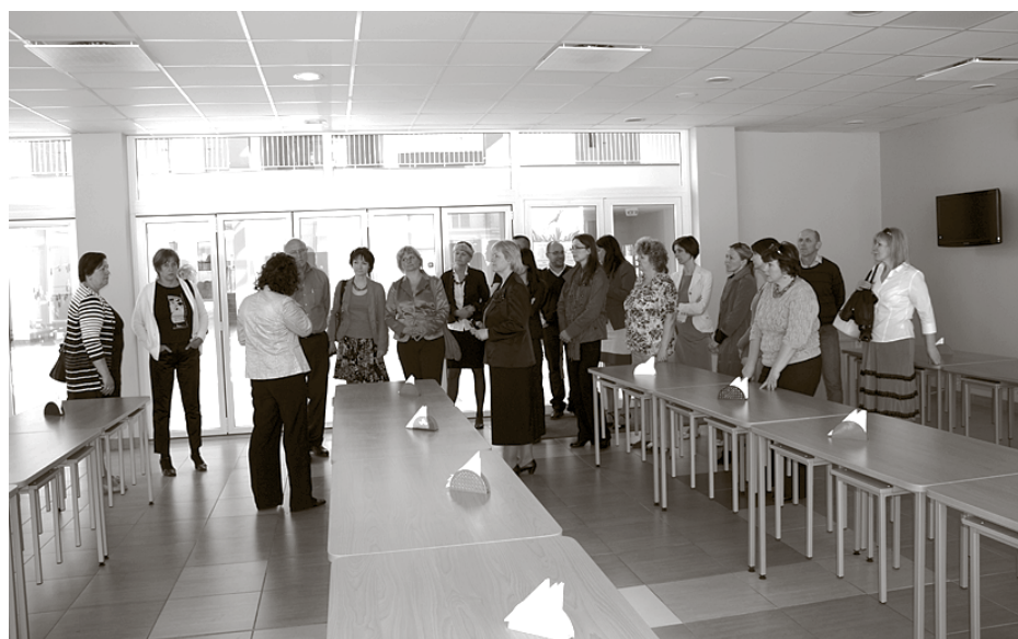
Baložu vidusskolas jaunajā ēdnīcā

klātienē apskatītu jaunākos realizētos projektus, piemēram, Baložu vidusskolas piebūvi, Daugmales multifunkcionālo centru, Baložu veloceļu, bērnu dārzu Avotiņš , kā