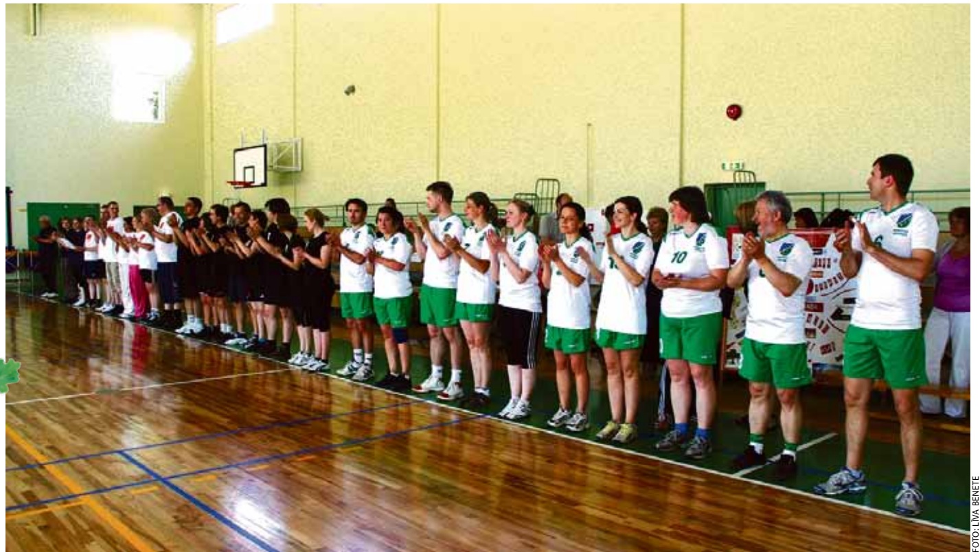
Ķekavas novada pedagogu un pašvaldības darbinieku draudzības spēle basketbolā