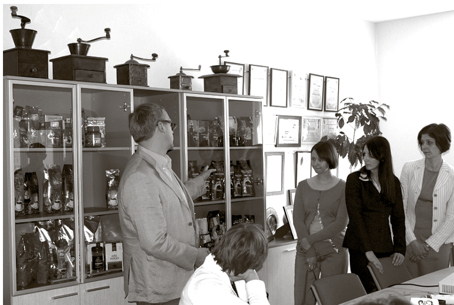
Ciemojoties kafijas ražotnē Melnā Kafija

Maijā Ķekavas novadā notika pieredzes apmaiņas pasākums starp Mārupes un Ķekavas novadu pašvaldībām, lai uzklautu pieredzi dažādu pašvaldības jomu pilnveidošanā, uzzinātu aktualitātes novados un izvirzītu idejas iespējamo kopīgo projektu realizācijai.