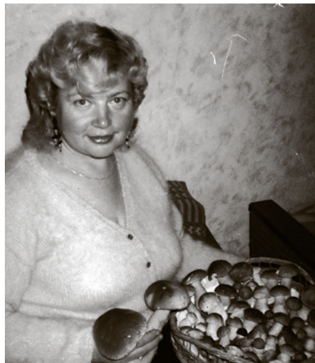
70 baravikas – salasītas Baložu mežā