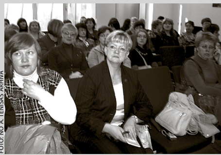
Latvijas, tostarp Ķekavas, pedagogi Eiropas Parlamentā