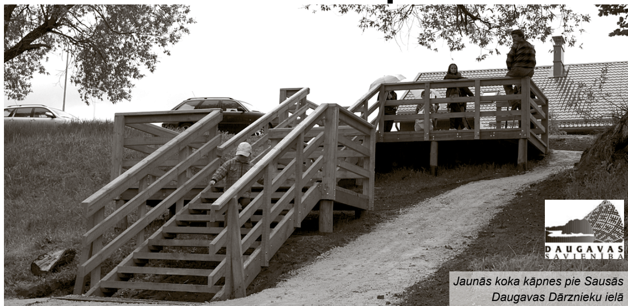
Jaunās koka kāpnes pie Sausās Daugavas Dārziņu ielā