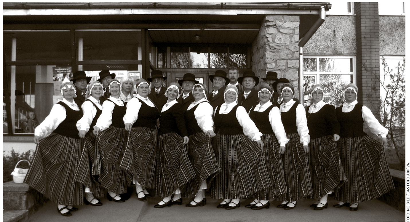
Senioru deju kolektīvs jaunajos Ķekavas novada tautastērpos

Ķekavas novada svētkos, 9. jūnijā, skatītājus priecēs senioru deju kolektīvs Sidraine ne tikai ar deju soļiem, bet arī ar jaunajiem Ķekavas novada tautastērpiem, kas nesen šūdināti biedrības Sidraine projekta Tautas mākslai Ķekavā būt! ietvaros.