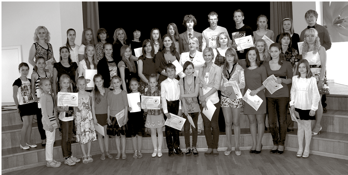
Skolēni un viņu pedagogi, kuri izcīnījuši augstus sasniegumus valsts un starptautiskajos konkursos un mācību olimpiādēs

Ceriņu un kastaņu ziedēšanas laikā, 24. maijā, Ķekavas novada pašvaldība pulcēja labākos novada audzēkņus un viņu pedagogus, lai sveiktu viņus ar sasniegumiem mācību priekšmetu olimpiādēs, sportā, valsts un starptautiskajos konkursos.