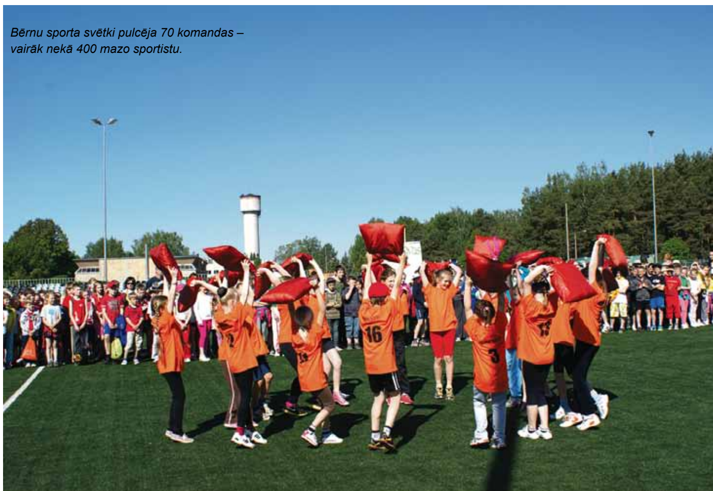
Bērnu sporta svētki pulcēja 70 komandas – vairāk nekā 400 mazo sportistu.

Paaudžu solidaritātes gada ietvaros 25. maijā Ķekavas novadā noritēja aizraujošas sporta sacensības – pirmsskolas un sākumskolas bērnu sporta spēles Ķekavā, kā arī izglītības iestāžu pedagogu un pašvaldības darbinieku draudzības spēle basketbolā Baložos.