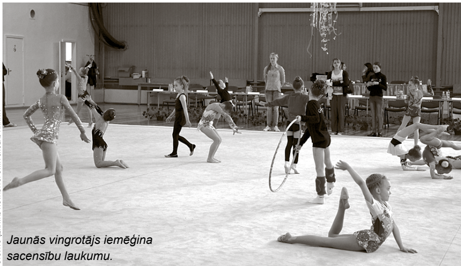
Jaunās vingrotājas iemēģina sacensību laukumu.

Mākslas vingrošanas sacensības nevarētu pastāvēt tik ilgu laiku bez mūsu ilgdarbiem atbalstītājiem – Ķekavas novada pašvaldības, Ķekavas novada sporta aģentūras, uzņēmumiem Maxima , Dainese , Melnā Kafija , Interbaltija AG , Ķekavasputnu