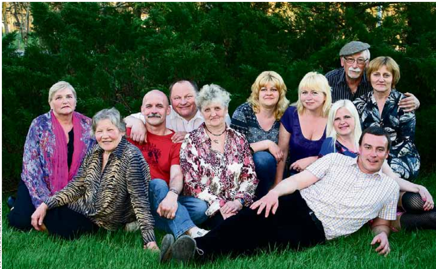
Daugmales teātra draugu kopa pēc Sievasmātes labās gribas pirmizrādes 2012. gada 1. maijā

Viss sācies ar bariņu uzņēmīgu sievu un Annas Brigaderes Čaukstenēm . Izdevies. Paticis gan ļaudīm, gan pagasta vadībai.