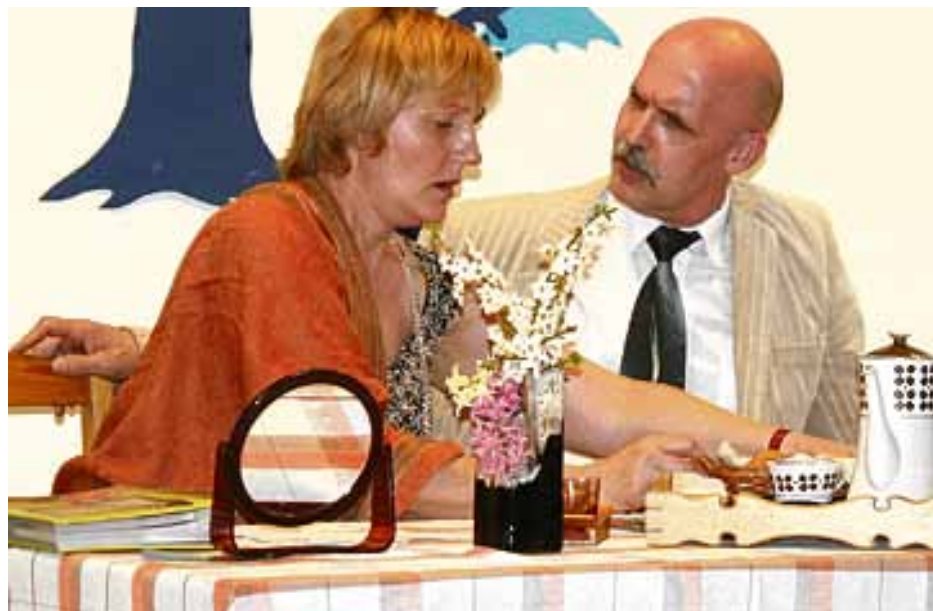
Skats no izrādes Sievasmātes labā griba