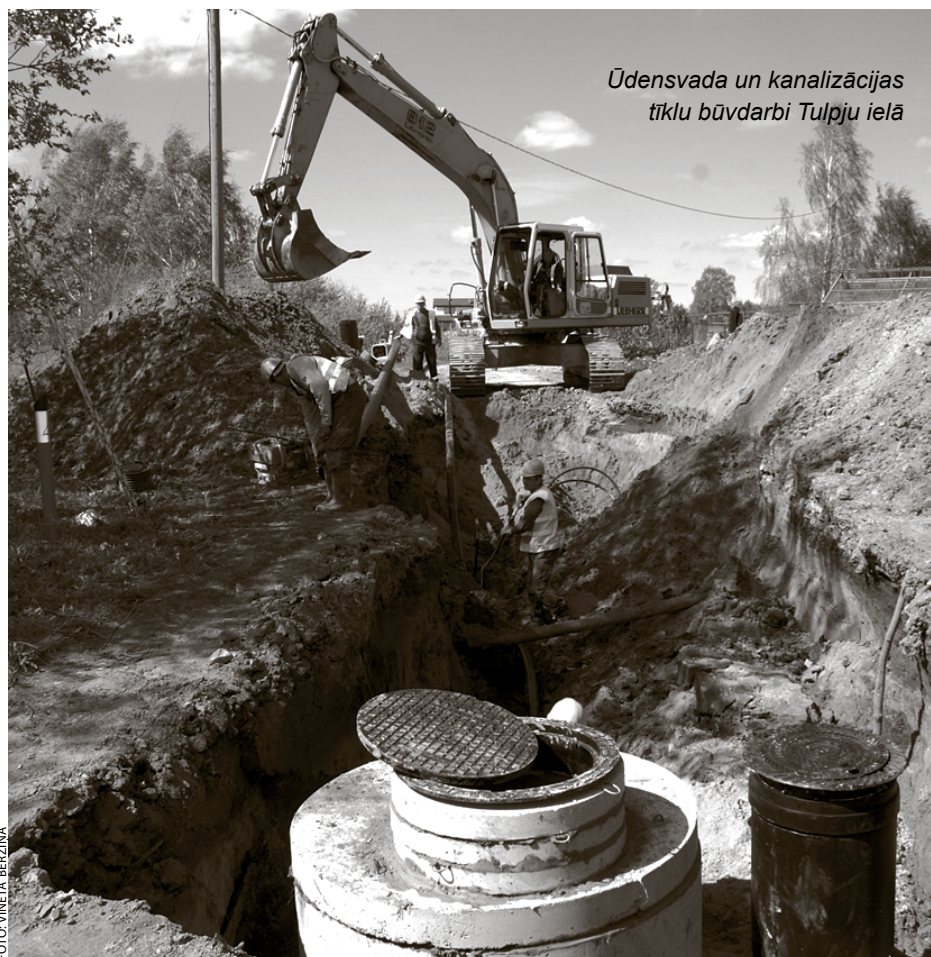
Ūdensvada un kanalizācijas tīklu būvdarbi Tulpju ielā