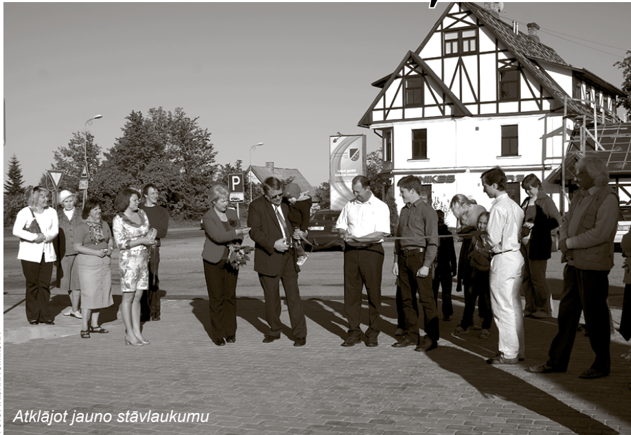
Atklājot jauno stāvlaukumu