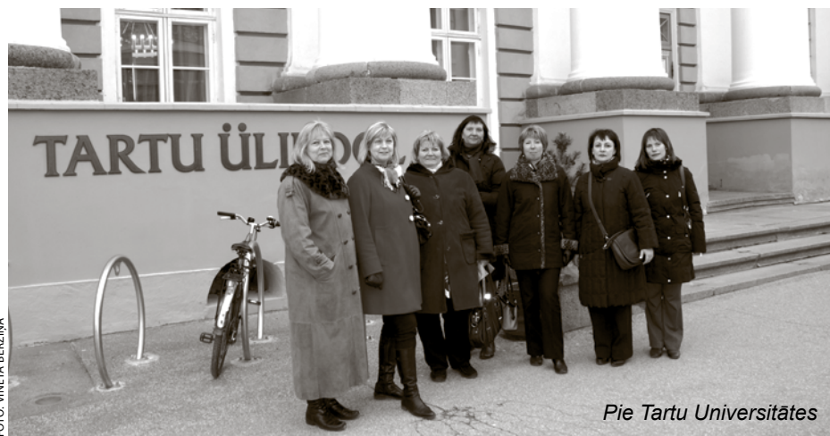
Pie Tartu Universitātes

23. martā Ķekavas, Olaines, Salaspils un Siguldas novada izglītības speciālisti apmeklēja Tartu zinātnes centru, lai iepazītos ar tā oriģinālo piedāvājumu un rastu ierosinājumu, kā ieinteresēt jauniešus apgūt tādus eksaktos mācību priekšmetus kā fizika, ķīmija.