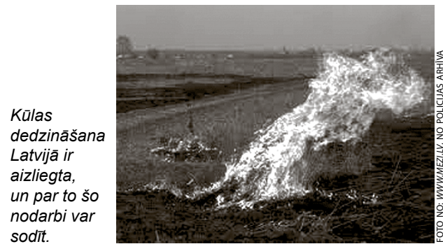
Kūlas dedzināšana Latvijā ir aizliegta, un par to šo nodarbi var sodīt.