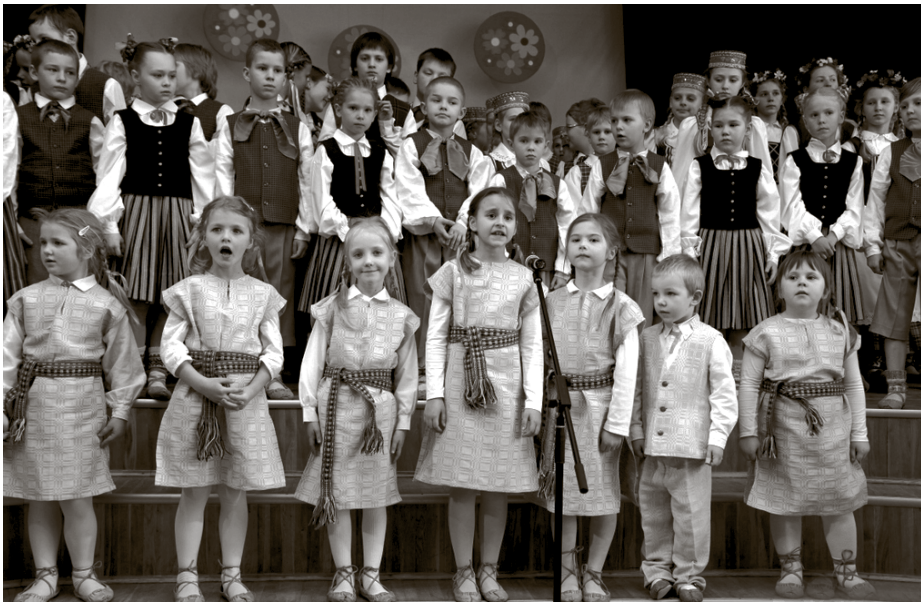
No pasākuma Lieldienu šūpolēs Ķekavā

Kultūras aģentūras informāciju apkopoja Vineta Bērziņa