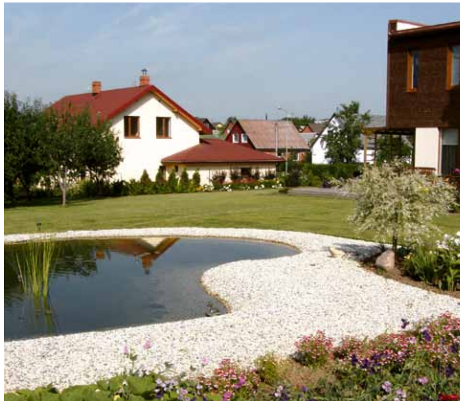
1. vieta konkursā Sakoptākā sēta Ķekavā 2008. gadā

Ar devīzi Dari un radi zaļākam novadam Ķekavas novada pašvaldība izsludinājusi konkursu Ķekavas novada sakoptākā sēta 2012, tā atjaunojot vienu no Ķekavas pagasta skaistajām un vērtīgajām tradīcijām.