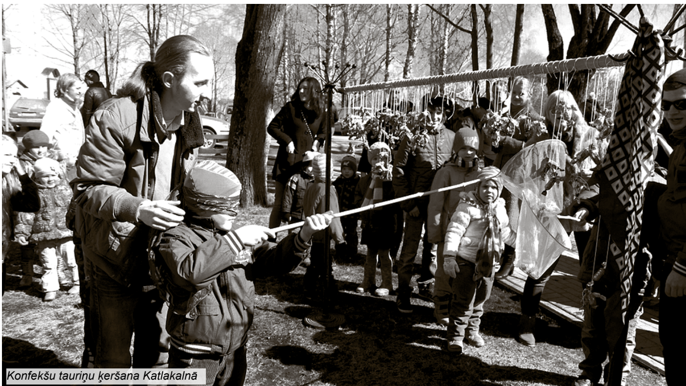
Konfekšu tauriņu ķeršana Katlakalnā

Lai sagaidītu pavasara svētkus – Lieldienas, Ķekavas novadā iedzīvotājiem tika sarūpētas dažādas iespējas šo priecīgo notikumu nosvinēšanai.