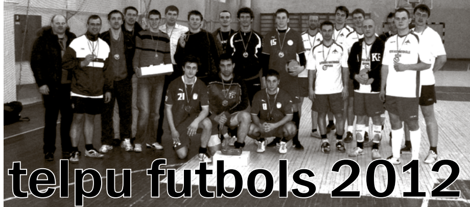
Daugmales atklātā telpu futbola medaļnieki

Cīņā par trešo vietu, dominējot visā spēlē, ar 3:0 Baltic Taxi uzvarēja FK Putni . Kā jau bija gaidāms, fināla spēle bija ļoti spraiga un mazrezultatīva, kur nedaudz veiksmīgāki un meistarīgāki bija FK Ķekava , kas tikai ar niecīgu pārsvaru – 1:0 – uzvarēja LNO .