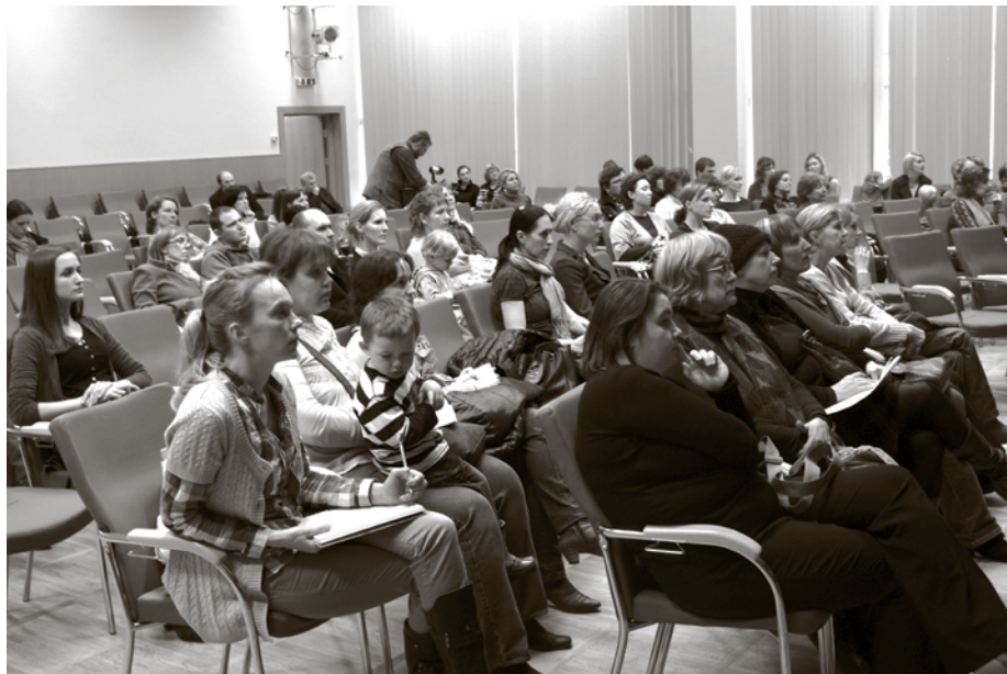
Ķekavas kultūras namā tikšanās par aukļu dienestu

Tikšanās laikā vecāki interesējās par aukles kontroli, speciālisti šeit uzsvē, ka TĀ IR AUKLES UN ĢIMENES BRĪVPRĀTĪGA VIENOŠANĀS PAR SADARBĪBU . Ja vecākus neapmierina aukles prasmes, pieskatīšanas kvalitāte, vieta, tad ģimene var neslēgt vienošanos un meklēt sev piemērotāku auklīti. Tāpat arī aukle, ja viņai nesaņem ar ģimeni, var atteikties no sadarbības.