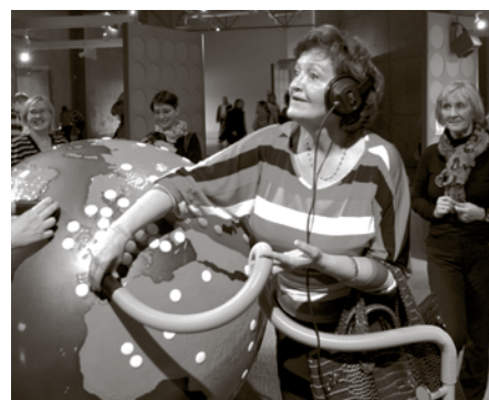
Uzliekot austiņas un pieliekot kaut ko līdzīgu putekļsūcēja caurulei uz zemeslodē atzīmētā punkta, var noklausīties konkrētās valsts raksturīgo skaņdarbu.