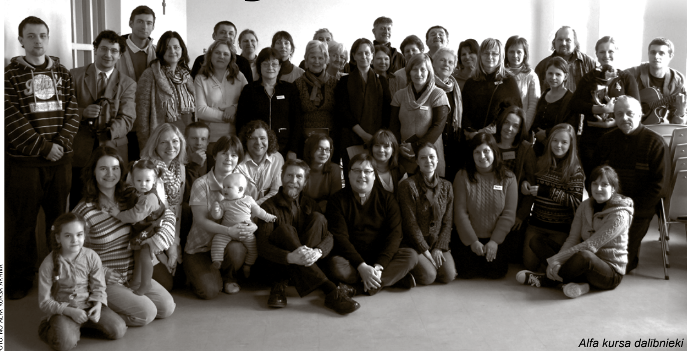
Alfa kursa dalībnieki

Droši vien nav tāda cilvēka, kurš nebūtu uzdevis sev eksistenciālus jautājumus. Kādēļ es vispār dzīvoju? Kāda ir dzīves jēga? Vai ir svarīgi, kam mēs ticam? Ko tas maina? Ja ir Dievs, kas visu šo pasauli radījis, tad kāda vieta tajā ir man? Un vai manā dzīvē ir vieta Dievam?