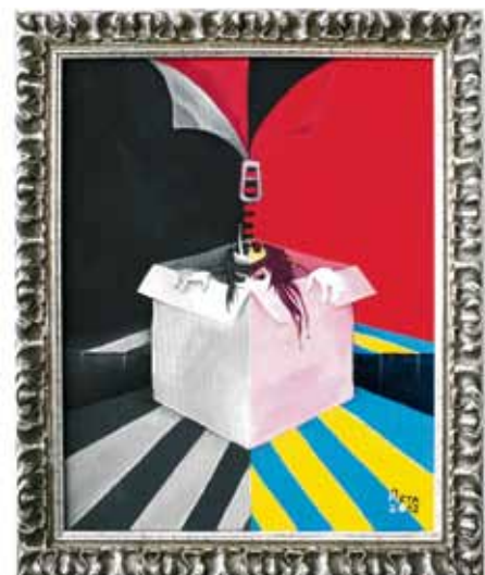
Meitene kastē. “Mums katram ir divas puses – krāsainā un melnbaltā, perfektā un nepabeigtā. Reizēm domāju, kāpēc tā uzzīmēju. Varbūt arī tās ir paslēpes?”