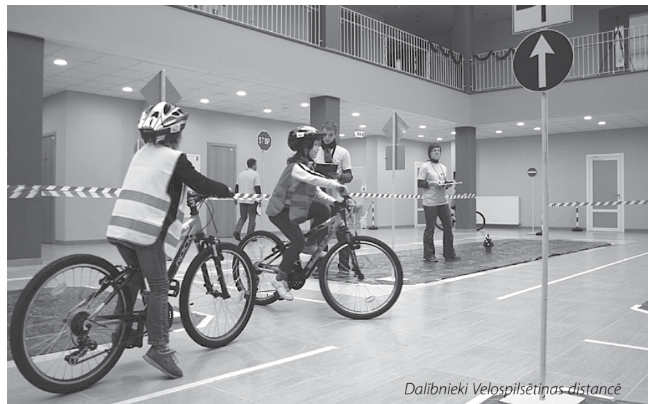
Dalībnieki Velopilsētiņas distancē

Sacensību galvenais tiesnesis un Velopilsētiņas idejas autors un īstenotājs