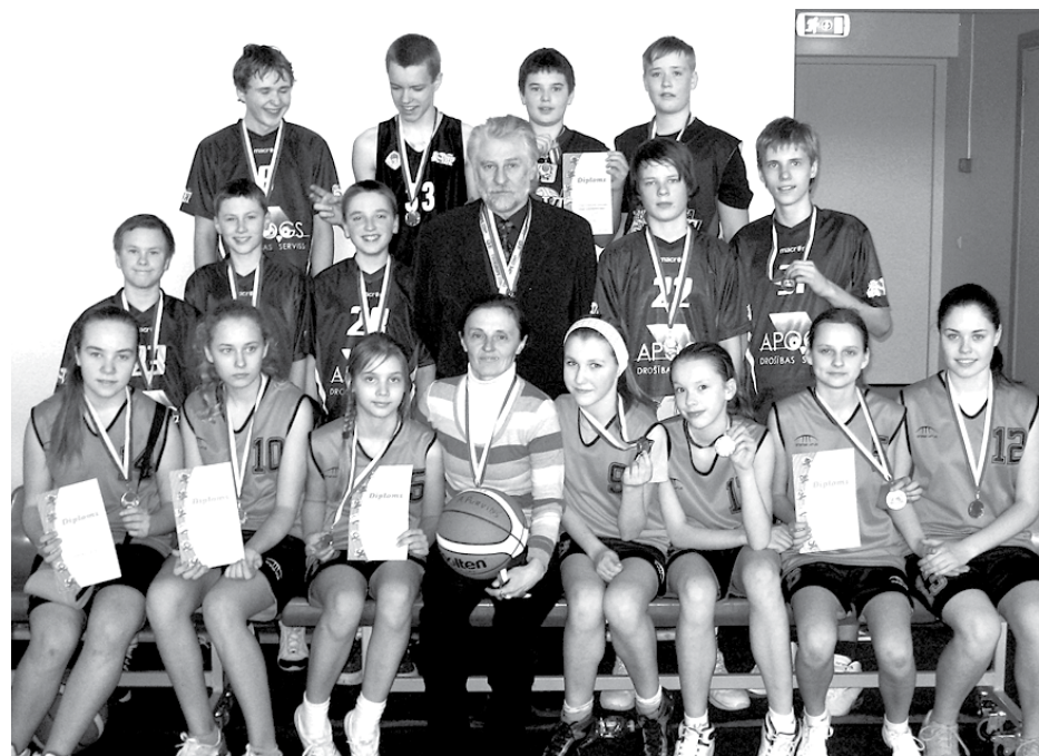
Ķekavas basketbolisti, iegūstot bronzu, 2011. gada Zemgales reģiona Bērnu un jaunatnes sporta spēlēs Jauno basketbolistu kausā

Šī iemesla dēļ vairāki Zemgales reģiona novadi, tostarp Ķekavas novads, nolēma dibināt Zemgales reģiona Bērnu un jaunatnes sporta padomi, kuras viens no uzdevumiem ir veicināt regulāru sporta pasākumu rīkošanu vispārīgā izglītībā skolās visās vecuma grupās un noskaidrot labākās skolas Zemgales reģionā atsevišķos sporta veidos.