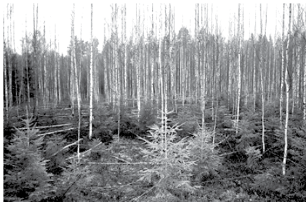
Jaunaudzēs nākotnē varētu izaugt ekonomiski un ainaviski augstvērtīgi meži.

Pēc Vides un labiekārtošanas daļas informācijas, projekta rezultātā izkoptas jaunaudzēs 27,6 ha platībā pašvaldības