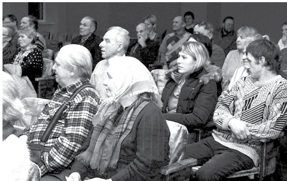
Iedzīvotāju tikšanās Daugmalē

Pagājušā gada nogalē Ķekavas novada Domes deputāti, pašvaldības speciālisti un atbildīgo iestāžu pārstāvji tikās ar Katlakalna un Daugmales iedzīvotājiem, lai pārrunātu ar novadniekiem aktuālus jautājumus un novada attīstības plānus. Piedāvājam nelielu ieskatu par abu tikšanās reīžu norisi.