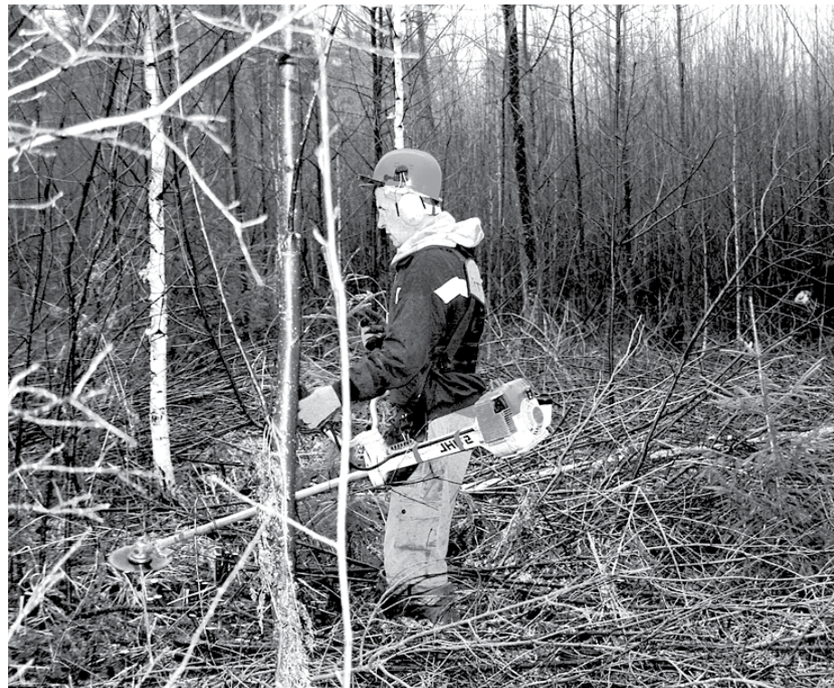
Mežu jaunaudzju kopšanas process