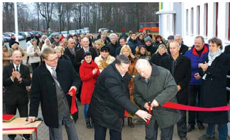
Pārgriežot sarkano lenti

Baseinu var izmantot visas novada skolas, lai mācītu bērniem peldēt vai