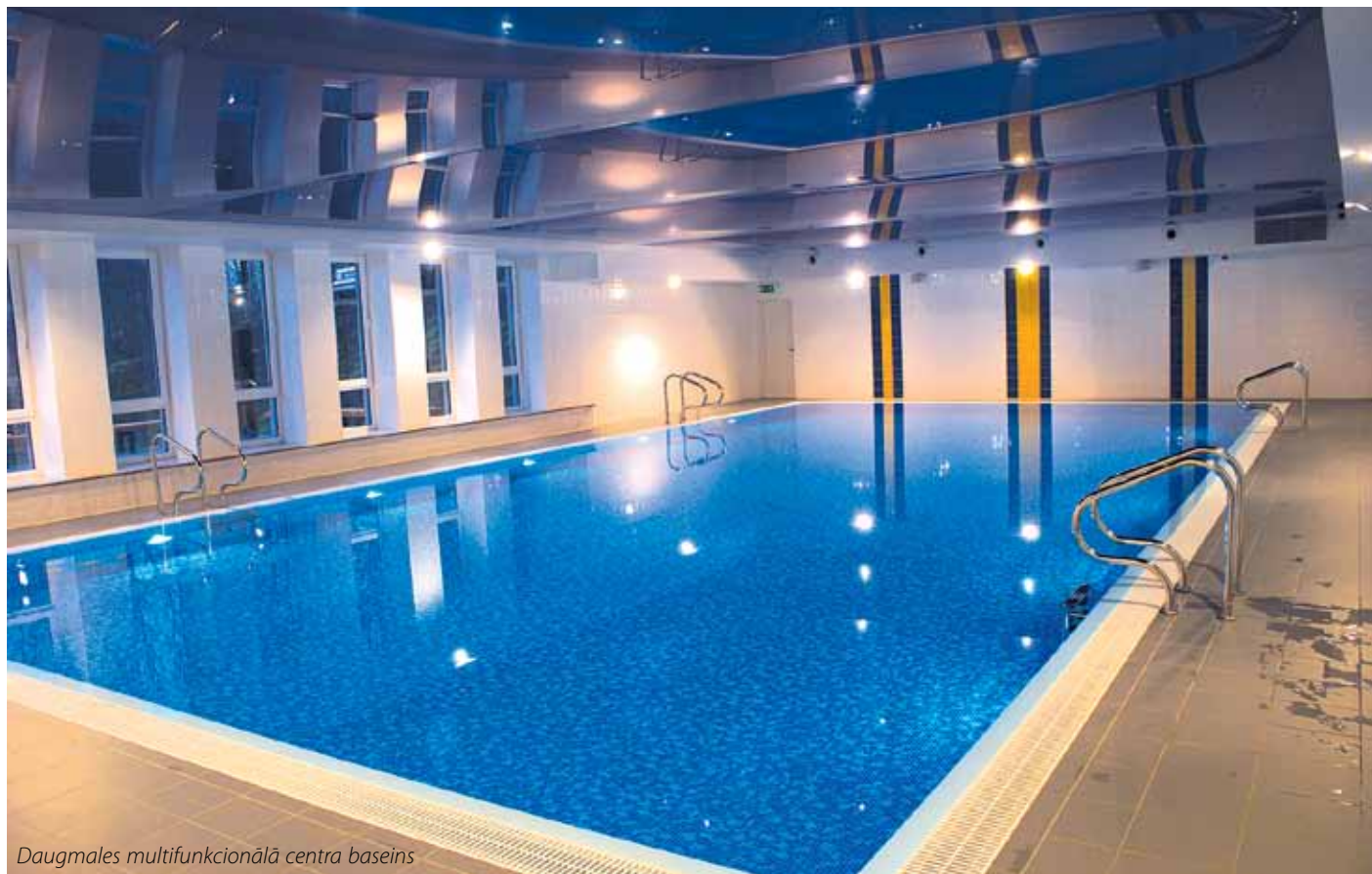
Daugmales multifunkcionālā centra baseins

Vairāku gadu garumā daugmaliešu izlolotais sapnis par saviesīgas vietas izveidi beidzot ir piepildījies – aizvadītā gada nogalē Daugmalē tika atklāts kultūras un sporta centrs ar baseinu un saietu zāli, kas dažādos brīvā laika pavadīšanas iespējas ne tikai Ķekavas, bet arī kaimiņu novadu iedzīvotājiem.