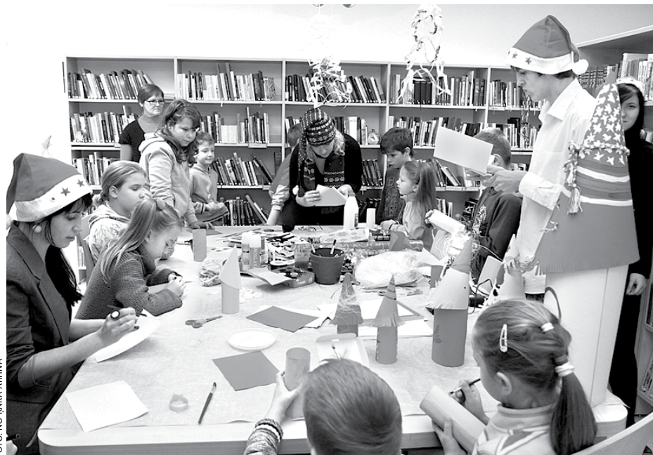
Rūķu radošās darbnīcas

Darbnīcās bērni varēja pagatavot rūķus, lukturiņšus, eņģeliņšus un puzurus. Pašus mazākos rūķi aicināja uz Ziemassvētku pasaku klausīšanos bibliotēkas bērnu nodaļā. Liela kņada bija pie Ziemassvētku pasta kastītes, kur ikvienam bija iespēja uzrakstīt vēstulīti Ziemassvētku vecītim. Visas vēstulītes tajā pašā dienā atdevām Ziemassvētku vecītim, lai viņš paspēj