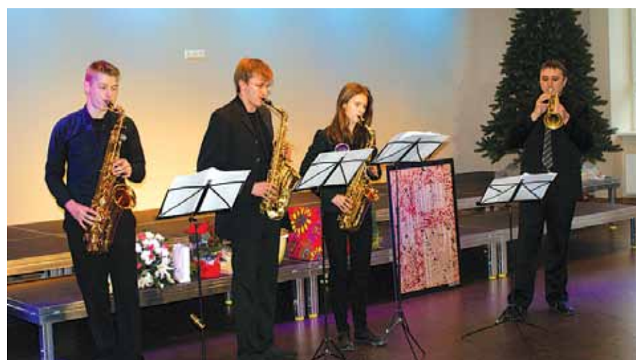
Centra atklāšanas viesus priecēja Ķekavas Mūzikas skolas audzēkņi un pedagogi.