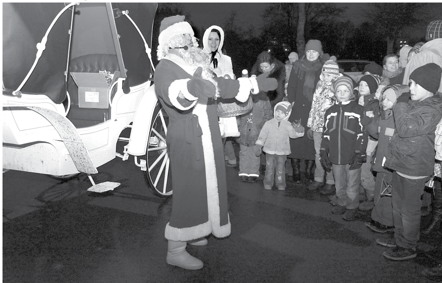
Sniega trūkuma dēļ Ziemassvētku vecītim nācās no kamanām pārsēties skaistā, baltā kariatē.

Savukārt Ķekavas pagasta bibliotēkas telpās rosījās lieli un mazi rūķi, kas līmēja un grieza, darināja un rakstīja.