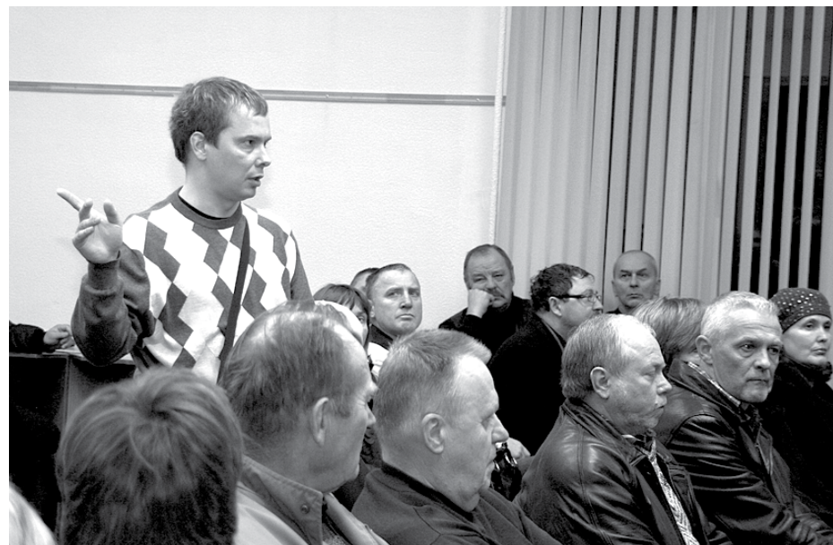
Iedzīvotāju tikšanās Katlakalnā

Paldies sapulču dalībniekiem par atsaucību un līdzdalību novada attīstībā.