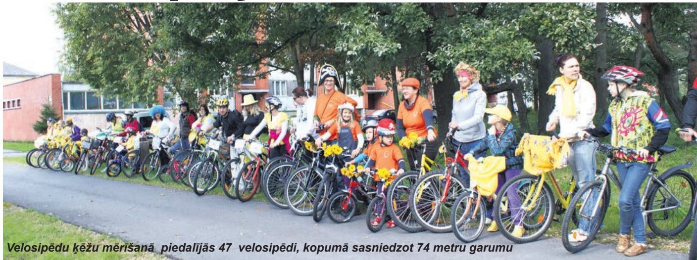
Velosipēdu ķēžu mērīšanā piedalījās 47 velosipēdi, kopumā sasniedzot 74 metru garumu

8.–9. septembrī visā Latvijā notika Eiropas Savienības līdzfinansēto projektu atvērtās dienas, kuru laikā iedzīvotāji varēja iepazīties ar labākajiem projektiem. Ķekavas novadā par vislabāk reāli-zētiem projektiem Finanšu ministrija atzina velosipēdu Baložu pilsētā un dienas centru Adatiņas Daugmalē.