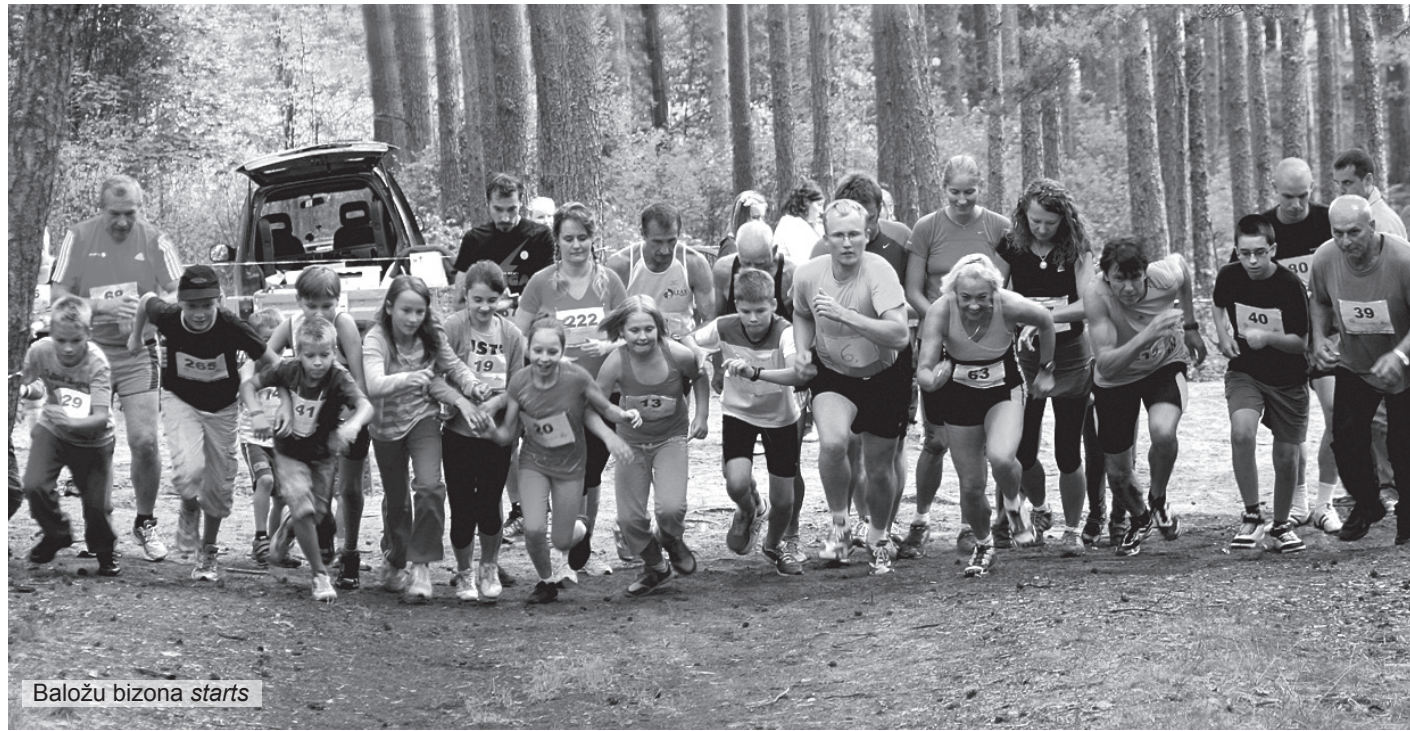
Baložu bizona starts

Līdz ar jaunā mācību gada sākumu 3. septembrī tika aizvadīts šī gada skriešanas seriāla Baložu bizons pēdējais – 8. posms.