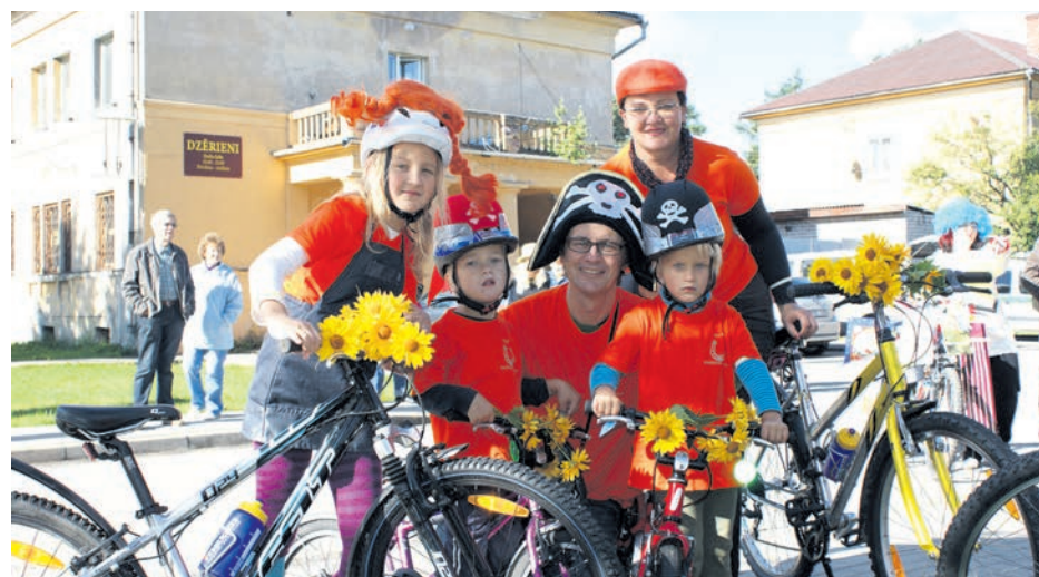
Košākā ģimene velosipēdu svētkos