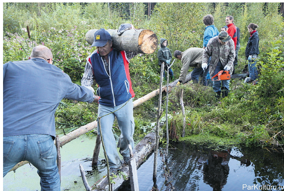
Veidojot pastaigas taku gar Titurgas ezeru

Turpinās darbs pie pastaigu takas izveides ap Titurgas ezeru. Sakārtota, skaista un iecienīta atpūtas un sporta vieta – tāds ir pastaigu takas ap Titurgas ezeru veidotāju mērķis.