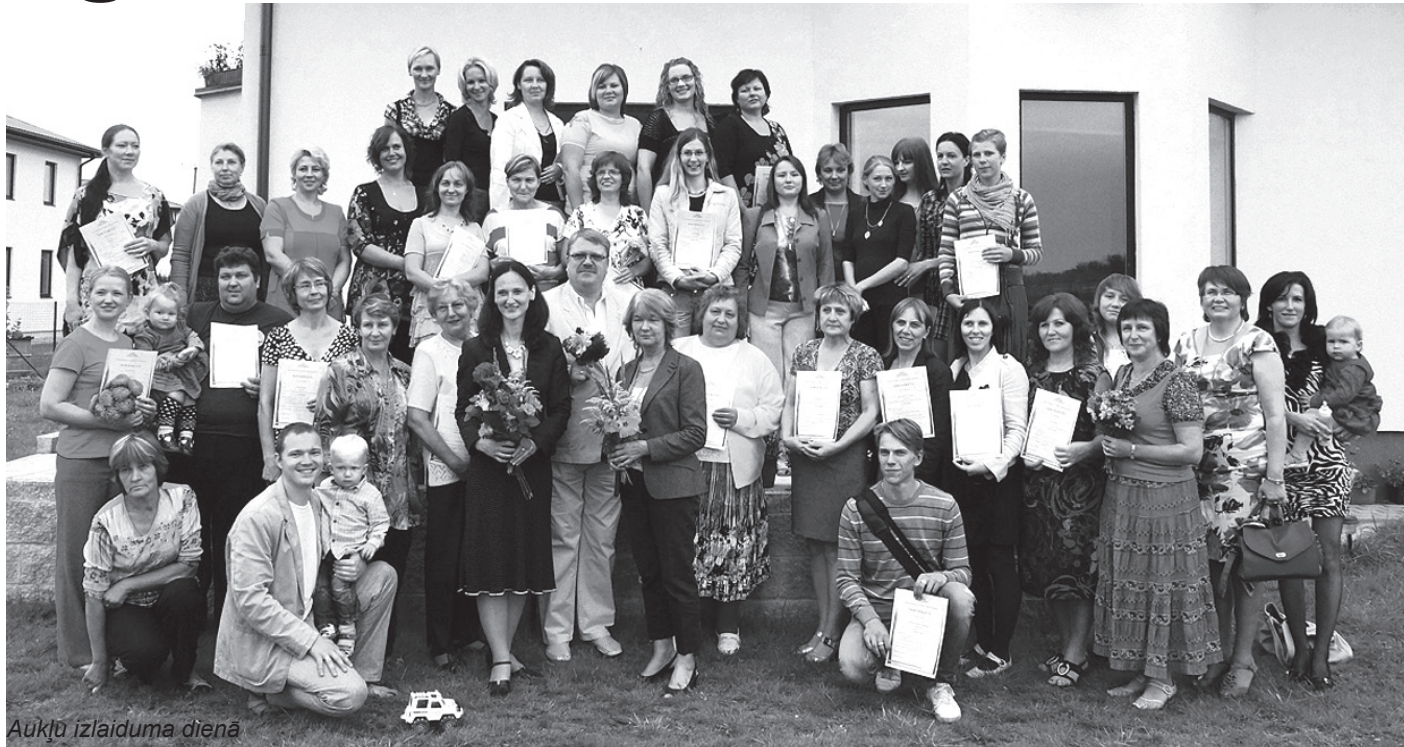
Aukļu izlaiduma dienā

Trīsdesmit seši Ķekavas novada iedzīvotāji augustā sekmīgi nokārtoja eksāmenus un saņēma aukles sertifikātu, kas ģimenēm ar bērniem ļaus saņemt kvalificētas aukles pakalpojumus.