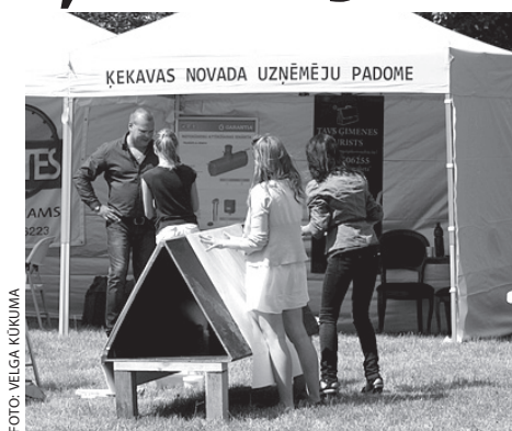
Ķekavas novada uzņēmēju padomes dalība Ķekavas novada svētkos

Gatavojot projektu, tika domāts par to, kas uzņēmējiem būtu vajadzīgs tāds, kas ir praktiski pielietojams, tiešām nepieciešams un sniegtu būtisku atbalstu biznesam, veicinot pārdošanas apjomus vai samazinot izmaksas. Rezultātā radās saraksts, no kura tika izvēlētas tādas tehnikas vienības, kuras daudziem lauku pa laikam ir nepieciešamas, tomēr ir pārāk dārgas, lai mazs uzņēmums varētu