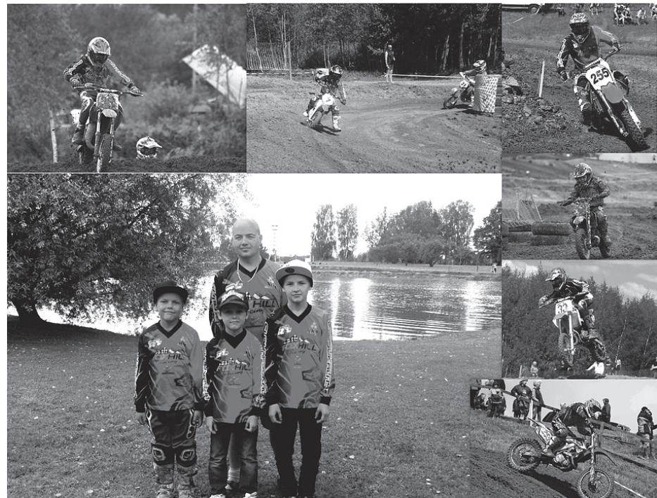
Aktīvās atpūtas kompleksa Lapsu kalns motokrosa komanda

Īstenojot izvirzītos mērķus, sportistam ir iespēja gūt piepildījuma izjūtu – gandarījuma, prieka, azarta, entuziasma, padarīta darba sajūtas īstenošanos. Ja ir