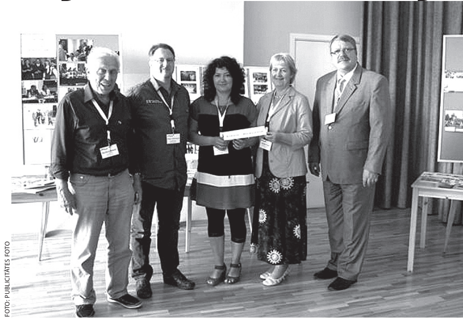
Ķekavas novada delegācija kopā ar Bordesholmas pārstāvjiem

Konferencē tika diskutēts par sabiedrības vērtību apzināšanu un atjaunošanu,