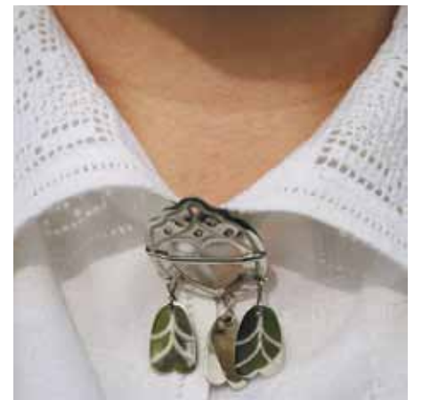
Rozīšu rakstā darinātie sieviešu blūzes un vīriešu krekla izšuvumi – īstas latviskās mežģīnes!

ķērušies pie projektu rakstīšanas. Savukārt, lai izradītu jauno rotu plašākām tautām, Vidzemes novada deju grupu svētkos Ķekavnieku kolektīva vadītāja tērpās, nu, protams, svētku kārtā!