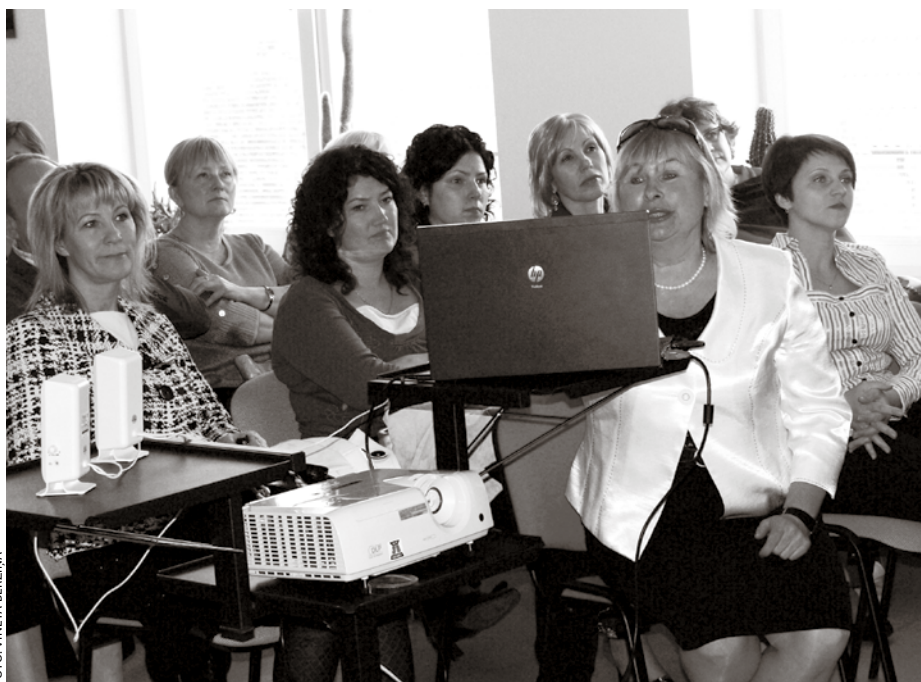
Latvijas delegācija Šauļu rajona Kužiai vidusskolā

Vizītes turpinājumā Latvijas piecu novadu izglītības speciālisti devās jau klātienē aplūkot Šauļu rajona Kužiai vidusskolu, kas ar Eiropas atbalstu rekonstruēta pirms