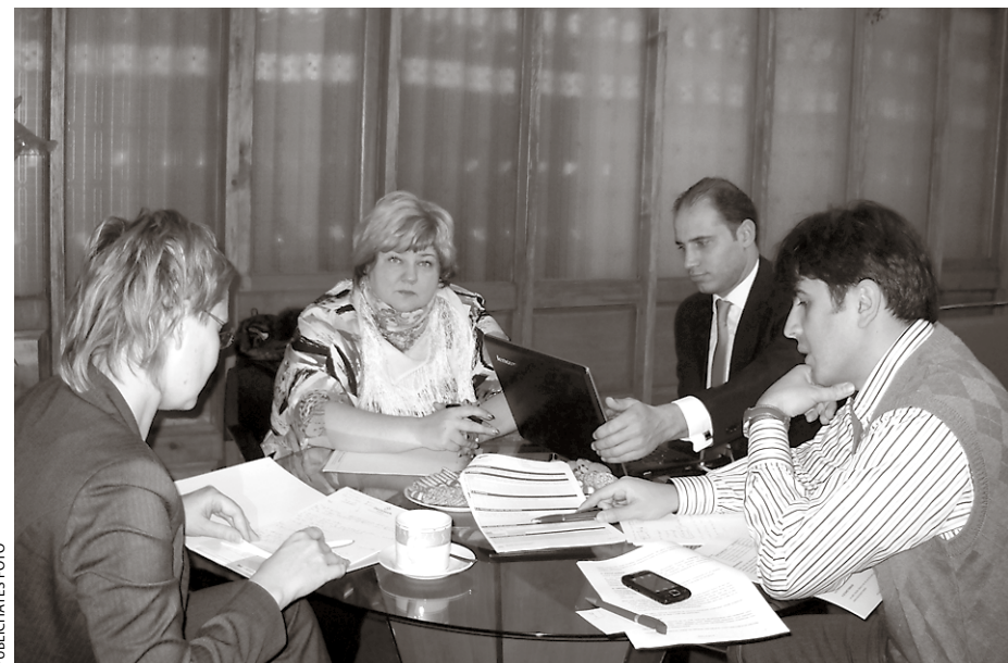
Biedrības Solis tuvāk pārstāves projekta sagatavošanas vizītē Turcijas pilsētā Konjā