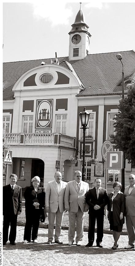
Ķekavas novada delegācija kopā ar Gostinas pašvaldības vadību