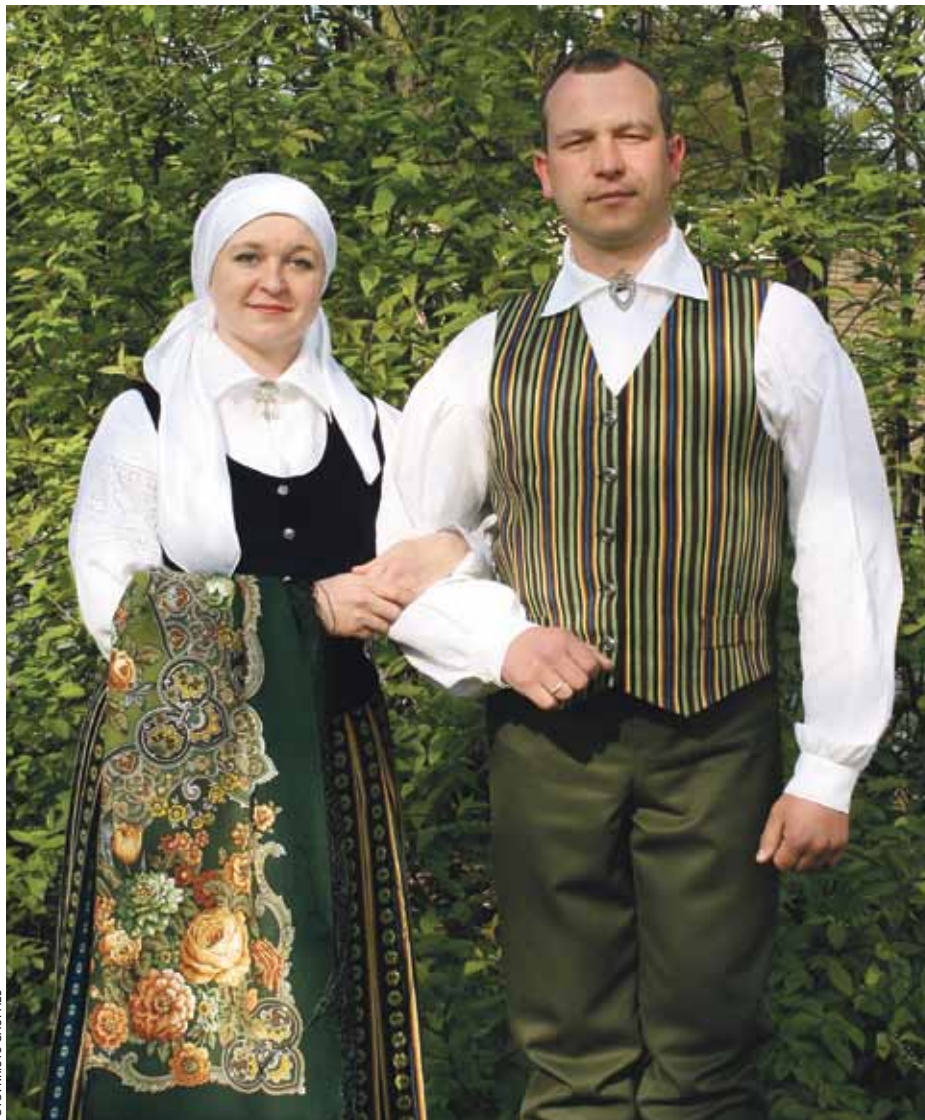
leskats tautisko tērpu audumu ekspozīcijā.

Galū galā, sakrustojot Rīgas tautastērpa variantu ar Zemgales sulīgajām krāsām, greznajiem rozīšu un zvaigznīšu rakstiem, tapis Ķekavas brunču raksts un krāsu salikums, kurā ieausts Daugavas rāmais plūdums ar ziliem debesu atspulgiem, dzeltena vasaras un balta ziemas saule, mežu, sūnu un zāles zaļums, Zemgales māla auglīgais brūnums. Izmantotais rozīšu raksts atvasināts no Zemgales rozītēm, taču auster tehniski atšķirīgi un arī pavisam citādāk izskatās.