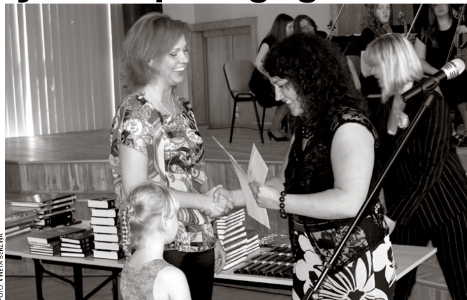
Olimpiešu svētki maijā jau kļuvuši par novada tradīciju.

Muzikālu priekšnesumu dāvāja Ķekavas novada jauniešu simfoniskais orķestris, kas nesen atgriezies no starptautiskā konkur-