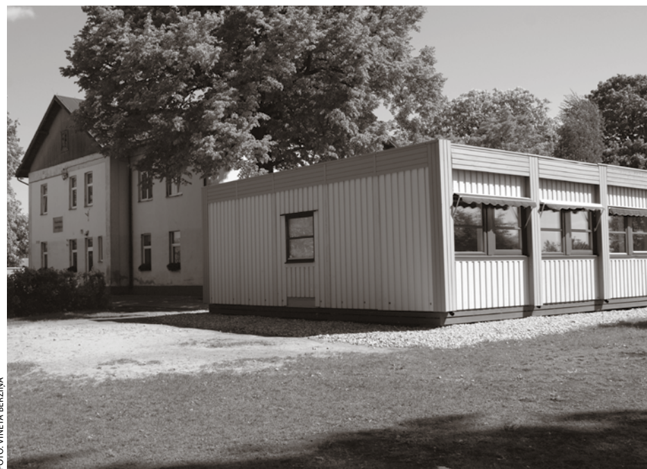
Esošie moduļi pie sākumskolas tika uzstādīti pērn 1. septembrī.