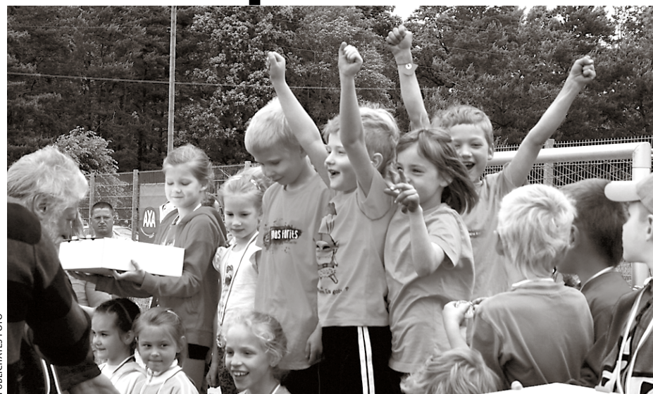
Bērnu sporta svētkos startēja 35 komandas.