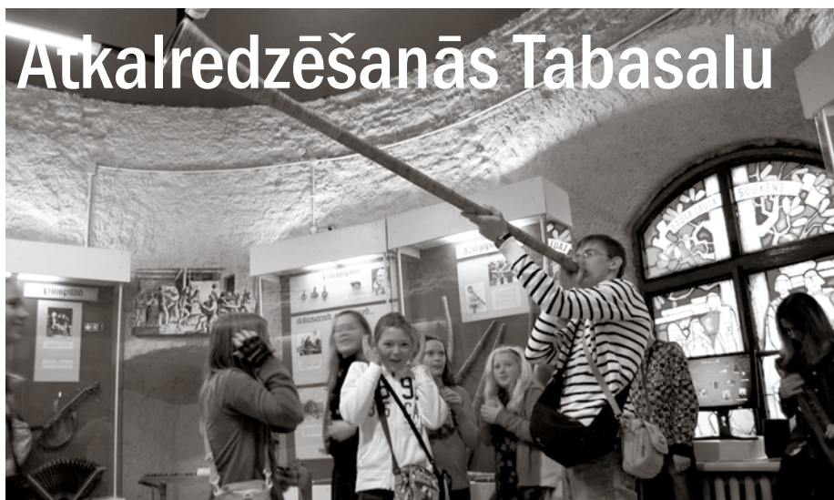
Teātra un mūzikas muzejā var izmēģināt dažādus neierastus mūzikas instrumentus.

Ķekavas Mūzikas skola man devusi vairākas iespējas paviesoties un muzicēt ārvalstīs. Arī šopavas Eiropas Savienības (ES) Nordplus Junior projekta ietvaros radās izdevība pabūt mūsu kai-