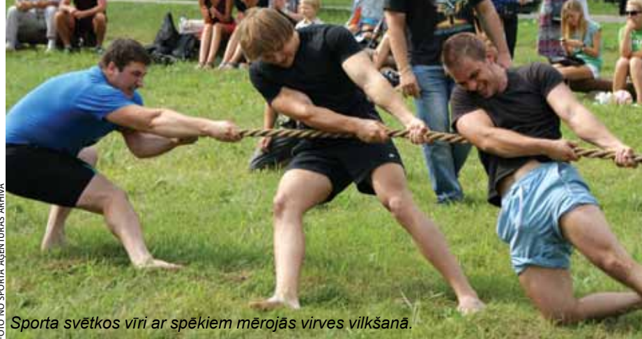
Sporta svētkos vīri ar spēkiem mērojās virves vilkšanā.

30. jūlijā pie Ķekavas sporta kluba veiksmīgi tika aizvadīti ikgadējie Ķekavas novada sporta svētki.