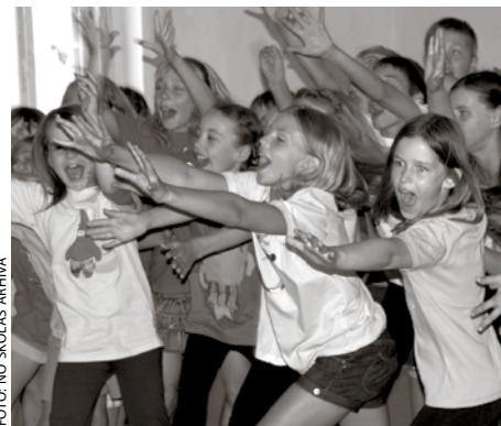
Atpūtas nometnes Jūras akmentiņi dalībnieki

Privātās pamatskolas Gaismas tilts 97 skolotājas sadarbībā ar Ķekavas novada sociālo dienestu no 26. jūnija līdz 3. jūlijam organizēja diennakts bērnu piedzīvojumu un atpūtas nometni Jūras akmentiņi , kurā 20 bērniem ar sociālā dienesta atbalstu tika dota lieliska iespēja piedzīvot neaizmirstamas astoņas dienas.