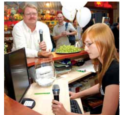
Tirdzniecības centrā Liiba turpmāk darbosies Kultūras informācijas centrs.

Ideja par kultūras informācijas centru tirdzniecības centra telpās radusies, analizējot statistikas datus par kultūras iestāžu apmeklējumu iepriekšējos gados. Tie liecināja – par kultūras norišu apmeklēšanu novadā daudz populārāka ir iepirkšanās un televīzijas skatīšanās. ĶNKA vadība pieņēma lēmumu – izveidot jaunu struktūrvienību vietā, kuru cilvēki apmeklē vis-