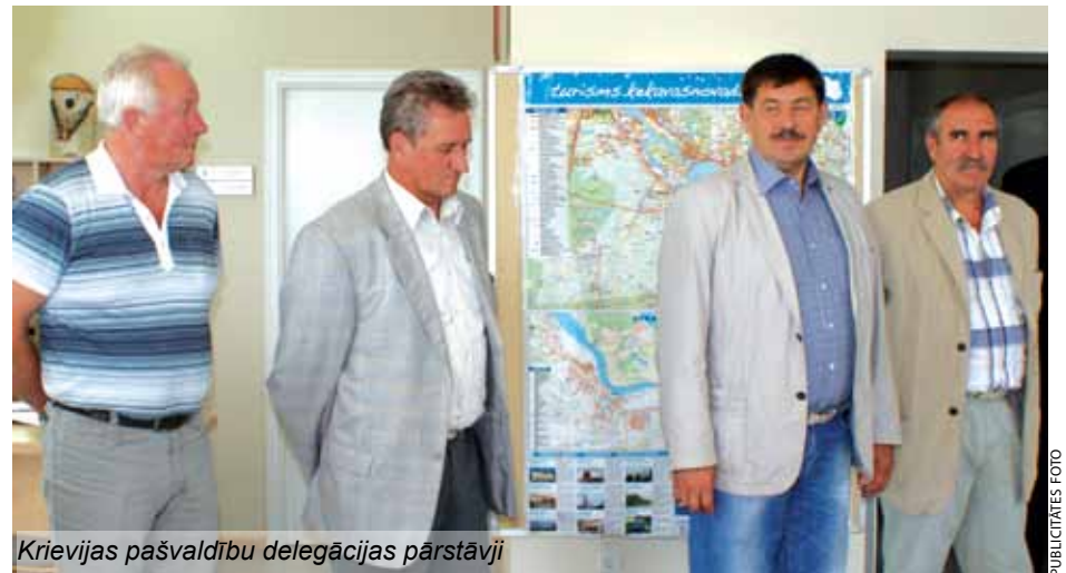
Krievijas pašvaldību delegācijas pārstāvji

Diskusijās Ķekavas pašvaldību pārstāvji runāja par Eiropas struktūrfondu uzsāktajiem, kā arī veiksmīgi īstenotajiem projektiem. Izrādot savu novadu, pārstāvji no Ķekavas novada pašvaldības ar ārvalstu viesiem apmeklēja pirmsskolas izglītības iestādi Bitīte Katlakalnā, kur Pleskavas delegācija iepriekšējā viesošanās reizē redzēto renovācijas sākumposmu varēja salīdzināt ar šī brīža ainu – jau realizētu projektu. Ķekavas novada pašvaldība, sadarbojoties ar pilsabiedrību Acana , publicē un privātās partnerības projekta ietvaros bērnu