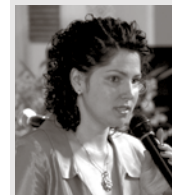
Baložu vidusskolas direktore

Jauno mācību gadu uzsākot, īpaši sveicu Ķekavas vidusskolas jaunos pirmklasniekus un viņu vecākus. Novēlu saglabāt zinātkāri un vēlmi mācīties visas dzīves garumā!