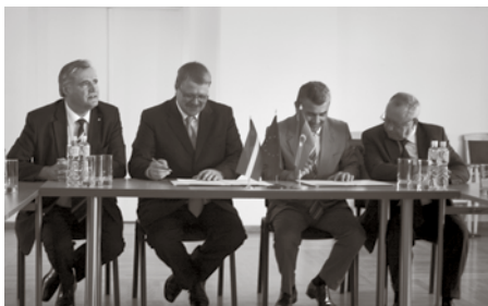
Sadarbības līguma parakstīšanas brīdis starp Ķekavas novada un Nizami pašvaldībām

No 22. līdz 29. augustam Latvijas Pašvaldību savienība atbildes vizītē Latvijā uzņēma Azerbaidžānas pašvaldību vadītāju delegāciju, kuras laikā tika noslēgti četri sadarbības līgumi starp Ķekavas novada un Nizami pašvaldību, Cēsu novada un M. A. Rasulzada paš-