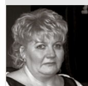
Pļavniekkalna sākumskolas direktore

Jaunā mācību gada sākums ir brīnišķīgs atskaites punkts, lai uzsāktu kaut ko jaunu, lai mainītu ieradumus, lai izvīrītu augstākus mērķus. Negaidiet ne mirkli, neatlieciet uz rītdienu, bet dariet jau šodien! Esiet aktīvi un atraktīvi, esiet radoši un varoši, esiet dar-bīgi un atbildīgi! Atcerieties, ka dzīve ir tieši tik interesanta, cik mēs paši to vēlamies!