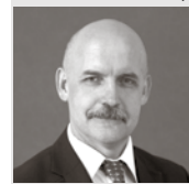
Daugmales pamatskolas direktors

Sirsnīgi sveicu visus pedagogus, skolēnus un vecākus, jauno mācību gadu uzsākot!