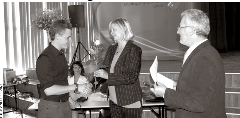
Konferencē tika sveikti jaunie pedagogi.

Konferencē vieslektori stāstīja par aktualitātēm jaunajā mācību gadā (piemēram, vienots centralizēts eksāmens latviešu valodā 12. klasei gan valsts, gan mazākumtautības skolās; eksāmena vē-