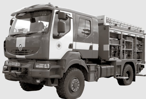
Organizē Ķekavas novada Pašvaldības policija

Plašāka informācija vietnē www.kekavasnovads.lv