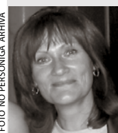
Ķekavas Sporta skolas direktore

Novēlu katram piedzi-vot gan savu personīgo, gan profesionālo mērķu piepildījumu, drosmi pie-nemt dzīves izaicinājumus un sagaidīt nākamo vasaru ar gandarījumu par sasniegto.