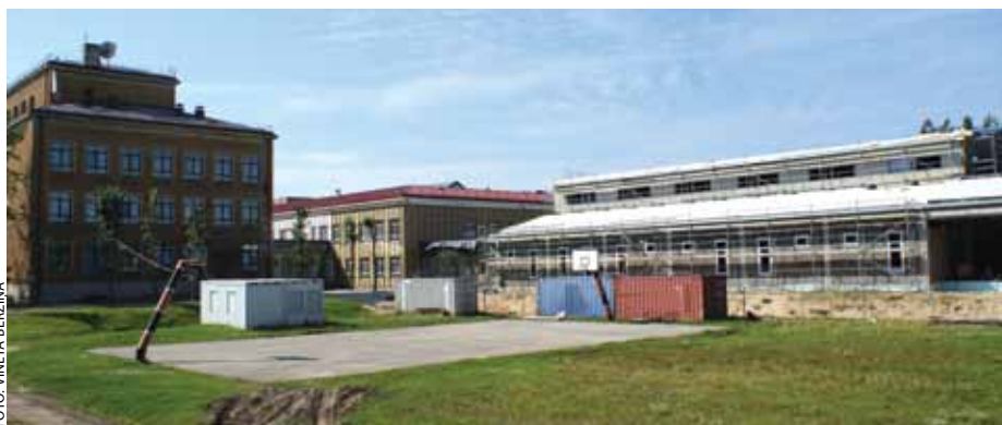
Baložu vidusskolas piebūves tapšana