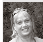
Privātās pamatskolas Gaismas tilts 97 direktore

Saviem pedagogiem vēlu gūt gandarījumu, radošu garu un neizsīkstošu enerģiju! Lai mums veicas!