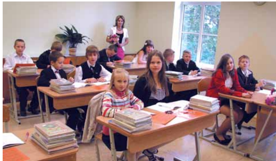
1. septembris Daugmales pamatskolā

Skolas zvans ieskandināja jauno 2011./2012. mācību gadu Baložu vidusskolā, Daugmales pamatskolā, Pļavniekkalna sākumskolā, Ķekavas vidusskolā, privātajā pamatskolā Gaismas tilts 97 , Ķekavas Mūzikas skolā un Ķekavas Mākslas skolā. Sveicot skolotājus, audzēkņus un viņu vecākus Zināšanu dienā, veiksmīgus panākumus jaunajā mācību gadā vēlēja