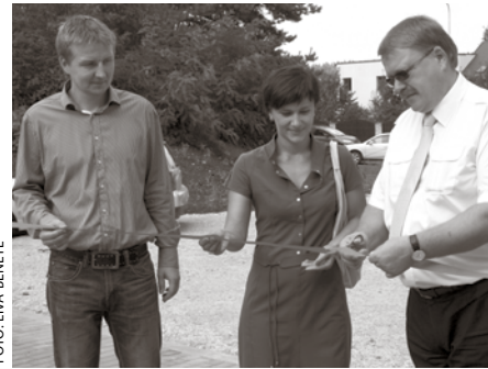
Atklājot jauno ūdensapgādes atdzelzēšanas staciju Baložos

Līguma ietvaros Baložos, Bērzu ielā 10, izbūvētas trīs jaunas artēziskās