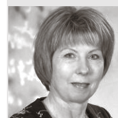
Ķekavas vidusskolas direktore