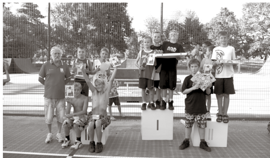
A grupa (2000. gadā dzimušie un jaunāki)