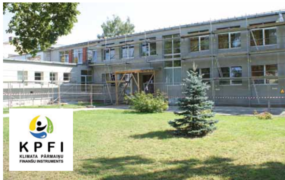
Bērnudārza siltināšana norit ar Eiropas atbalstu.

Runājot par siltināšanas darbiem, kā būtisks aspekts jāmin bērnu drošība. Kā