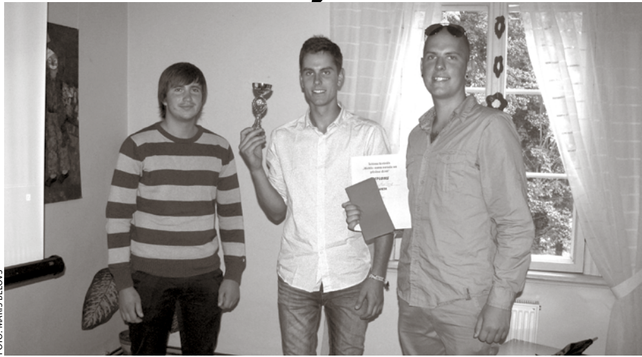
Īsfilmu apbalvošanas ceremonijā filmas Strūklaka veidotāji

Par spīti stiprajām lietusegāzēm un nelabvēlīgiem laikaapstākļiem, veiksmīgi noslēdzās biedrības Partnerība Daugavkrasts organizētais jauniešu īsfilmu festivāls Mirklijs mana novada un pilsētas dzīvē .