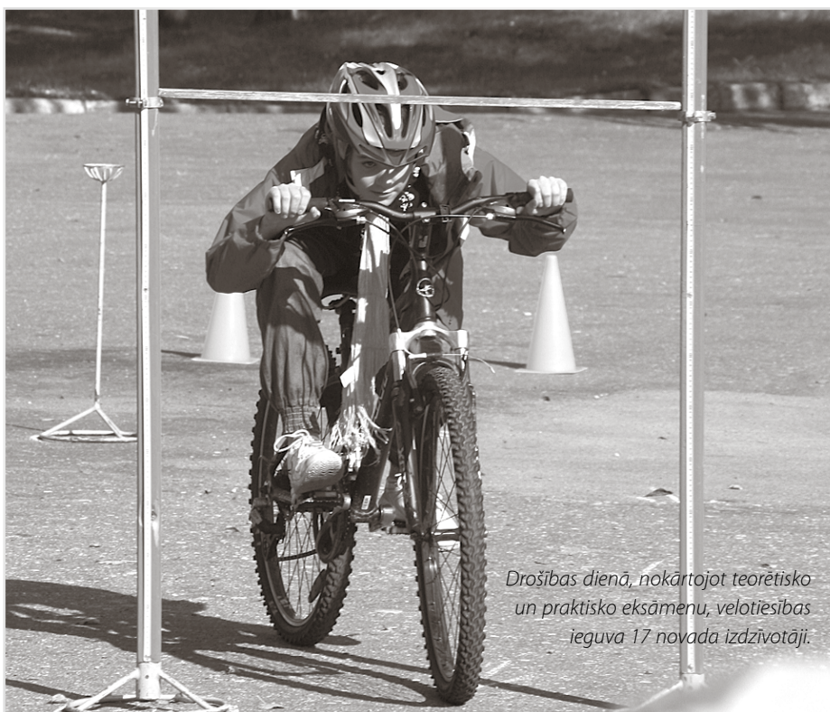
Drošības dienā, nokārtojot teorētisko un praktisko eksāmenu, velotiesības ieguva 17 novada iedzīvotāji.