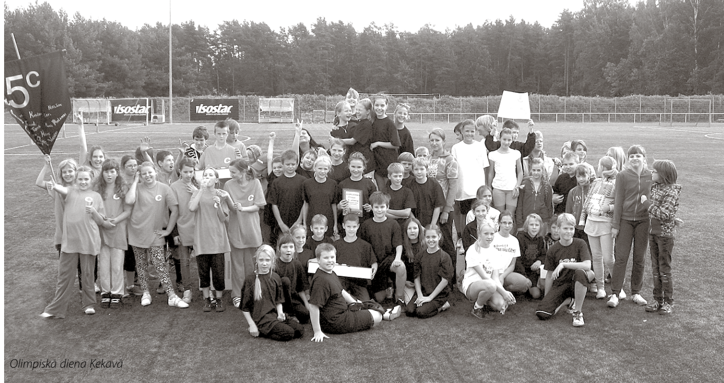
Olimpiskā diena Ķekavā