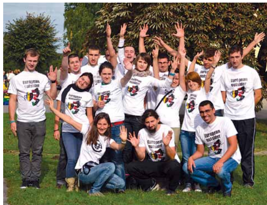
Projekta dalībnieki no svešiniekiem kļuva par labiem draugiem arī dažādu aktivitāšu laikā.

Tāpat jaunieši internacionālās komandās demonstrēja trīs dažādus teatrālos iestudējumus par diskrimināciju, katrs no tiem bija savā stilā – latviešu, ungāru un rumāņu. Uzvedumos tika parādīta diskriminācija dažādos sabiedrības slāņos, diskriminācija etniskās piederības, reliģijas, seksuālās orientācijas dēļ, kā arī vienkārši – izskata dēļ. Iestudējumi tika filmēti, lai vē-