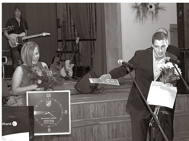
Swedbank pārstāvis pārsteidza titula Labākais skolotājs Ķekavas novadā 2011./2012. mācību gadā ieguvēju, paziņojot skolotājai par bankas dāvanu – klēpj datoru.

Latvijas mākslas izglītības sistēma ir viena no spēcīgākajām pasaulē, un Ķekavas Mākslas skolas audzēkņu darbu godalgotās vietas starptautiskos konkursos ir mākslinieces un skolotājas gandarījums.