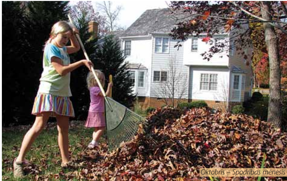
Oktobris – Spodrības mēnesis