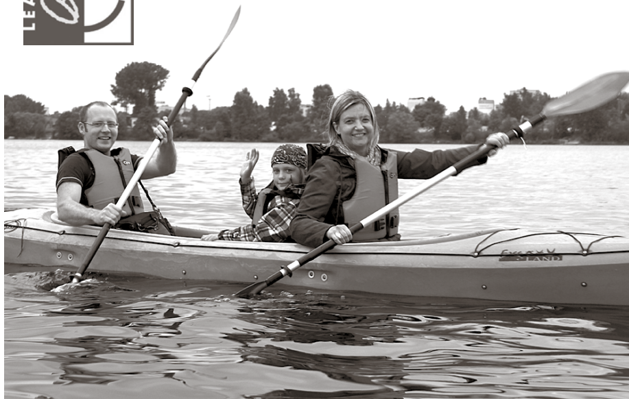
Ūdenstūrisma entuziasti un aktīvās atpūtas cienītāji

Izmantojot Eiropas Lauksaimniecības fonda lauku attīstībai ietvaros LEADER programmas projektu konkursa iespējas, biedrība Piedzīvojumu parks izveidoja laivu nomu un izstrādāja ūdenstūrisma maršrutus Ķekavas novada teritorijā.