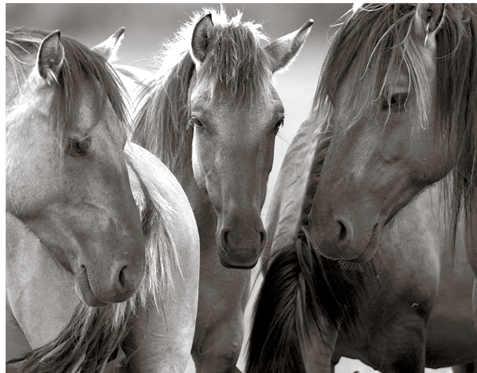
Palielinās zirgu mīļotāju pulks

Apzinot vairākas zirgudzētavas, kā arī privātos zirgu īpašniekus, tika izvēlēti ļoti miermīlīga un paklausīga ķēvīte Silfīda, kura jau šobrīd bauda jauno māju piedāvāto plašumu un brīvību, kā arī labprāt vīzina bērnus un jauniešus.