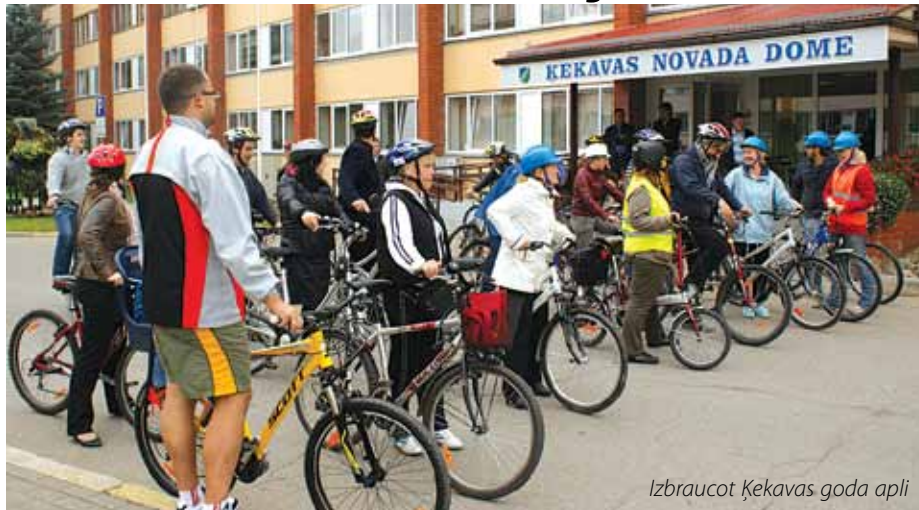
Izbraucot Ķekavas goda apli

Pasludinot 22. septembri par Dienu bez auto , šogad visā Eiropā jau desmito reizi iedzīvotāji tika aicināti atbalstīt ilgtspējīgu mobilitāti – labākas pilsētas,