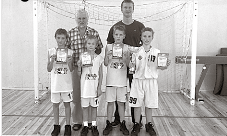
Ķekavas čempioni Āgenskalna kausā

Pirmo reizi notika Āgenskalna kauss basketbolā 3:3 uz diviem groziem 2001. gadā dzimušiem un jaunākiem zēniem.