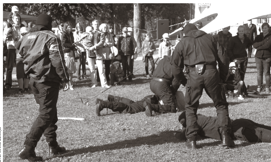
Pasākuma apmeklētāji ar lielu aizrautību vēroja dažādu drošības dienestu paraugdemonstrējumus.