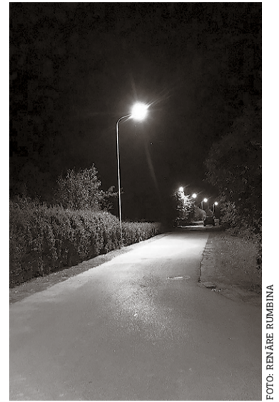
Apgaismojums Atmosas ielā.

Tāpat Ķekavas novada pašvaldība ir izbūvējusi apgaismojumu Ķekavā, Stirnu ielā – pašvaldībai