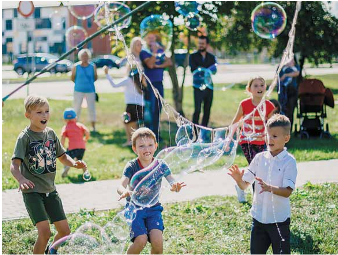
Mirkļis no Jaunatnes iniciatīvu centra rīkotā pasākuma „Zinību dienas virpuļi”.