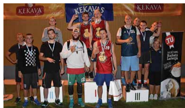
Izcīnīta iespēja kāpt uz goda pjedestāla.

A7 tūres pirmo divu vietu ieguva U11 grupā – komandas „Trīs basketbolisti” un „Skrajūnai” no Lietuvas, U14 grupā – „Prožektors” un „Trolejbuss”, U16 grupā – „NOA” un „Raimonds”, vīriešu grupā – „Bauskas zelta