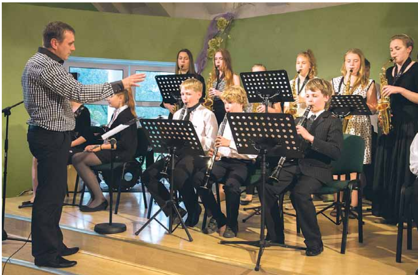
Ķekavas mūzikas skolas orķestris mācību gada noslēguma koncertā.