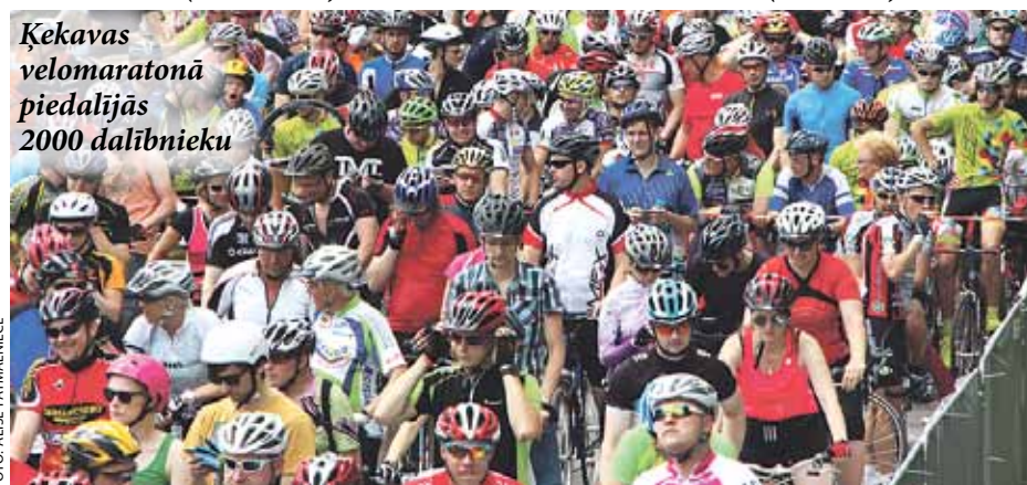
Ķekavas velomaratona piedalījās 2000 dalībnieku