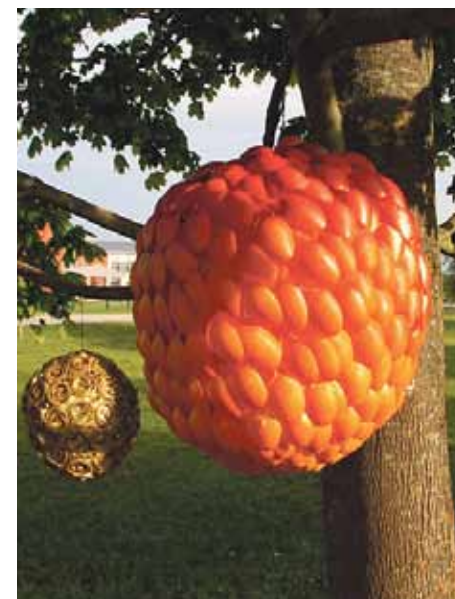
Mākslas skolas audzēkņu darbi Muzeju nakts tēmas „Krāsa – dzintarsarkanā” pasākumu ietvaros.