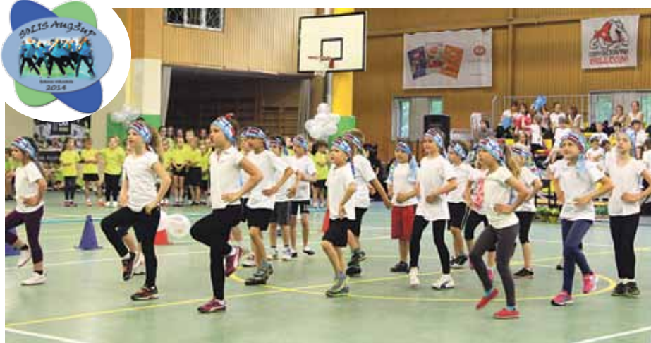
Mirkļis no Aerobikas dienas.