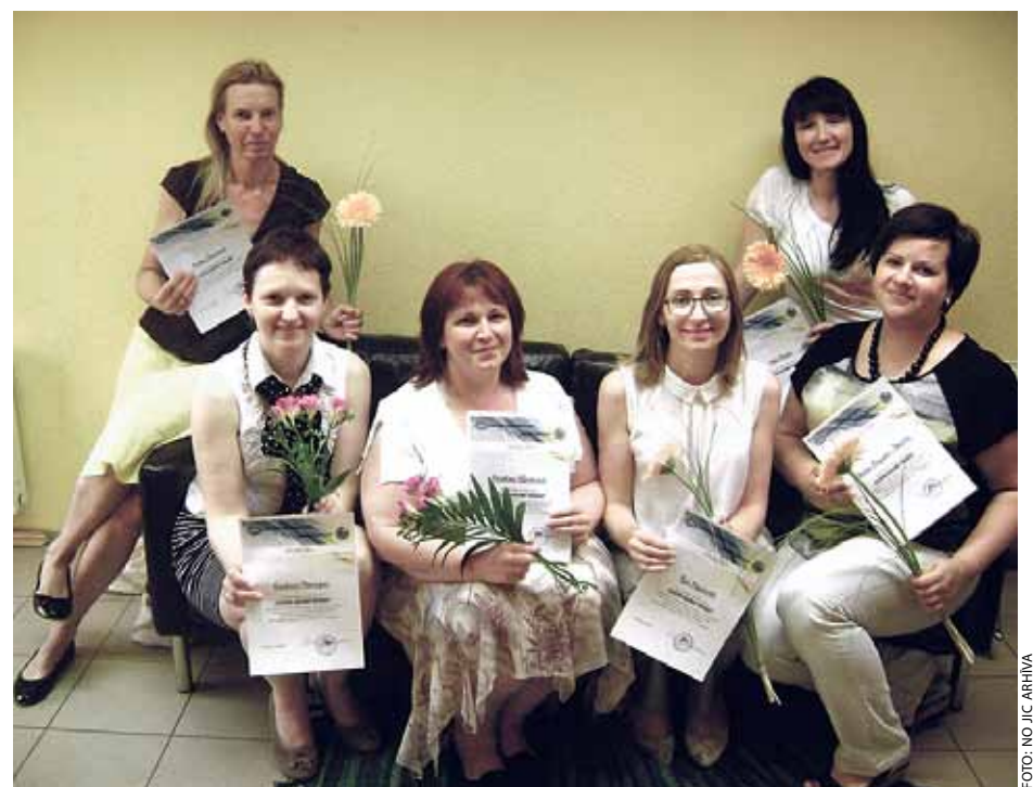
Mācību un atbalsta grupas cikla pusaudžu vecākiem dalībnieces.