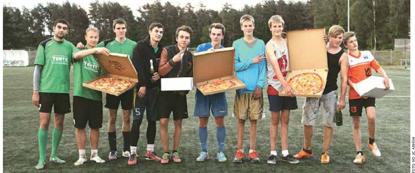
Pirmā Ķekavas alianses „Ghetto Football” posma uzvarētāji.

31. maijā veiksmīgi noslēdzās pirmais Ķekavas alianses „Ghetto Football” posms. Pasākums notika Ķekavā, futbola stadionā „Auda”, speciāli šim pasākumam izveidotā iežogotā ghetto „3 pret 3” futbola laukumā.