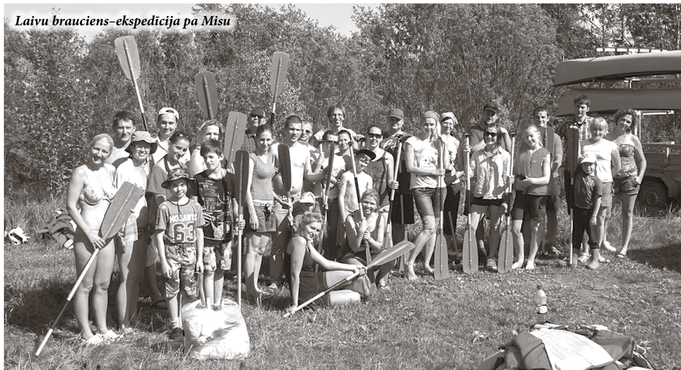
Laivu brauciens–ekspedīcija pa Misu