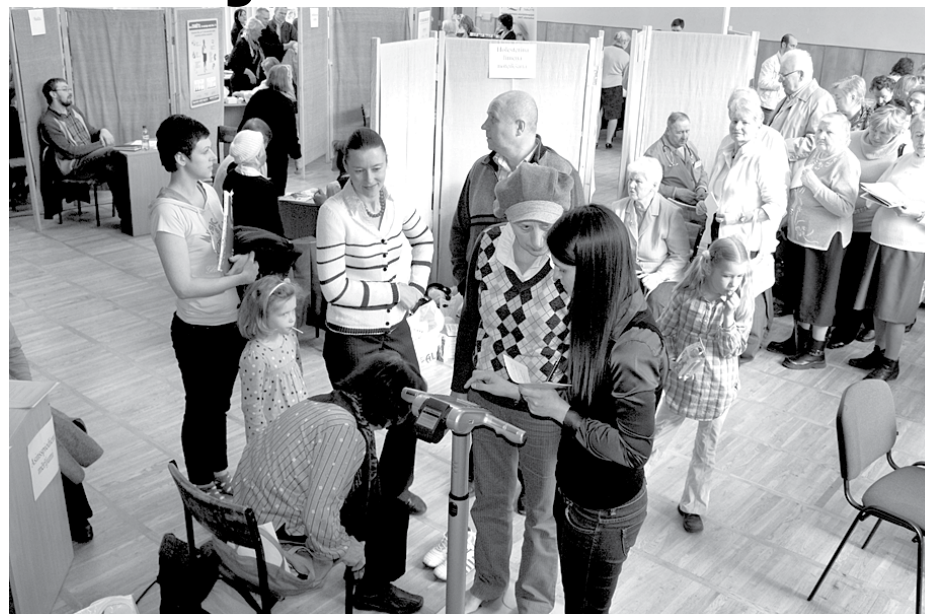
Veselības diena 2011. gadā

Jau trešo gadu biedrība Solis tuvāk un Ķekavas ambulance aicina Ķekavas novada iedzīvotājus uz Veselības dienu, kura šogad notiks 14. aprīlī plkst. 10.00–16.00 Ķekavas kultūras namā.