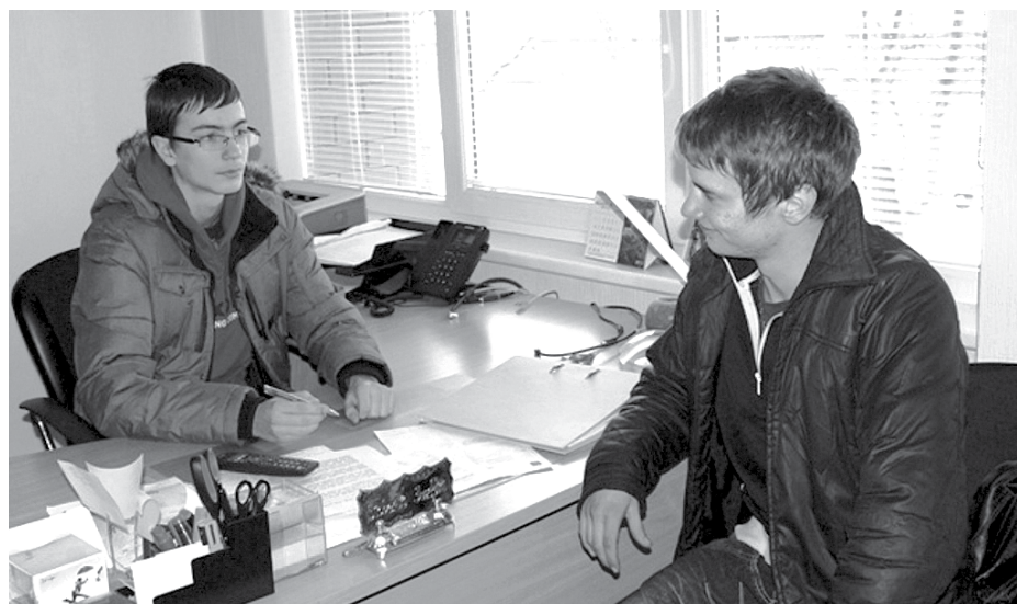
Ēnu diena Ķekavas novada pašvaldībā

Latvijas Ēnu dienā, 15. februārī, Ķekavas novada pašvaldībā viesojās skolēni, lai uz vienu dienu kļūtu par kāda pašvaldības darbinieka ēnu un iepazītu sev interesējošo profesiju praktiskā darbā.