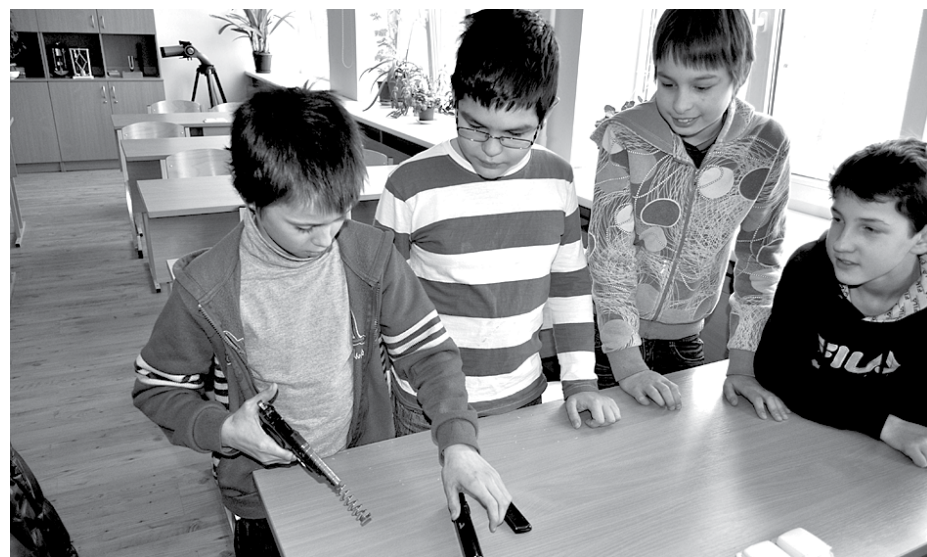
Skolēni paši varēja izjaukt un salikt šaujāmieroči.

5. un 6. klasēm, un tie bija ne tikai zēni, kā tas sākotnēji varētu šķist, bet arī meitenes, no kurām dažas pat apsteidza puisi šaujāmieroču izjaukšanas un salikšanas sacensībās.