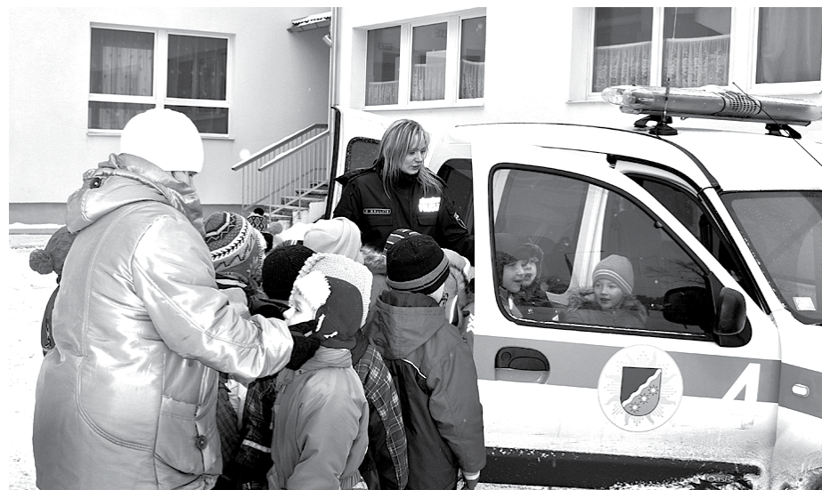
Bērniem ļoti interesēja policijas mašīna un tās aprīkojums.