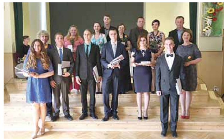
Atzinības rakstu saņēmušie skolēni ar saviem vecākiem.