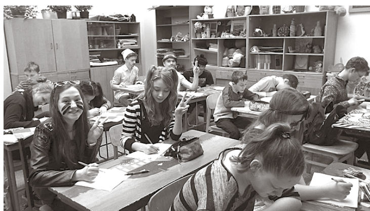
Daugmales pamatskolas skolēni piedalījās zīmēšanas konkursā „Šķirojam atkritumus”.

laikā. Pareizo atbilžu sniedzēji, kuru nebija mazums, nopelnīja balvas. Savukārt uzsākot jauno mācību gadu, visās Ķekavas novada sākumskolās notiks „zaļā” stunda, kuras laikā jaunāko klašu skolēni varēs noskatīties Daugmales skolēnu veidotu multfilmu par atkritumu šķirošanu „Ko darīt?”.