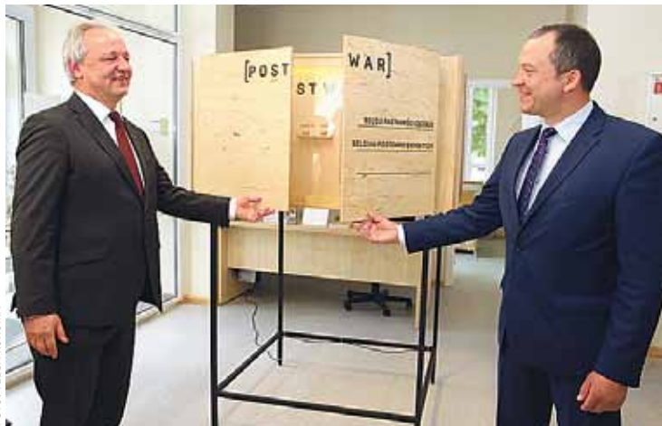
Beļģijas vēstnieks Latvijā (no kreisās) atklāj izstādi kopā ar Ķekavas domes priekšsēdētāju

Savukārt vizītes noslēgumā vēstniecības pārstāvji devās uz Daugmali, lai apskatītu Nāves salu, kur Pirmajā pasaules karā pirmo reizi Austrumu frontē tika izmantoti ķīmiskie ieroči. Savukārt Rietumu frontē šie ieroči