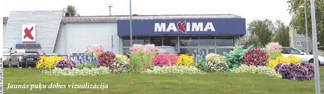
Jaunās puķu dobes vizualizācija

Pateicoties veiksmīgajai sadarbībai starp Ķekavas novada pašvaldību un SIA „Maxima Latvija”, maijā Ķekavas centrā ir tapusi puķu dobe.