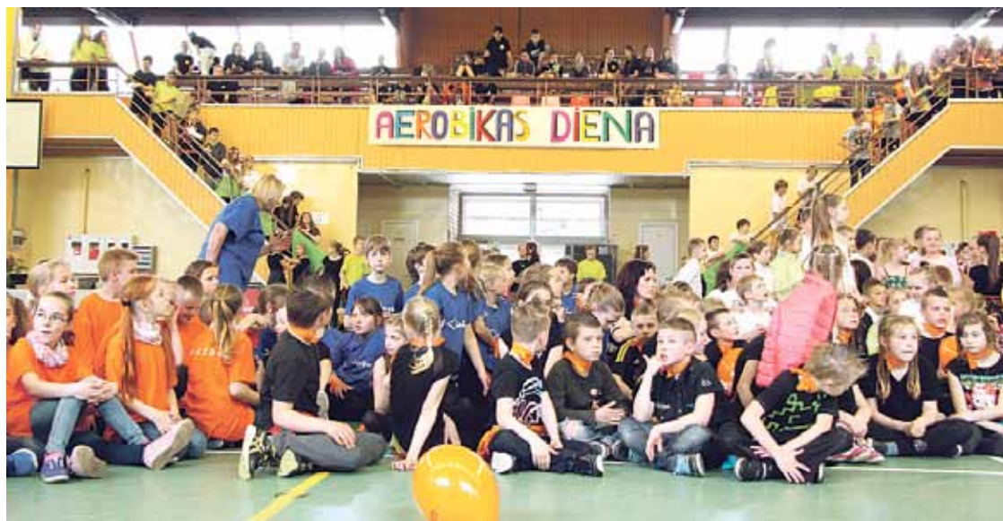
Mirkļis no Aerobikas dienas.