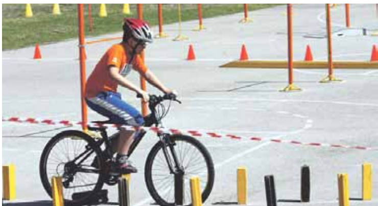
Dalībnieks veic šķēršļu joslu.