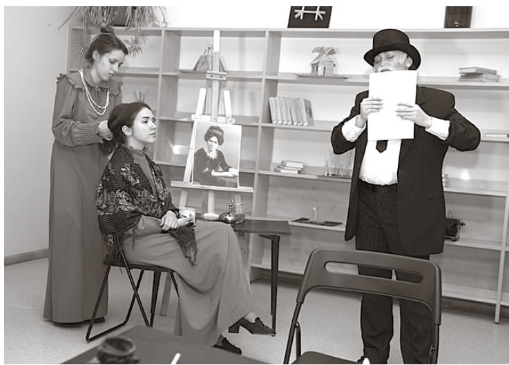
Nepieradinātā improvizācija „5 Raiņi un Aspazija”.

lēmam literāros objektus!”, kur varēja atpazīt Raiņa un Aspazijas darbu tēlus.