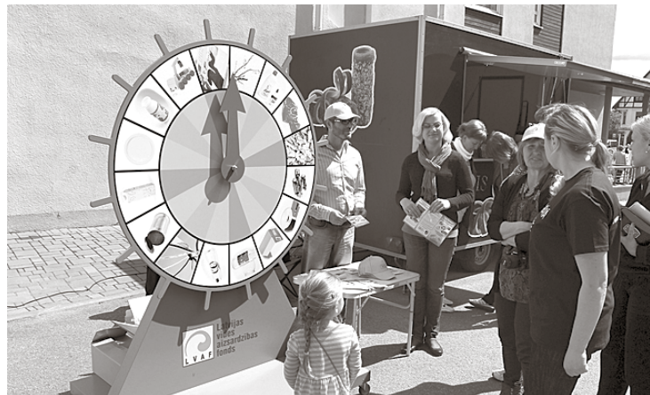
Iedzīvotāji savas zināšanas atkritumu šķirošanas jomā var atsvaizdināt un uzlabot biedrības organizēto akciju laikā.

Pirmā akcija notika 24. maijā pie Doles Tautas nama gadatirgus