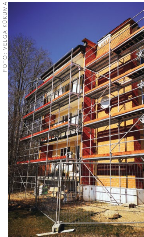
Tiek siltināta ēka Ķekavā, Nākotnes ielā 8.

Atbilstoši SIA „Ķekavas nami” teiktajam, pašvaldības uzņēmums šobrīd ir iesniedzis siltināšanas projektu pieteikumus vēl četrām daudzdzīvokļu mājām (trīs Ķekavā un viena Valdlaučos), lai saskaņotu energoefektivitātes būvdarbu iepirkuma procedūras dokumentus ar valsts attīstības finanšu institūciju „Altum”, kas nodrošina projekta konsultatīvo vadību, īstenošanas