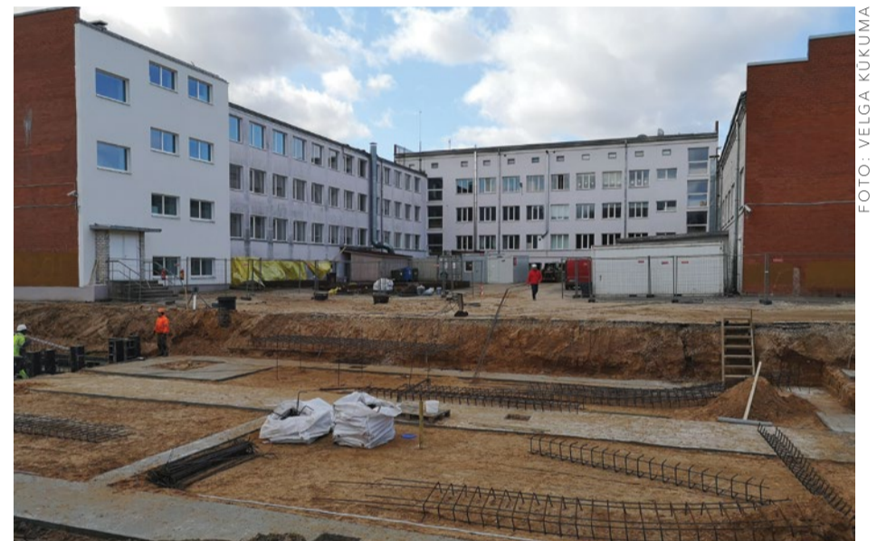
Ķekavas vidusskolas piebūves būvniecības process.