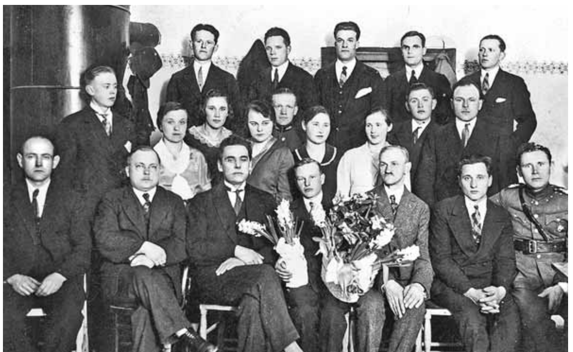
Pulkarnes amatieraktieri pēc A. Dziļuma lugas „Pie ozola” izrādes Doles tautas namā Ķekavā.

Ķekavas novadpētniecības muzeja speciāliste