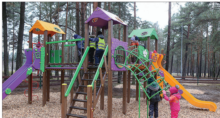
Valdlaučos izveidota un labiekārtota rotaļu un atpūtas zona.

Tāpat projekta ietvaros aizvadītajā skolēnu rudens brīvlaikā bērniem no daudzbērnu