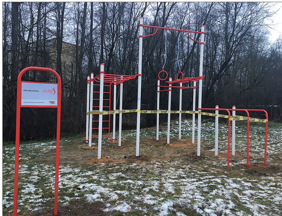
Multifunkcionālais āra treniņieris Ķekavas parkā.

Tā kā āra treniņieru komplekss Ķekavas parkā tika uzstādīts pērn decembrī, plānots, ka tā atklāšanas pasākums tik organizēts šā gada pavasarī, tāpēc aicinām visus