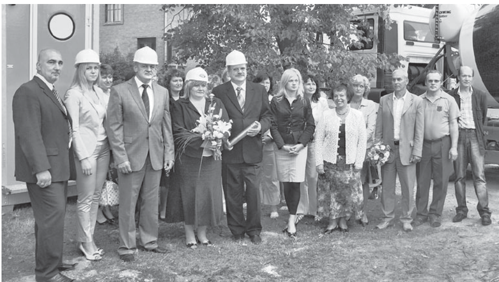
Uz sporta zāles būvniecības atklāšanu bija pulcējušies gan domes deputāti, gan Pļavniekkalna sākumskolas pedagogi.

Sākumskolas sporta zāles projektēšanu un būvniecību, pamatojoties uz atklāta konkursa rezultātiem, veic SIA “RRKP būve”. Pirmie darbi uzsākti jūlija vidū, un tie jāpabeidz