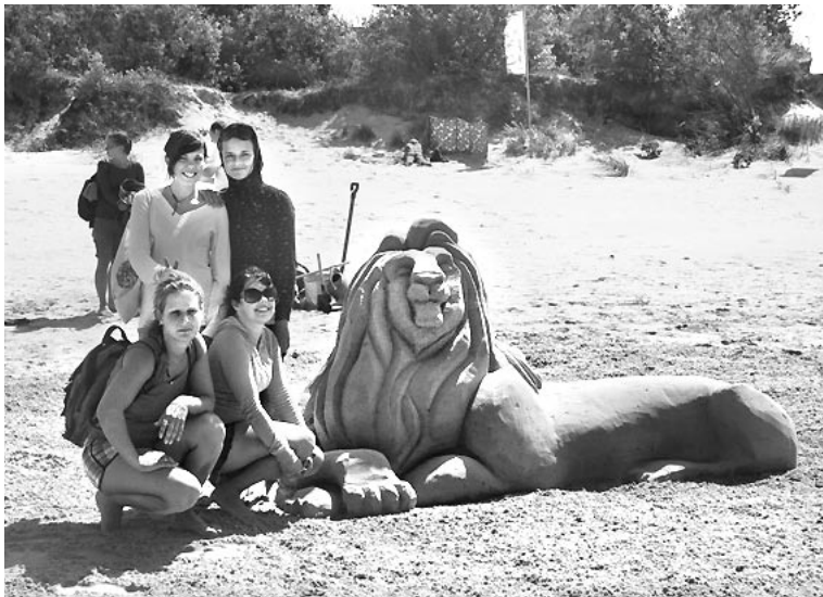
1. vieta – “Guli, Simba, guli”

Ķekavas mākslas skolas direktores vietniece mācību un audzināšanas darbā