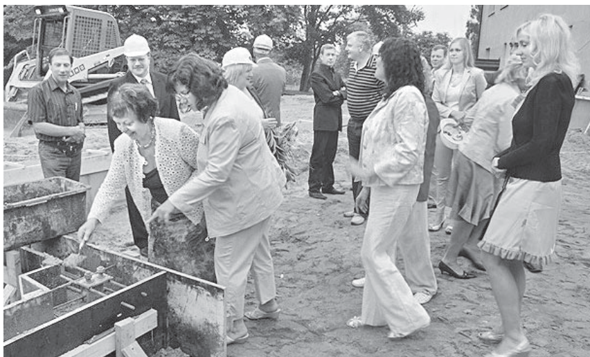
Savu roku jaunbūves tapšanā pielika arī Pļavniekkalna skolotājas.