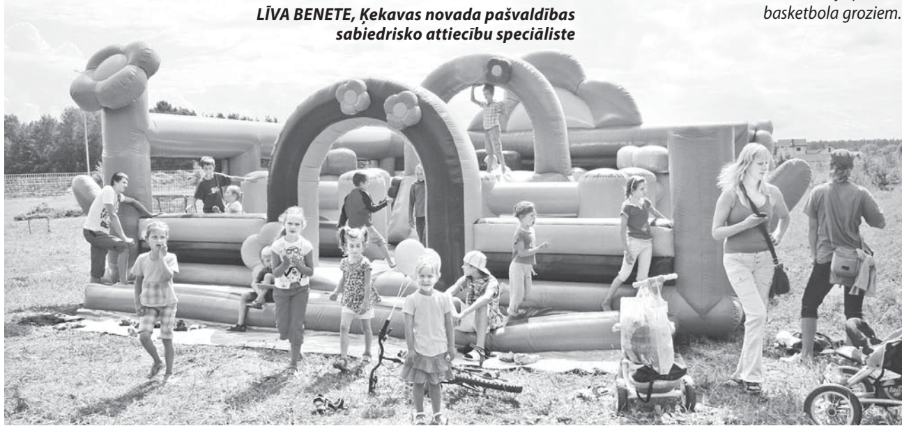
Mazajiem svētku dalībniekiem prieku netrūka.