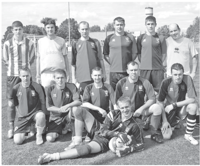
Baložu futbola komanda gatava startam.