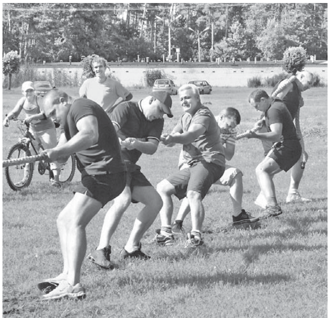
Pārbaudījums īstu viru spēkam.