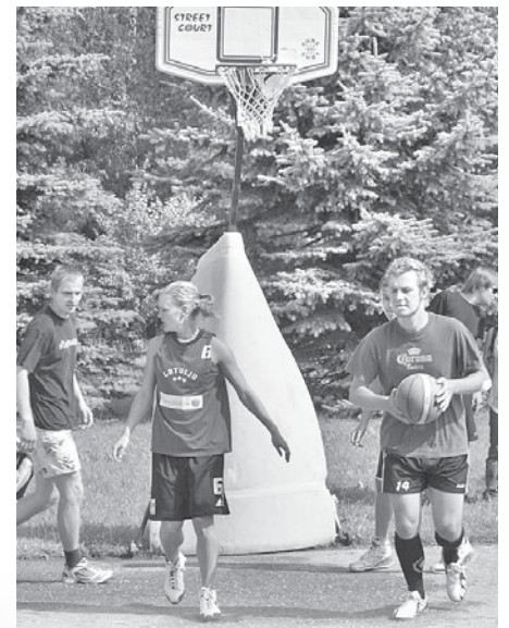
Vislielākā rosme valdīja pie ielu basketbola groziem.