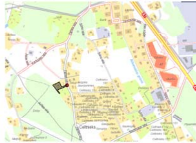
PROJEKTĒTO SARKANO LĪNIJU PAGRIEZIENU PUNKTU KOORDINĀTAS (LKS-92)