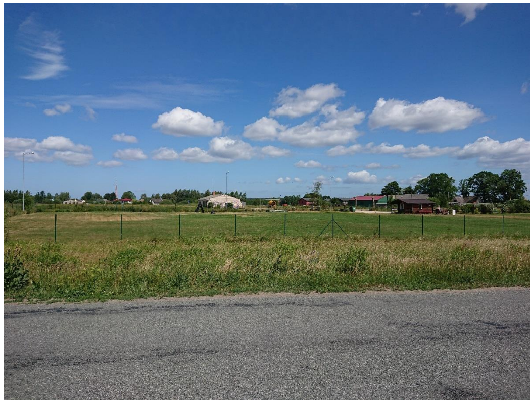
1.attēls. Skats uz detālplānojuma teritoriju no valsts vietējā autoceļa V2